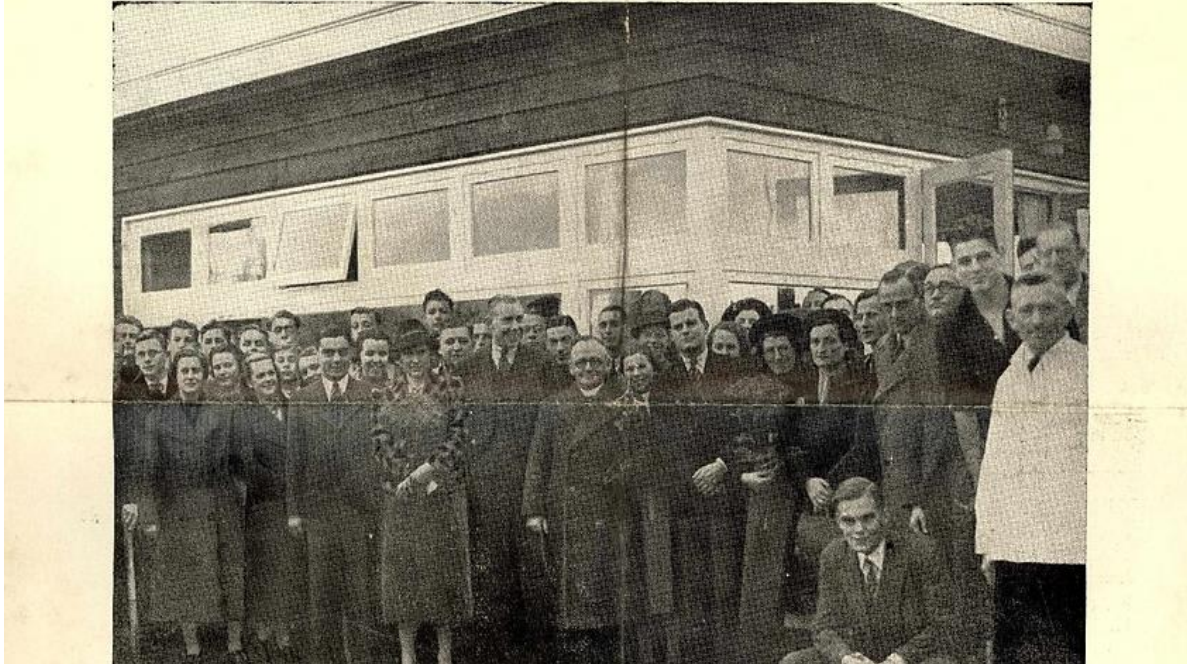
Opening van het clubgebouw van de LOHC in 1937

Copie voor het volgende nummer moet uiterlijk Maandagavond 13 December in het bezit zijn van H. de Koster.