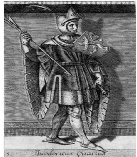
Dirk IV (Wikipedia)

Al sinds die 12 e eeuw hadden de graven van Holland een binding met Leiden: de Burcht, toen vermoedelijk nog van hout. Ze hadden er zelfs twee, ook één in Rijnsburg, u herkent dat nog aan de plaatsnaam. Omdat onze diverse Hollandse graven zich niets aantrokken van de wetten en de verordeningen van de keizer, kwam Hendrik III in 1047 met een leger om die opstandige graaf Dirk IV eens goed mores te leren. Hij vernietigde de burcht waar Rijnsburg naar genoemd is, maar hij wist niet dat onze graaf luttele kilometers stroomopwaarts nog een burcht in Leiden had.