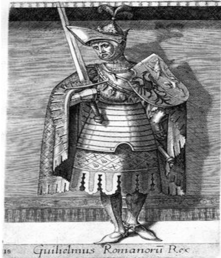
Roomsch Koning Willem II (Wikipedia)

Willem II was pas 7 jaar oud toen hij zijn vader Floris IV in 1234 opvolgde, dus volgde er een regentschap van twee broers van Floris IV: Otto (bisschop van Utrecht) en Willem, tot aan de 12 e verjaardag van de jonge Willem II; vanaf 1239 regeerde hij zelf.