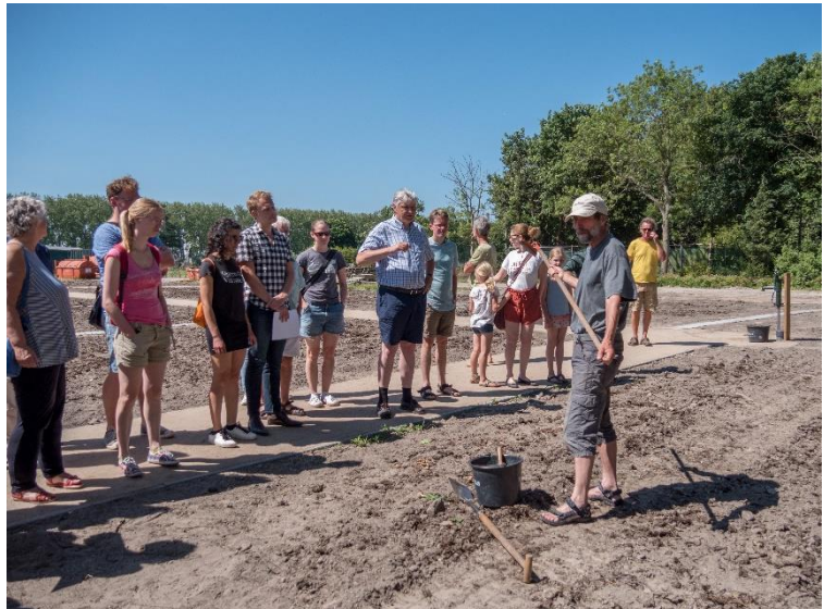
Nieuwe tuinders worden ingewijd in de grondbewerking op het nieuwe terrein. Ook de pomp is te zien.

De tuinders komen zowel uit Leiden als uit Oegstgeest, het complex ligt dan ook op de grens van de twee gemeenten. In diverse commissies regelen de leden het reilen en zeilen van de vereniging, zoals een zaadinkoopcommissie, commissie flora en fauna, bouwcommissie en er is een informatiemap. Ook is er voor de nieuwe leden een introductiecommissie actief en zijn er tuinmaatjes om aan hen die willen raad te geven.