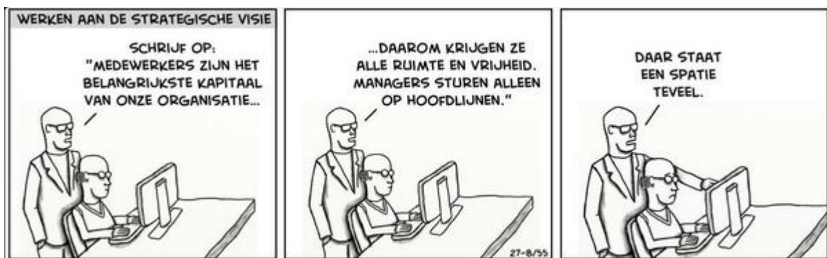
© Van 9 tot 5 cartoons