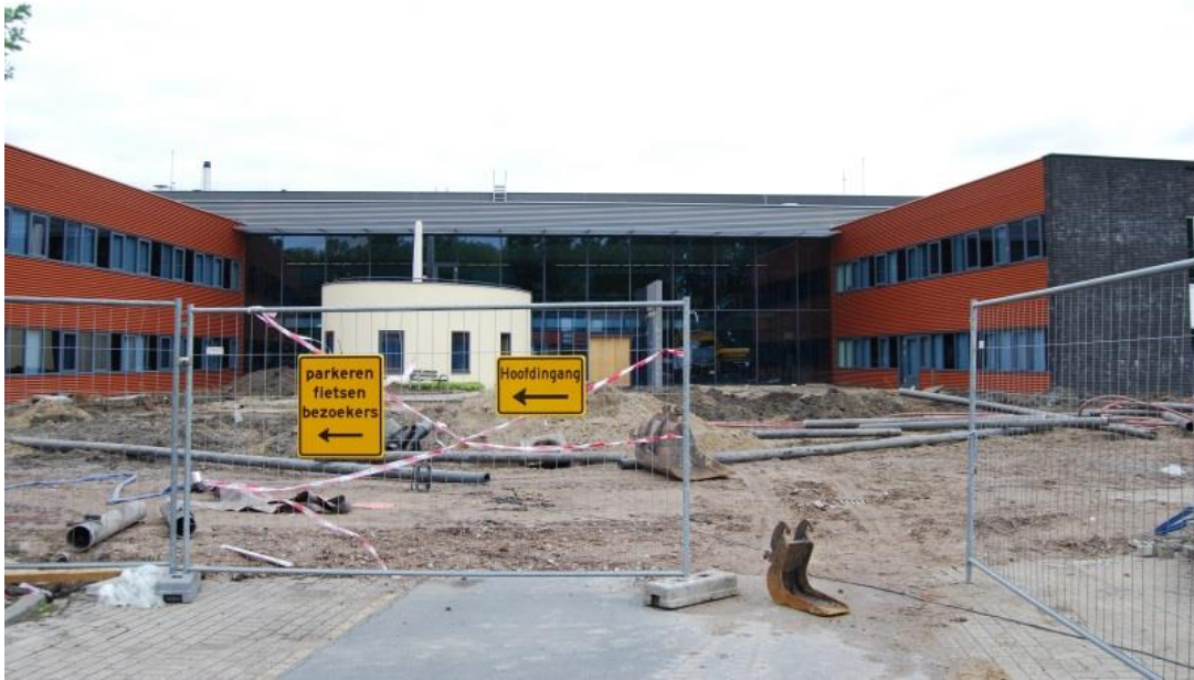
September 2013 -de oude hoofdingang is nog zichtbaar

Als de bouw voorbij is, zullen er meer parkeerplaatsen zijn voor medewerkers. Desalniettemin is het gevolg van ons huidige parkeerbeleid gunstig voor de patiënten die slecht ter been zijn; zij kunnen nu altijd vlakbij de ingang van het revalidatiecentrum parkeren.