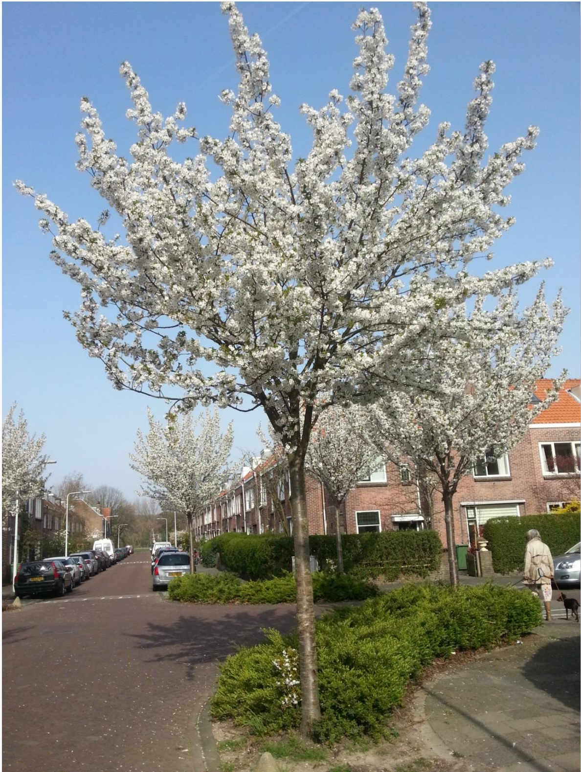
Lente op het kruispunt Merelstraat Lijsterstraat