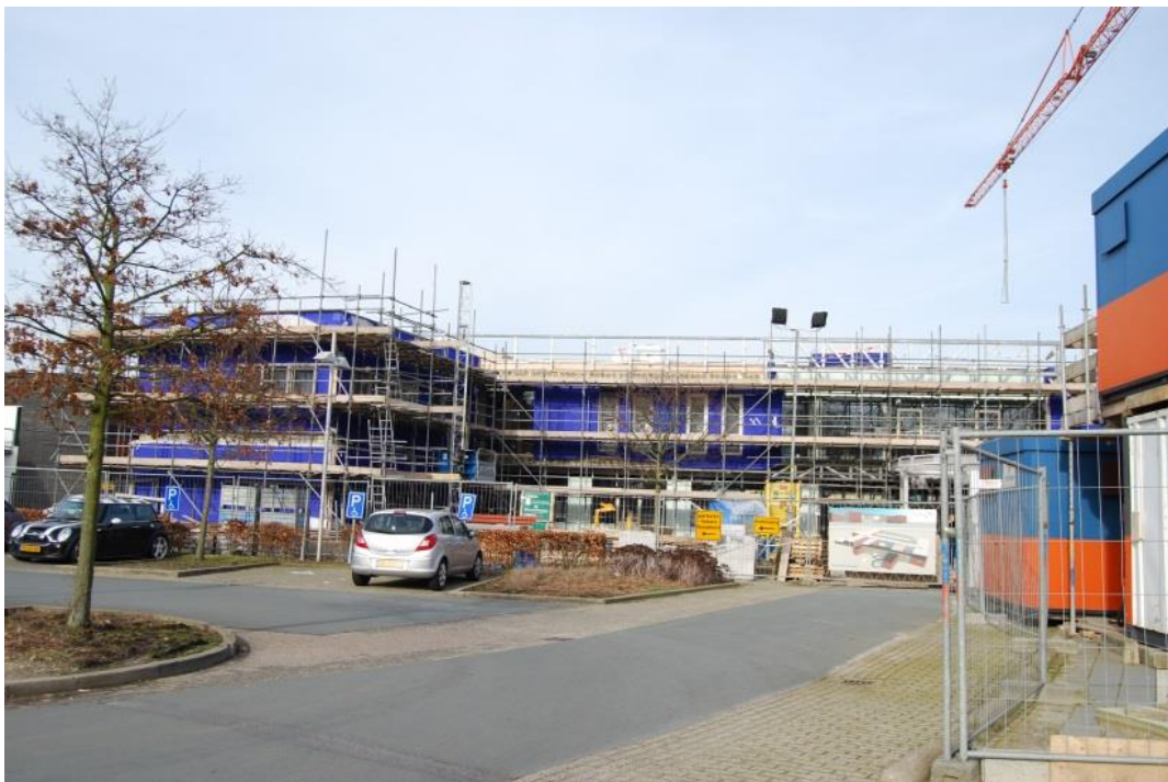
Maart 2014 - een heel ander aanzicht door de nieuwbouw