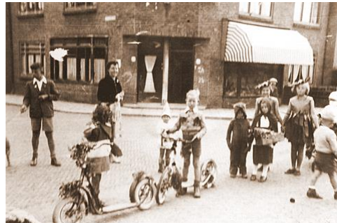
Versierde stappen optocht tijdens jubileum 1951