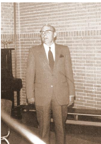
Voorzitters uit de eerste jaren

De speeltuin Vogelwijk bestaat al 60 jaar. In mei 1946 werd de vereniging opgericht, met veel naoorlogs ideaal, maar met bescheiden middelen. En er waren 355 gezinnen lid. Twee jaar na aanvang werd de speelweide geopend en al spoedig erna kwamen er een wip, goal- en korfbalpalen. In 1951 was het ledental flink teruggelopen, maar een subsidie van de gemeente hielp weer voor een opleving. Er kwam een speeltoestellen-fonds en een spaarfonds voor kamperen e.d. In 1958 verscheen er een mooie glijbaan. Nog steeds was er geen gebouwtje en mocht er incidenteel gebruik worden gemaakt van de kantine van de voetbalvereniging Pomona aan de overzijde van de Nachtegaallaan. In 1960 dreigde er zelfs een verhuizing van de speeltuin wegens een gemeentelijk plan voor de Pesthuispolder. Dat liep goed af. Eindelijk in 1975 kan dan het gebouw 't Vogelnest feestelijk worden geopend. En nu dan, na het feest onlangs van het 60-jarig bestaan, is er weer een grondige verbetering gaande, om weer vele jaren nuttig te zijn voor kinderen, ouders en buurten.