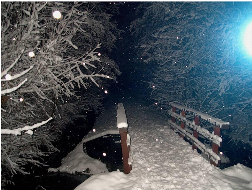
Brug in de nacht

Hier een paar foto's die laten zien hoe mooi het allemaal was. (Op www.vogelwijk.nl zijn ze in kleur te zien !)