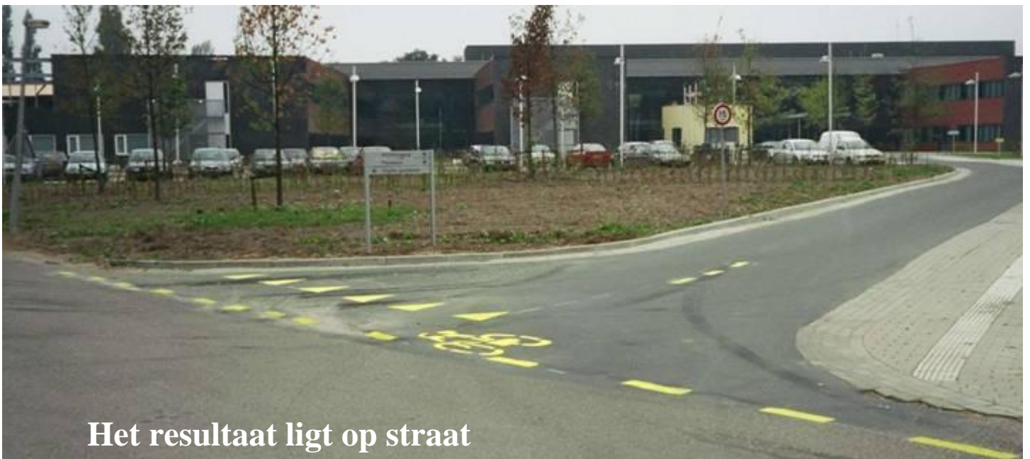
Het resultaat ligt op straat

De Vogelwijkers zijn - zoals bekend - altijd vol met goede initiatieven. Dit maal was het Hans Diehl (Lijsterstraat) die een “VSOP” (Vogelwijkse Straatmarkering Ouderen Ploeg) in het leven riep. Op woensdag 13 augustus werden ter plekke de tekens in fel geel op de straat aangebracht, om de fietsers en de automobilisten te helpen. Dat gebeurde in afwasbare verf, opdat de officiële straatmarkering goed en hopelijk spoedig, en definitief verschijnt. Het voetpad dient te worden doorgetrokken, zodat duidelijk wordt dat het gaat om een in- en uitrit zonder voorrang bij de Nachtegaallaan.