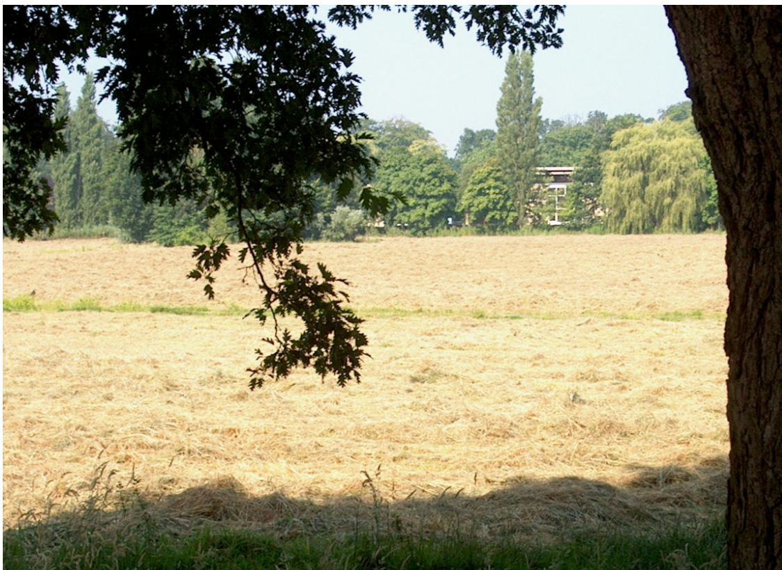
Een zomers weiland