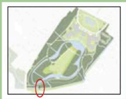
Locatie vloderbrug in het Bos van Bosman