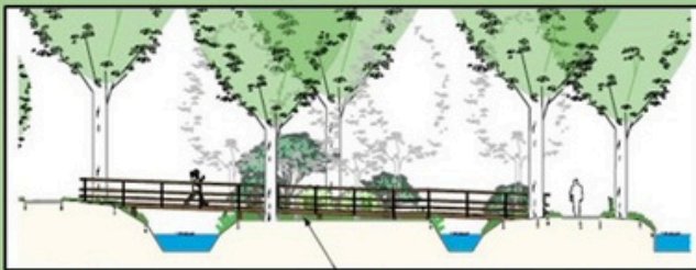
Langsdoorsnede brug over het eilandje