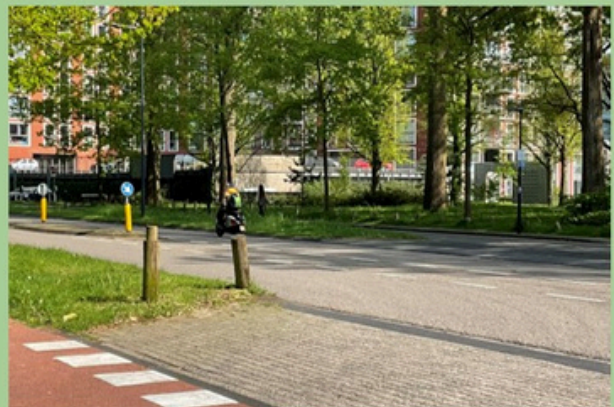
De kruising Wassenaarseweg-Blauwe Vogelweg met rechtsachter de poort in het Schilperoortpark