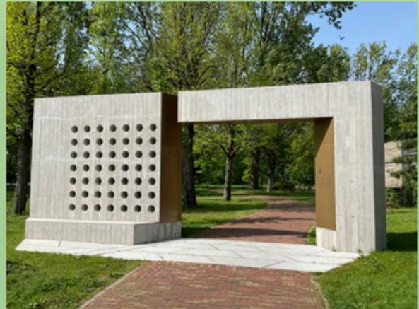
De poort gezien vanuit het Schilperoortpark met een doorkijk naar het Bos van Bosman waar de toegang met de vloderbrug moet komen