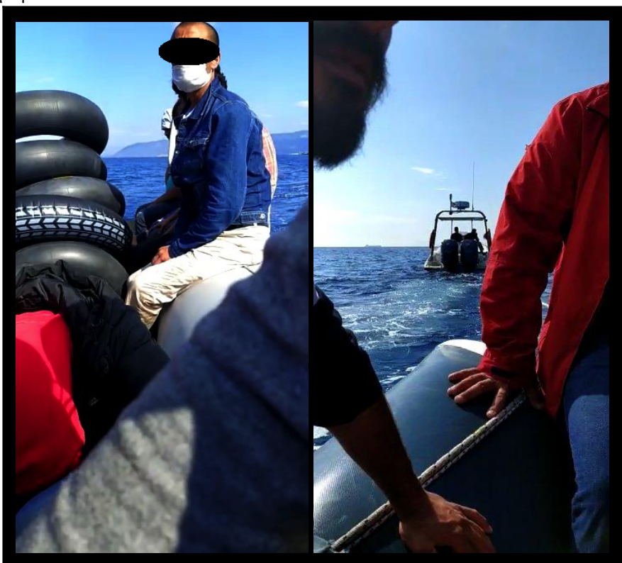
Εικόνες 9 & 10: Στιγμιότυπα από βίντεο που τραβήχτηκε στις 19 Ιουνίου 2020, δείχνουν μια βάρκα με φόντο το νησί της Λέσβου και την Ελληνική Ακτοφυλακή να ρυμουλκεί μία βάρκα.

Σύμφωνα με την μαρτυρία ενός επιζώντος, η βάρκα βρισκόταν περίπου 50 μέτρα από την ακτή της Λέσβου νωρίς το πρωί της 19ης Ιουνίου, όταν αναχαιτίστηκαν από την Ελληνική Ακτοφυλακή. Ρυμουλκήθηκαν από το ελληνικό λιμενικό στην ανοιχτή θάλασσα του Βορείου Αιγαίου ανάμεσα στη Λέσβο και την Τουρκία και εγκαταλείφθηκαν εκεί.