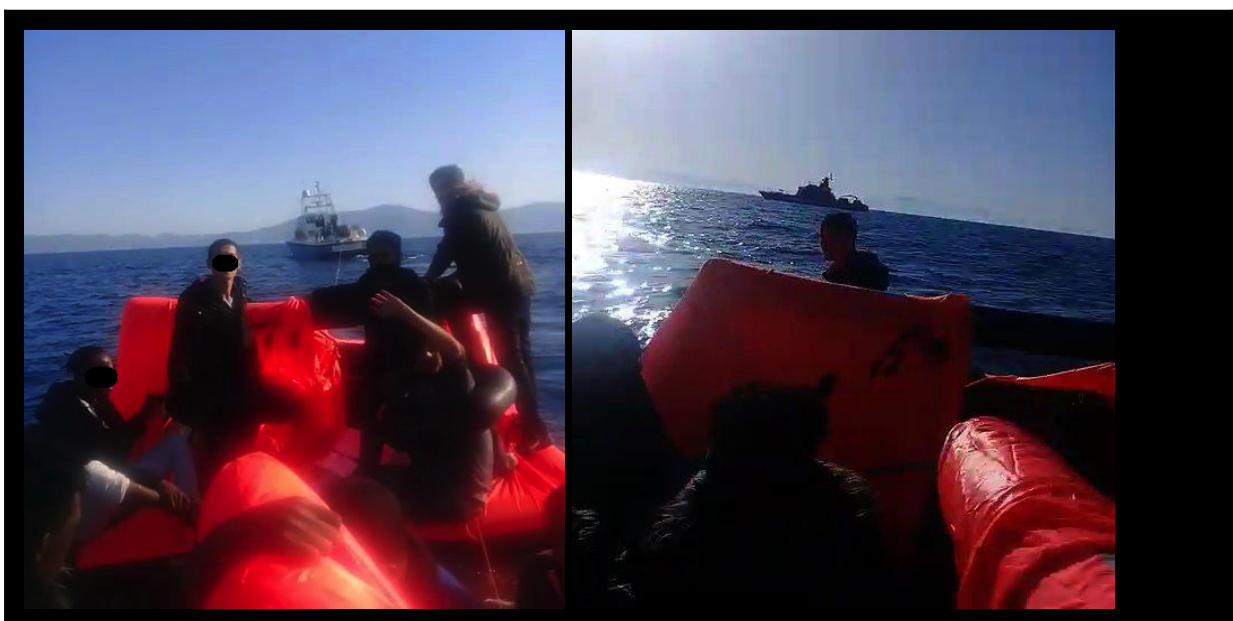
Εικόνες 7,8: Στιγμιότυπα από βίντεο που τραβήχτηκε στις 13 Μαΐου 2020, δείχνει σωσίβιες σχεδίες να ρυμουλκούνται από την Ελληνική Ακτοφυλακή (όλα τα βίντεο είναι διαθέσιμα)