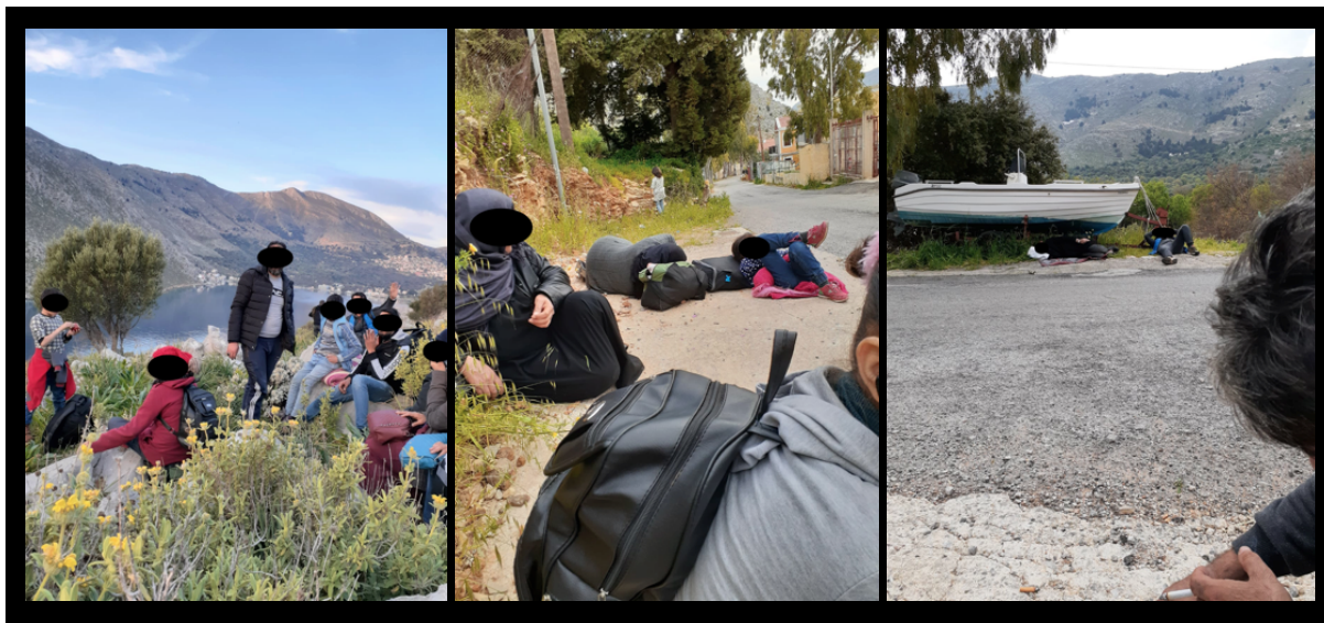
Εικόνα 2: Φωτογραφία με άτομα της ομάδας μπροστά από τον κόλπο Πεδή στη Σύμη, που τραβήχτηκε στις 21 Μαρτίου 2020.

Τα άτομα της ως άνω ομάδας περπάτησαν για αρκετές ώρες στους λόφους και κατά μήκος των δρόμων της Σύμης, με σκοπό να έρθουν σε επαφή με τις ελληνικές αρχές και να δηλώσουν την πρόθεσή τους να αιτηθούν άσυλο. Περίπου στις 12.30μ.μ., κάθησαν στην άκρη του δρόμου για να ξεκουραστούν, από όπου τραβήξαν μερικές φωτογραφίες, και έστειλαν την τοποθεσία GPS σε ένα φίλο (36°37'08.7"N 27°52'05.0"E) Και τα δύο στοιχεία επιβεβαιώνουν ότι βρισκόνταν στον κόλπο Πεδή στη Σύμη (Βλέπε Εικόνα 1).