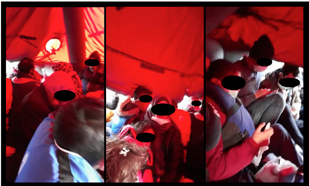
Εικόνα 5: Στιγμιότυπο από βίντεο που τραβήχτηκε από επιζώντα μέσα από τη σχεδία στις 23 Μαρτίου 2020.

Όταν έφτασε η Τουρκική Ακτοφυλακή, τα θύματα της απέλασης μεταφέρθηκαν σε μεγαλύτερα σκάφη και έπειτα τους πήγαν σε ένα λιμάνι στην τουρκική πόλη Datça, περίπου 20 χλμ. από τη Σύμη, το οποίο επιβεβαίωσαν με το χάρτη στα τηλέφωνα τους. Αφού πέρασαν μια νύχτα υπό κράτηση στο λιμάνι της Datça, οι τουρκικές αρχές μετέφεραν την ομάδα των ατόμων στη Μαλάτια όπου συνέχισαν να κρατούνται.