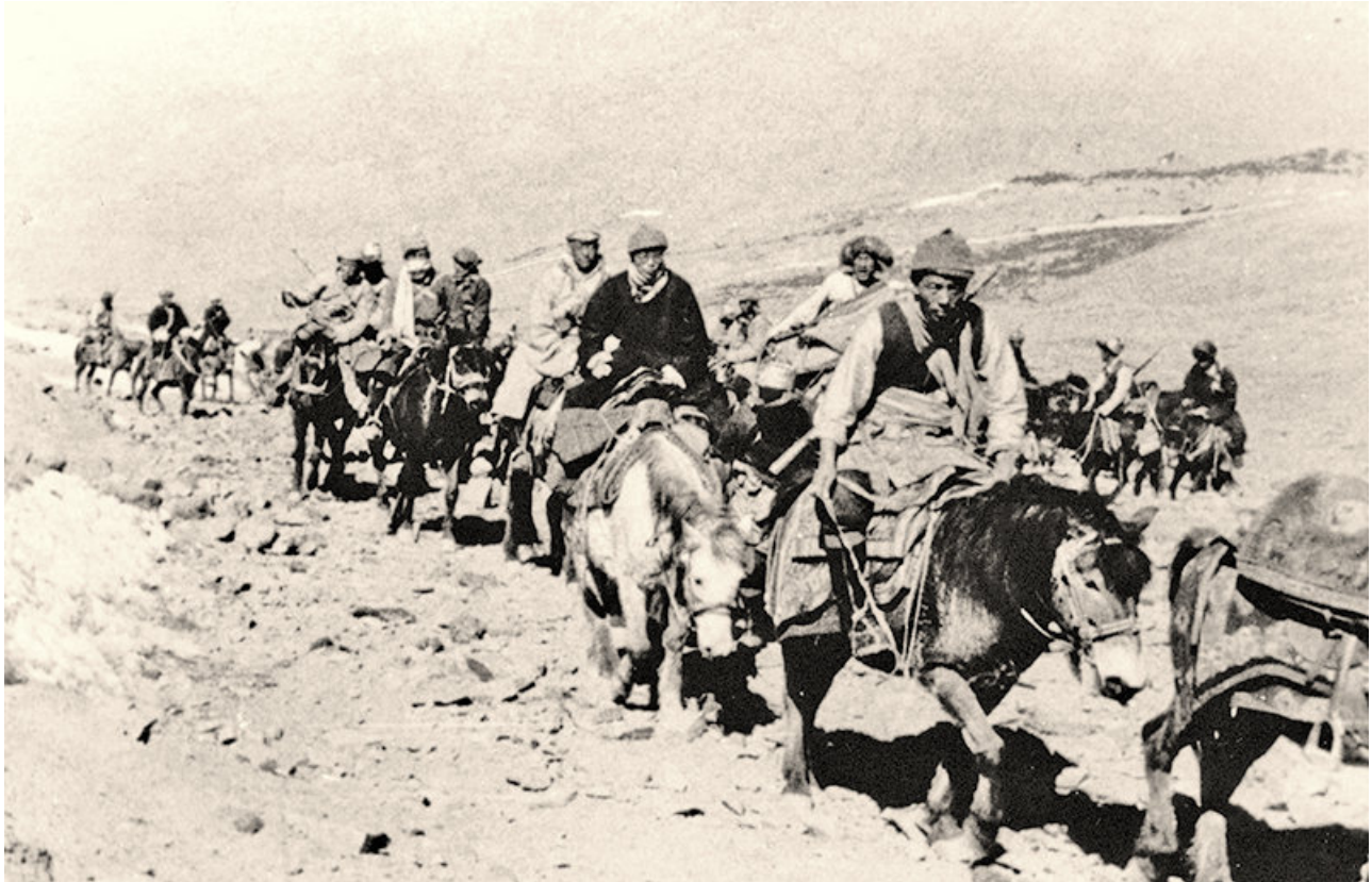
H.H. Dalai Lama XIV krydser Himalaya fra Tibet til Indien, 1959

af Lakha Lama (2009), oversat af Pia Kryger