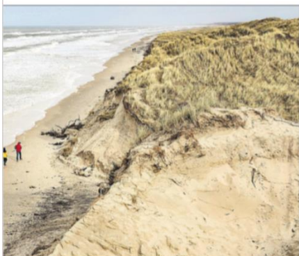
Stranden ved Tversted 23. februar 2022. Der blæser ikke ret meget, alligevel er vandet langt inde.