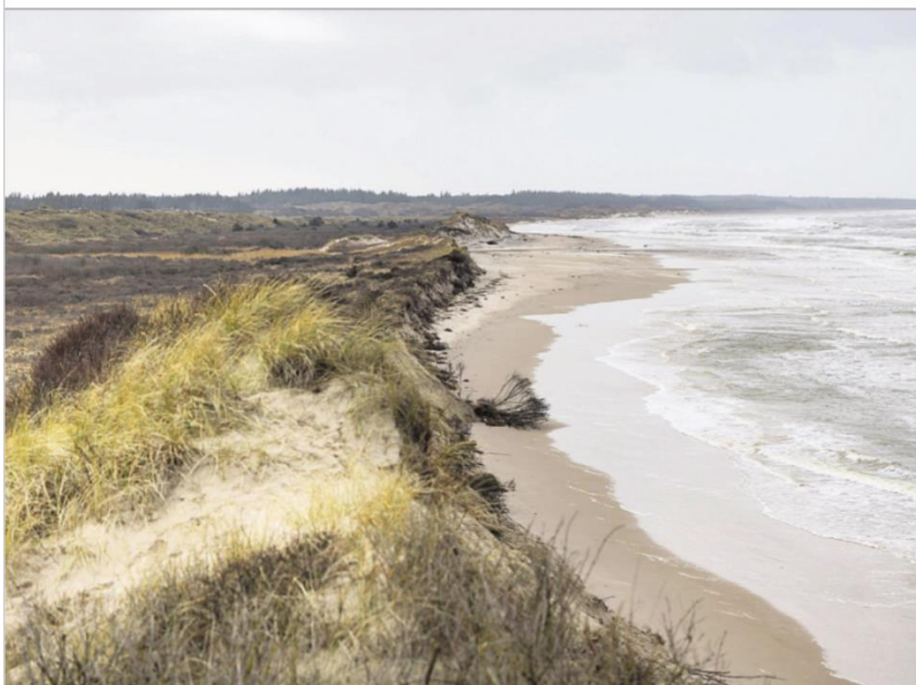
Herfra ses det tydeligt, at vandet går længst ind ud for Uggerby Å. Her er der forsvundet 200-300 meter af stranden.