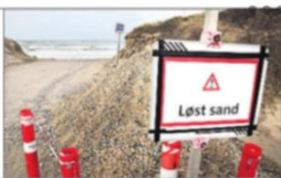
Ved stormen Malik 29. januar var vandet oppe til dette skilt.