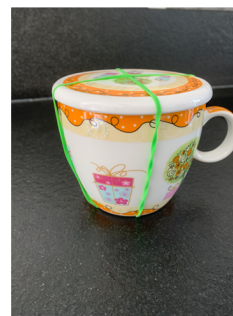
maak losse delen vast aan elkaar

Als je meerdere stukken in een pakket aanbiedt zorg dan dat ze goed samen blijven, door ze samen te binden of te plakken. Het artikel moet wel nog goed zichtbaar zijn zodat me ze kan bekijken zonder ze uit te pakken.