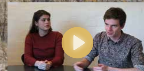
Elev/Studerende: Om optagelsesprøven til arkitektstudiet

Kunstens stemmer dækker kerne- stoffet i billedkunst på niveau C og B, men kan også bruges i forsøgsfaget billedkunst A.