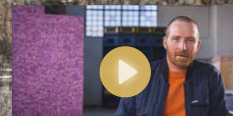
Kunstner: SUPERFLEX fortæller om udvalgte projekter