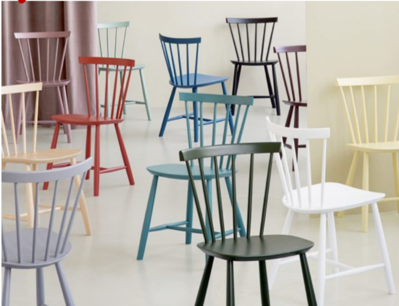
J46-pindestolen er designet af Poul M. Volther i 1956 og produceret af FDB. Foto: FDB Møbler, Stylist: Katrine Kaul

https://designetc.dk/guide-kritisk-formidling/