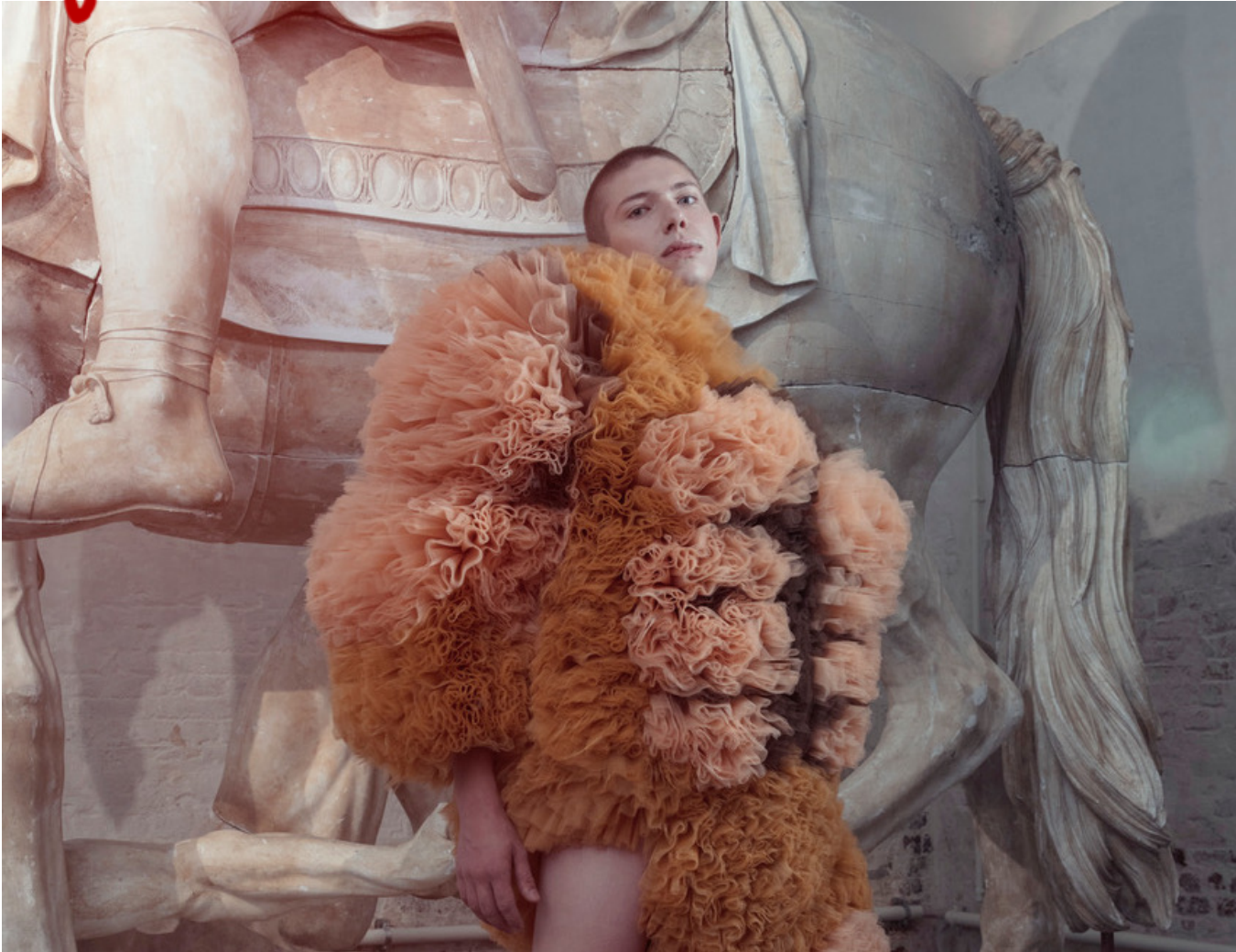
Nicolas Nybros kollektion SS18.