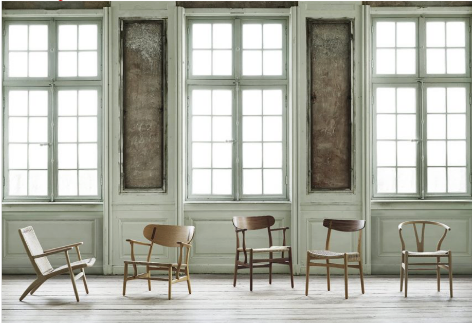
Et udvalg af klassikerne fra Carl Hansen & Søn. Pressefoto https://designetc.dk/tema-moebel/