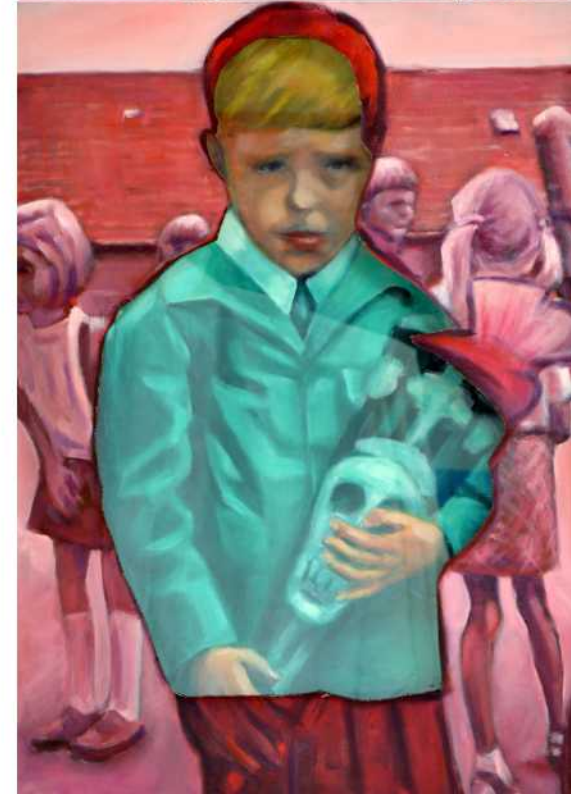
„ICH HAB'S GEAHNT - SCHLUSS MIT LUSTIG“ , Öl auf Leinwand, 100 x 70 cm, 2018