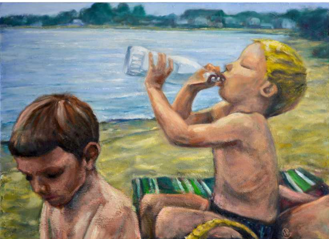
STRAND I , Öl auf Leinwand, 100 x 140 cm, 2018