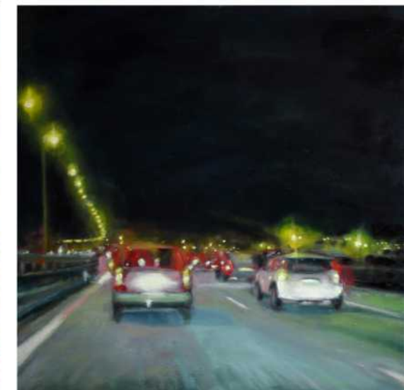
A7 - COMING HOME, Öl auf Leinwand, Diptichon, je 80 x 80 cm, 2018