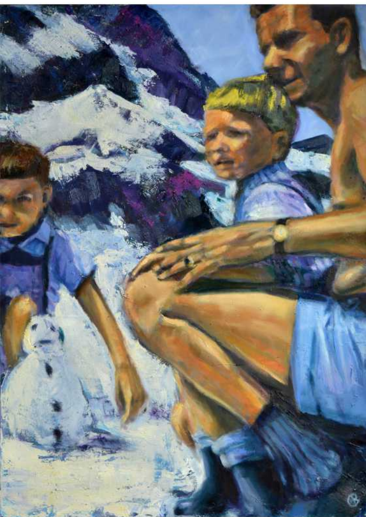
GIPFELSTÜRMER - oder: wie aus einem Heimatfilm, Öl auf Leinwand, 140 x 100 cm, 2018