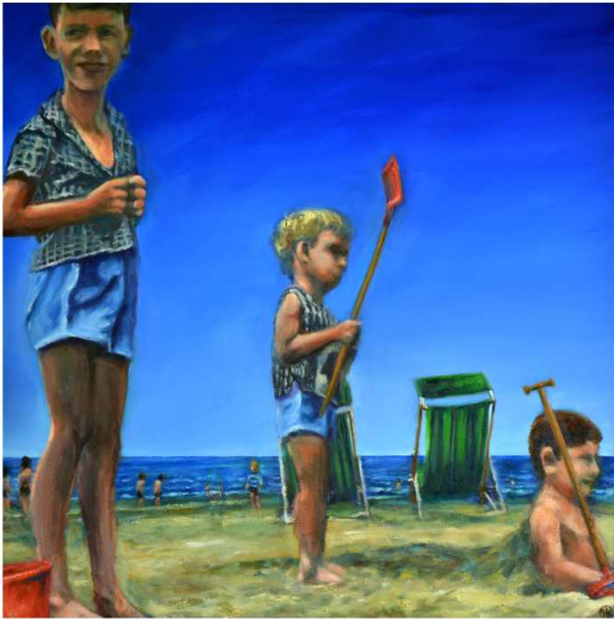
STRAND II - OHNE WORTE , Öl auf Leinwand, 120 x 120 cm, 2018