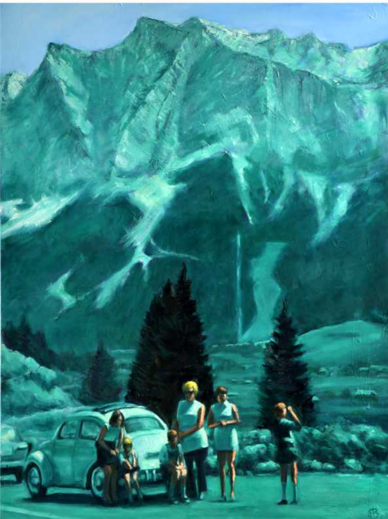
ZUGSPITZE - „FAMILY PORTRAIT“, Öl auf Leinwand, 160 x 120 cm, 2018