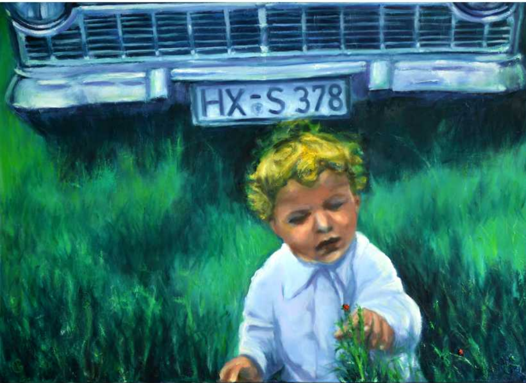
BESSER VOR'M FORD, ALS DRUNTER , Öl auf Leinwand, 100 x 140 cm, 2018