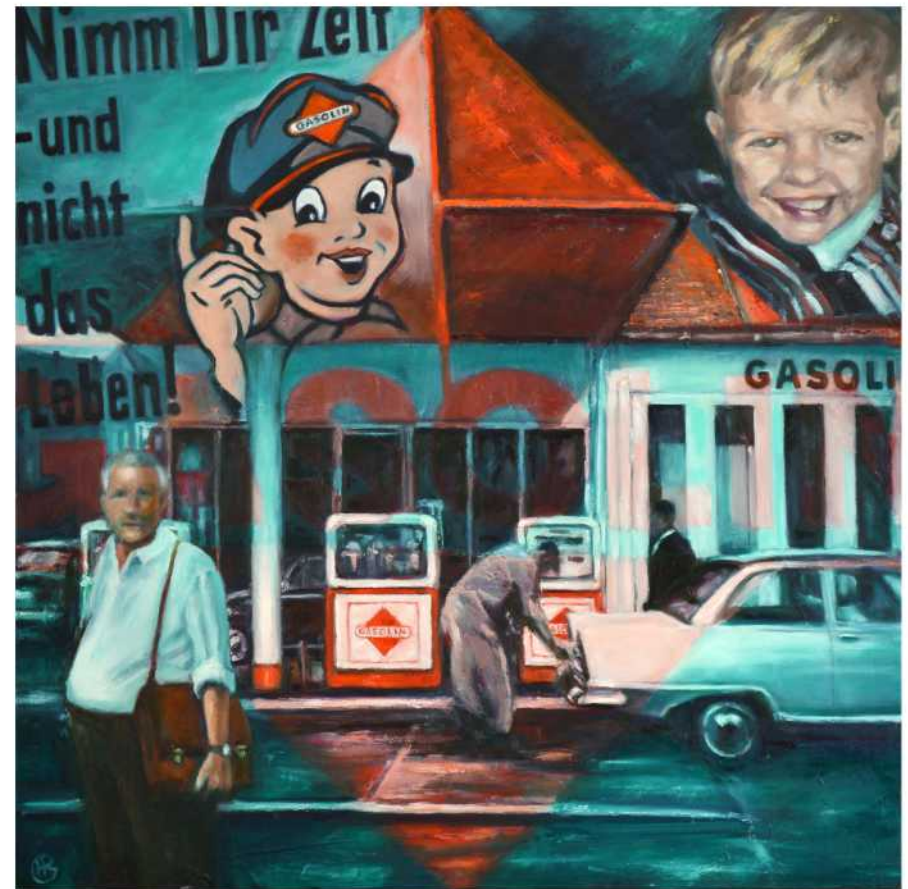
NIMM DIR ZEIT... , Öl auf Leinwand, 120 x 120 cm, 2018

Element Erde. In den Untergrund wurde Blumenerde mit eingearbeitet. Symbolisch für Mutter Erde. Erde als Ursprung des Lebens. Auch dieses Bild entstand in den ersten Lebensjahren, an meinem ersten Wohnort.