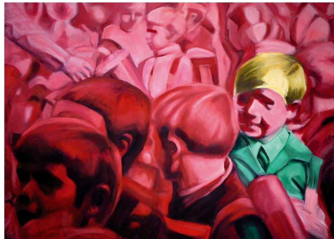
NOCH LACHST DU , Öl auf Leinwand, 100 x 140 cm, 2018

Im Bilduntergrund wurde Sand vom Strand verwendet, sowie Salzwasser aus der Förde. Der Sand stammt zum einen vom Elbstrand von Kraut-sand. Hier hat der Künstler wichtige Jahre seines Lebens verbracht, bevor er dann nach Flensburg zog. Außerdem wurde Sand vom Strand der Flensburger Förde verwendet (vom Ostseebad). Das für das Anlegen der Untermalung verwendete Salzwasser stammte ebenfalls vom Ostseebad.