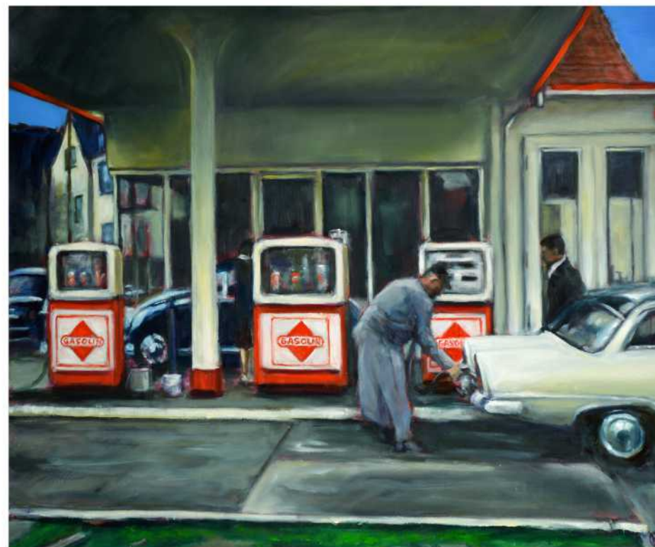
GASOLIN - ,OPPAS' TANKSTELLE, Öl auf Leinwand, 100 x 120 cm, 2018

Hier befindet sich sowohl in der Unterma- lung als auch in den oberen Ölfarbschichten, Glimmer. Dieser wurde vorher im Mörser zerkleinert.