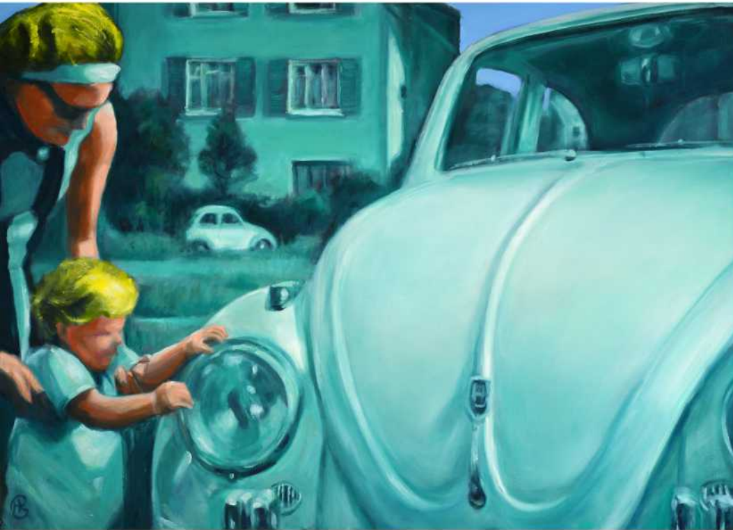
KRABELKÄFER , Öl auf Leinwand, 100 x 140 cm, 2017 / 2018