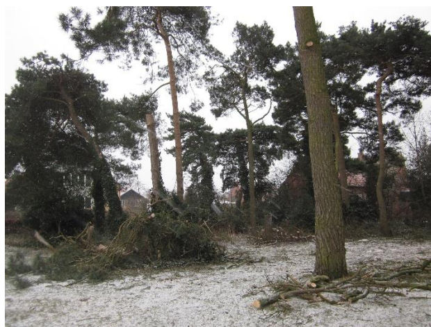
Træfældning i anlægget

Her har dobbelthus sagen været et stort emne, hvor kommunen nu ikke bare må godkende projekter til udførelse af dobbelthuse i villaområderne, samt ophævelse af villaservitutter. xxxx HOFOR har godkendt 27 klimaprojekter hvor de første går i gang i 2018. Der har været afholdt et bestyrelseskursus i november med deltagelse af 14 foreninger, det vil blive gentaget i 2018.