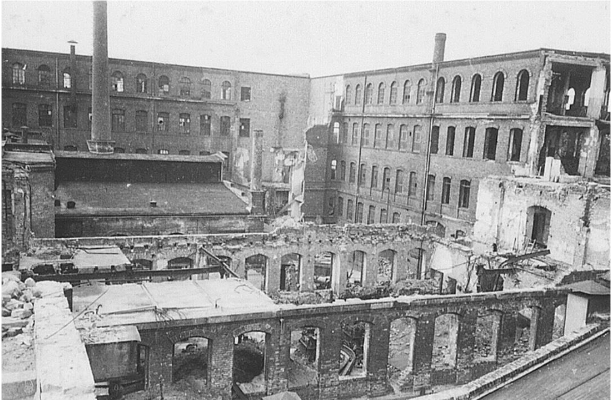
De fabriek van Seidel & Naumann na de oorlog