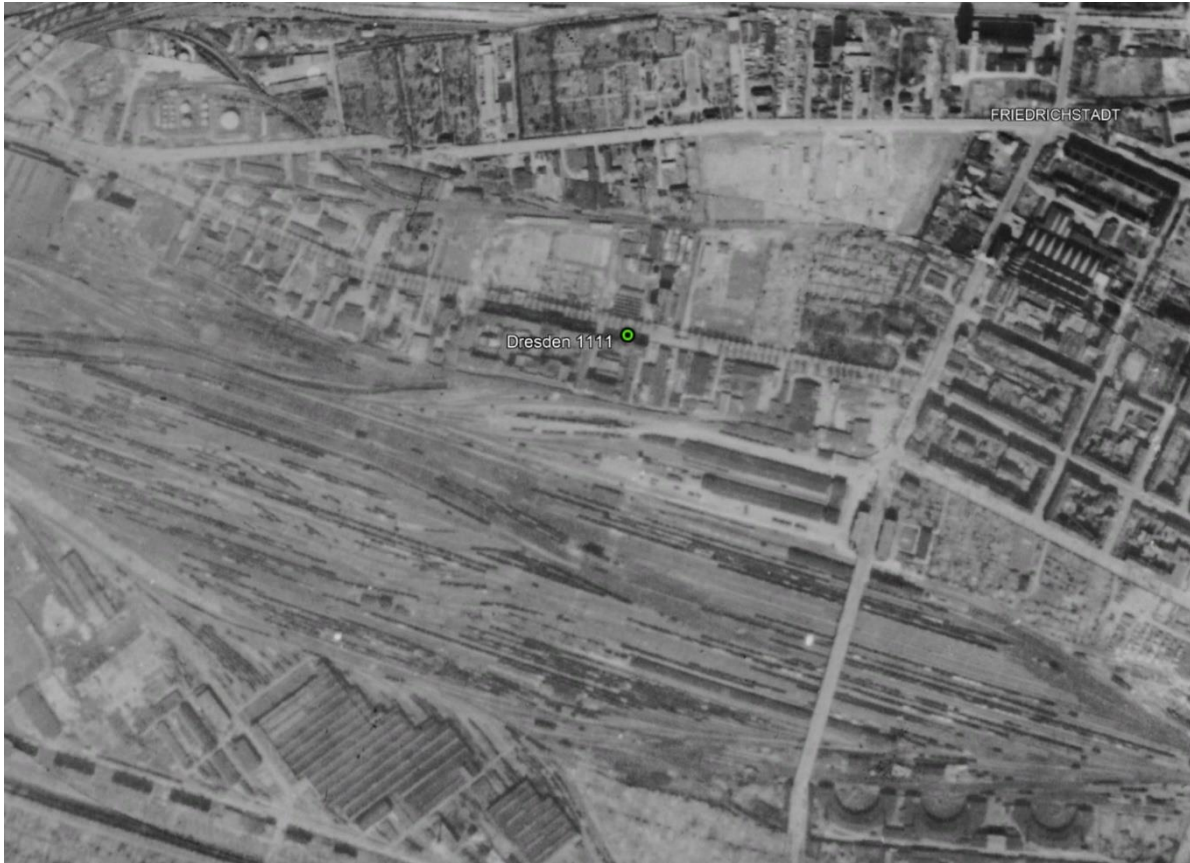
De ligging van de fabriek van Seidel & Naumann ten opzichte van het spooreplacement

aan hem geven en kregen nog slaag toe. Hij zag er wel goed uit. Als ik nu hoor dat iemand het concentratiekamp overleefd heeft, denk ik altijd, zou het een kapo geweest zijn ? Wij waren op het terrein betrekkelijk vrij, konden met de spoorweg mensen goed praten, deden ons werk, maar tevens snorden we langs de treinen of er wat van onze gading bij was. Je moest goed oppassen voor de spoorwegpolitie en als ze vroegen wat je daar deed zei je maar dat je peukjes aan het zoeken was. In mijn gedachten waren het allemaal oude mannen.