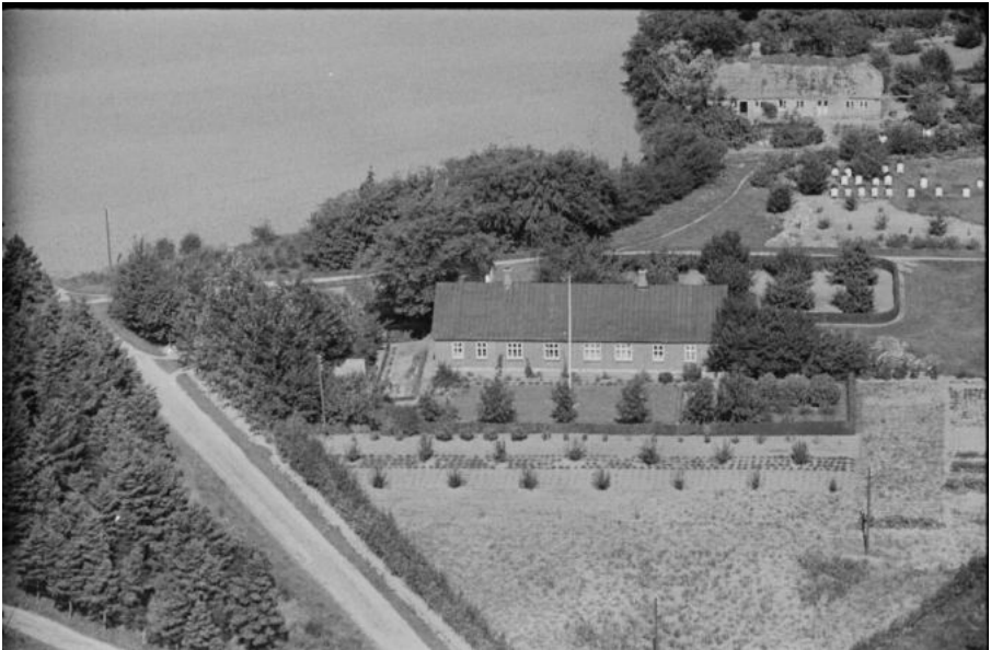
Krejbjerg Forsamlingshus. Fra 1902 til 1932 overtaget af Friskoleforeningen i Krejbjerg 1923. Fotoet er fra 1952 hvor huset blev brugt til privat bolig. Nu er det væk.