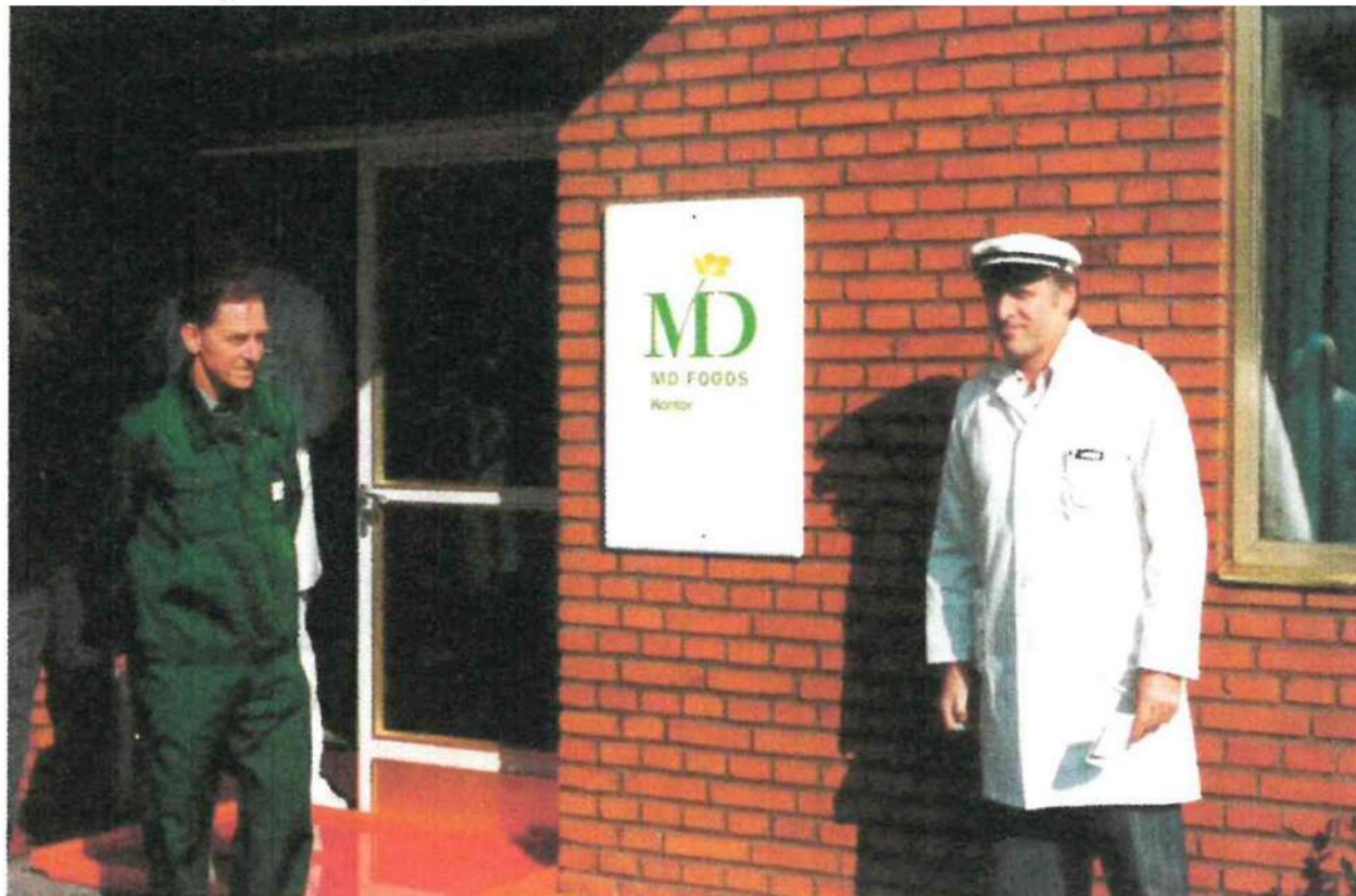
Navneskifte fra Høng Camembertfabrik til MD Foods, 1987.