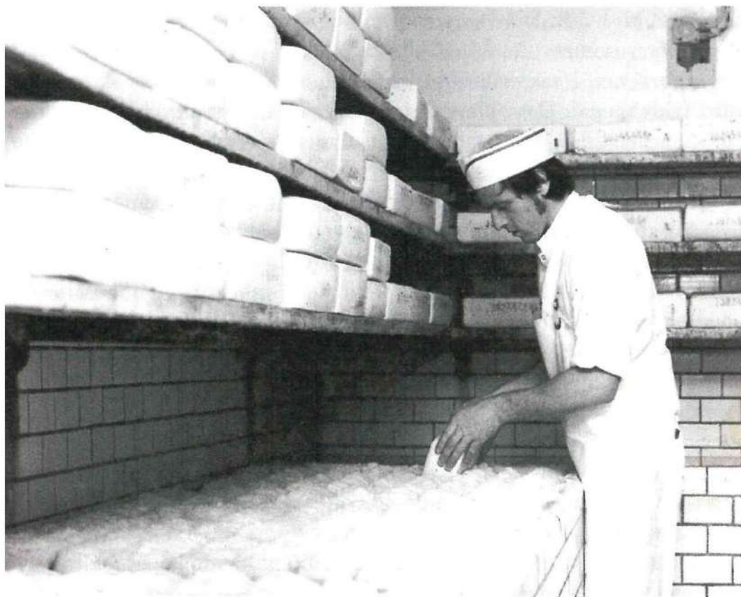
Lærlingetid i Salling 1963.