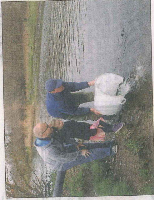
Spanden er også i brug, når der sættes ørreder ud.

Problemet var et lodret fald på cirka 40