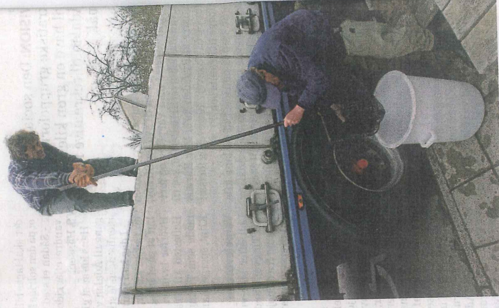
Tankene med fisk kommer frem på en lastbil.