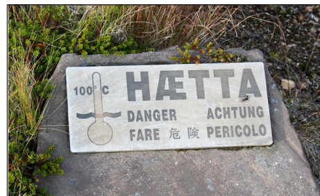
Geysir-området byr på mye bobling og utblåsing – det er påkrevet med skilting av vanntemperatur som kan komme opp i 130 grader C

sir betyr for øvrig naturlig varm kilde, som det er mange hundre av på Island. Vanntemperaturen er på kokepunktet og sies å kunne nå ca. 130 grader C på det meste!