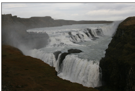
Den mektige Gullfoss, der elva Hvítá kaster seg utover

Gode og mette reiste vi videre til Gullfoss 120 km nordøst for Reykjavik. Fossen gjør et mektig inntrykk! Den består av to fall, ett øverst på 11 meter og ett litt lenger ned på 21 meter. Fossen har en middelvannføring på 109 m 3 i sekundet, men kan ved flom nå opp i svimlende 2000 m 3 i sekundet! Det tilsvarer 60 fulle transportkontainere med vann hvert sekund! Juvet nedenfor er 70 meter dypt og bidrar til inntrykket av «urnatur». Det strekker seg 2,5 km nedover elven.