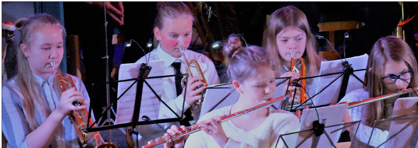
Noen av musikerne i Snertingdal og Gjøvik skolekorps