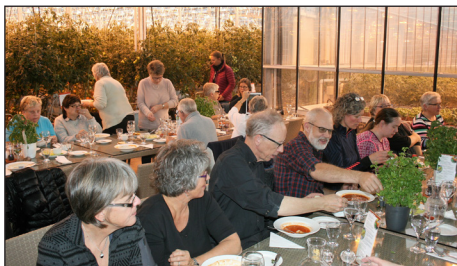
Lunsj i drivhuset på Fridheima

Så til veksthuset og lunsjen, ikke langt unna kirken. Det er gården Fridheima det er snakk om. Her dyrkes det tomater i stor stil, samt noe agurk, bær og krydderurter. Drivhusene har et samlet areal på rundt 5000 m 2 , og gårdens produksjon dekker nær 20 % av alle tomater som selges på Island. Stedet er fullt av tomater i full vekst – i alle størrelser, som høstes gjennom hele året. Det er unektelig en litt spesiell atmosfære å innta lunsjen blant planter og «eim av vekst». Og, selvsagt er det tomatsuppe som står på menyen, en svært så fyldig og NYDELIG sådan, med flere varianter av ferskt brød til. Tror sjansen er liten for å få noe lignende annet sted. Litt småhandel av