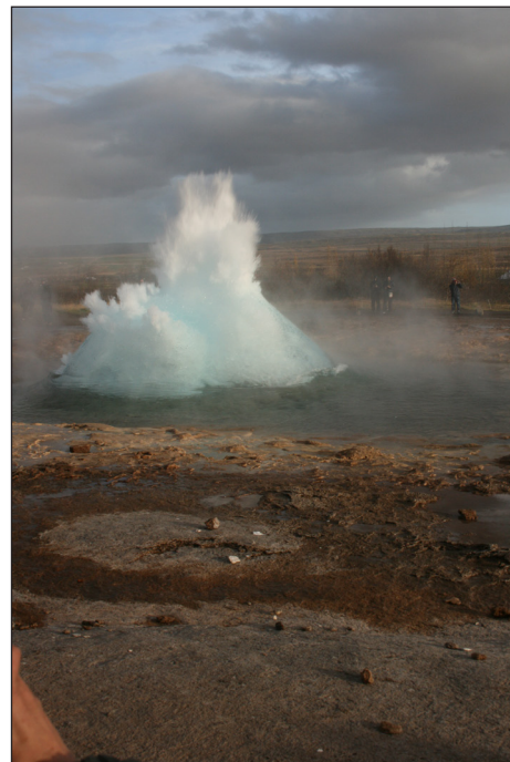
Den mest markante utblåsing i dag er det Strokkur som sørger for; spruten av varmtvann står mange meter til værs ca. hvert 6.-10.minutt

Neste stoppested var Geysir i det geotermiske området ved elva Hvítá øst for Reykjavik. Mens den kjente Geysir har svært uregelmessige utbrudd og kan være inaktiv i år om gangen, sørger Strokkur like ved for den største «underholdningen». Ordet gey-