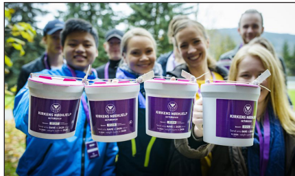
Konfirmanter samler inn: Det blir spennende å se hvor mye vi klarer å få i bøssene.

Også i år skal frivillige over hele Norge være med på å samle inn penger til brønnboring, latrinebygging og andre tiltak som redder liv rundt om i verden. Tirsdag 20. mars fra kl. 17.00 er den store innsamlingsdagen. Du kan være med å bidra når konfirmanter fra Snertingdal menighet skal gjennomføre årets aksjon, enten ved å være bøssebærer, sjåfør eller å støtte aksjonen.