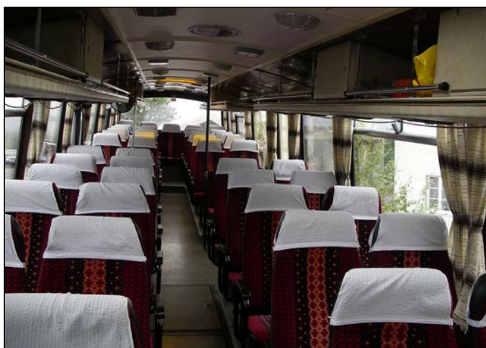
Setene i bussen fra 1981. Modellen er restaurert og i utrolig god stand! Den var blant de første med luftfjæring, noe som passasjerene merket godt på til dels humpete veier da Dagsenteret ved Snertingdal Omsorgssenter var på rundtur langs Rv 249, Øvre vei, Øverrovegen og Gilbergsrovegen tidligere i sommer.