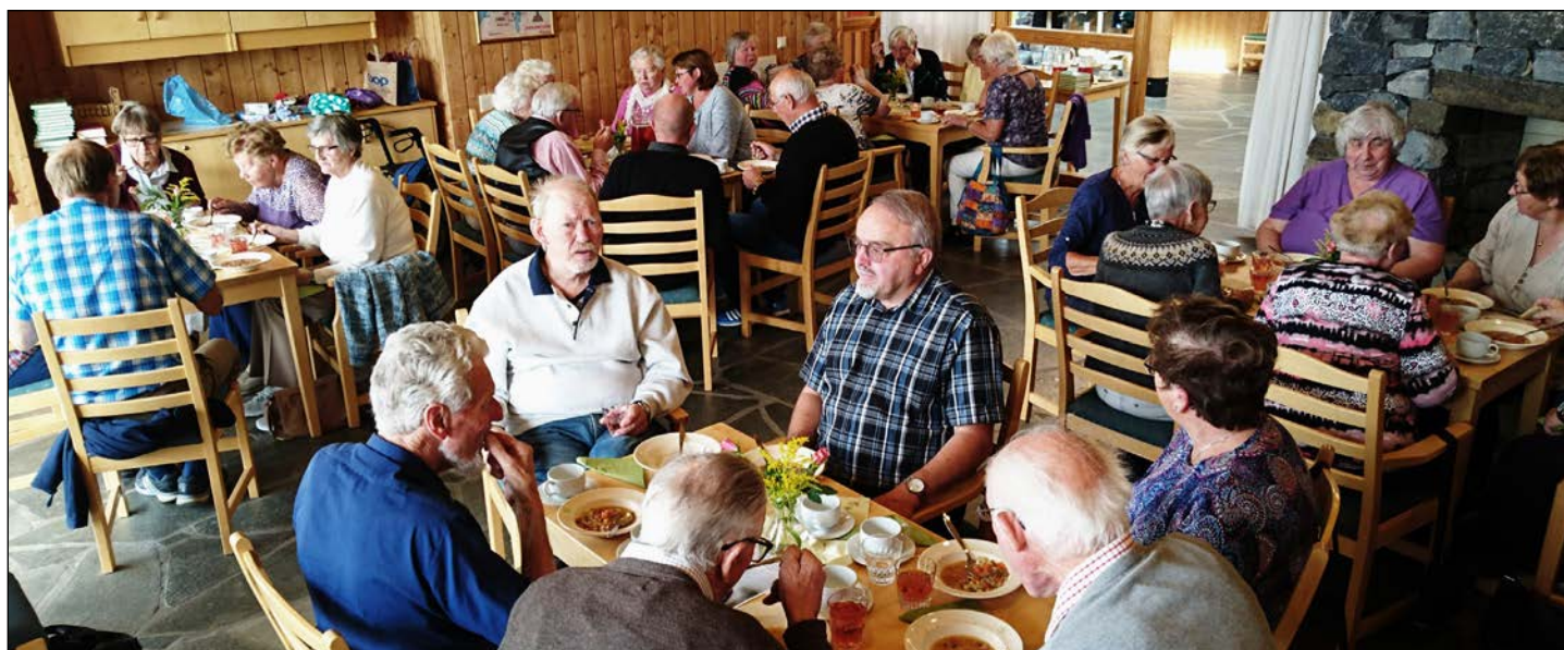
Mange deltok på første formiddagstreff i høst