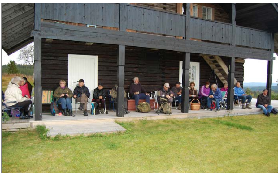
Det smakte godt med en kafferast