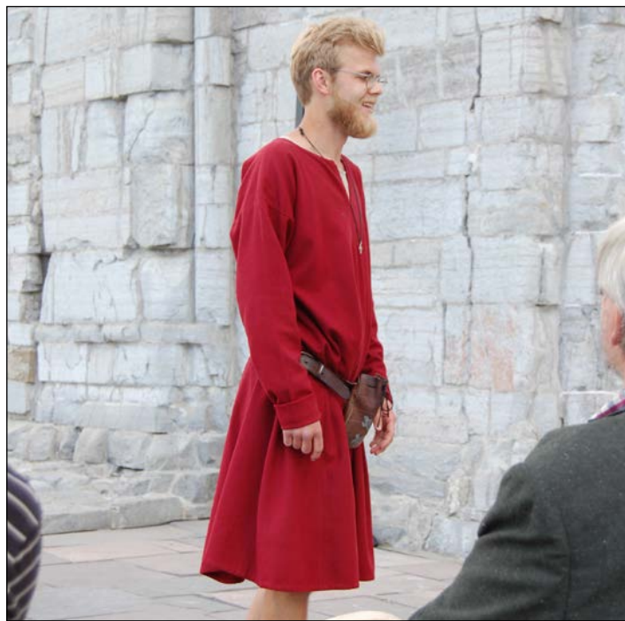
Inne i domkirkeruinene under glasstaket ble det en stemningsfull stund med gregoriansk sang av vår fantastiske guide iført middelalderkjortel