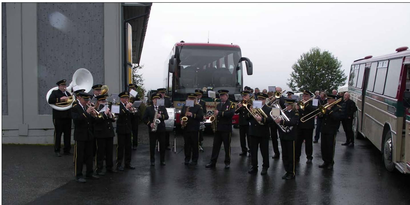
Musikk hører med når det skal feires. Her spiller Snertingdal musikkforening for «Auto-bussene» - årgang 2017 til venstre og årgang 1981 til høyre.

Selskapet ble i 2005 velfortjent kåret til «årets Snertingdøl». I begrunnelsen står å lese: «Snertingdal Auto bidrar til god reklame for bygda det ganske land rundt, ja endog i utlandet gjennom sine turoppdrag ...» Og, utenlandsturer har det vært flere av, ikke bare til naboene i Norden, men også til England, Skottland og Nederland. Selskapet berømmes også for arbeidsplassene de skaper og for sponning av organisasjoner i bygda.