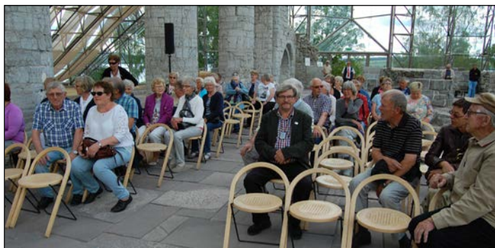
Vi fikk informasjon og omvisning på Domkirkeodden