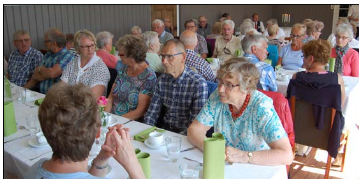
Vi spiste middag på Hamarstua spiseri