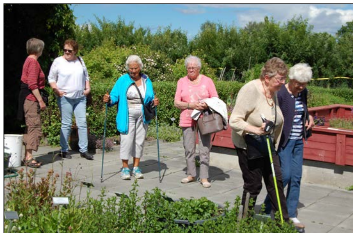
Damene beundrer urtehagen på Domkirkeodden