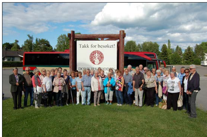
Klare for å reise hjem etter en fin dag på Hedemarken