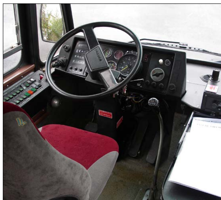
Førermiljøene fra de to bussmodellene.