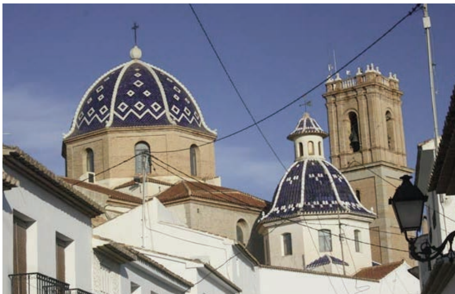
Kirken i Altea, Nuestra Senora de Consuelo. Den sto ferdig rundt 1640, restaurering fra 1901, for en stor del finansiert ved hjelp av gaver. Det fortelles om uenighet og misunnelse mellom de som bidrog. Til høyre for kuppelen ses et kirketårn (blått tak). Det var tegnet inn et tilsvarende tårn på venstre side, men dette var det ikke penger til

kunne etter hvert ta oss inn i et tilsynelatende mørklagt hotell. Innafor dørene ble vi møtt av vennligheten selv, i form av hyggelige resepsjonister som gjorde sitt beste for å uttale våre norske navn, riktignok med en umiskjennelig spansk aksent. De fikk noen leie utfordringer på de ”verste” navna, men klarte å gjøre