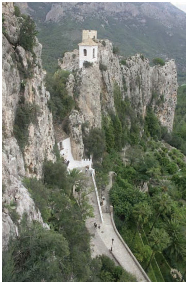
Bildet gir et visst uttrykk av høydeforskjellen mellom borgen på toppen og starten på veien opp

og Alicante skjer med egne fly, i tillegg til at de disponerer enkelte plasser på noen av de ordinære flyrutene.