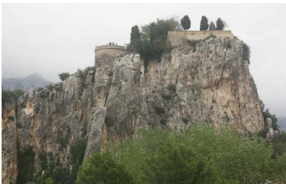
Høyt og uinntakelig ligger borgen på fjellets topp