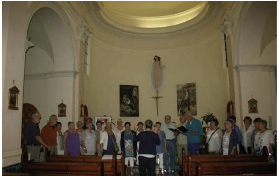
Sterk opplevelse å synge i en kirke med slik «malmfull klang», kirken i fjellandsbyen i Guadalest. Kantoriet sang fire sanger, flere av turistene stoppet i døråpningen for å lytte, og enkelte kom inn og satte seg

Søndagen ble vi hentet av buss kl.09.30 for å bli kjørt til Minnekirken ved Solgården, rundt 2 mil fra hotellet. Vi skulle delta med sang i gudstjenesten der kl.11.00, muligens også synge under kirkekaffen etterpå. Både buss og sjåfør var nye, og på den riktige sida av lovet tidspunkt. På vei til Solgården passerte vi de voldsomme skyskraperne i Benidorm, et helt annet ”landskap” enn det vi hadde vært i lørdag ettermiddag – og skulle til denne lørdagen. Solgården ligger nemlig langt mer landlig til og består i hovedsak av en samling lave hus, enten det er hus som skal huse gjestene, eller det er rom til felles benyttelse. Mange er de som søker et opphold her i løpet av året, en spesiell form for ferie der en får nytte godt av Solgårdens tilbud, enten en kommer som familie, som pensjonist eller har en utviklingshemming det er behov for å tilrettelegge oppholdet for. Stedet tar også imot bestillinger på ordinære turer, og transporten mellom Norge