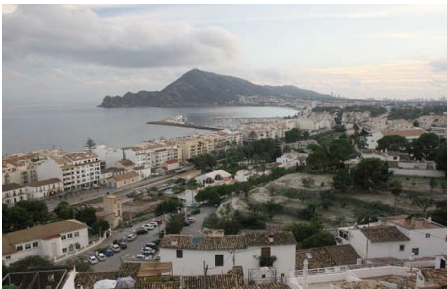
Utsikt fra Altea mot høyblokkene i Benidorm

Mye av borgen er imidlertid borte grunnet et ødeleggende jordskjelv i 1644 og et nytt i 1748. Digre kampesteiner på nordvestsiden av fjellet vitner den dag i dag om ødeleggelsene. Det som gjenstår gjør imidlertid inntrykk! I landsbyens øvre del ligger bl a et miniatyrmuseum hvor alt er i målestokk 1 : 60. Et annet museum framstiller folkets levesett opp gjennom ulike tidsepoker, og byens gamle fengsel er også mulig å besøke. På veggen i et fangehull henger et stort litt mørkt maleri som ser ut til å skulle