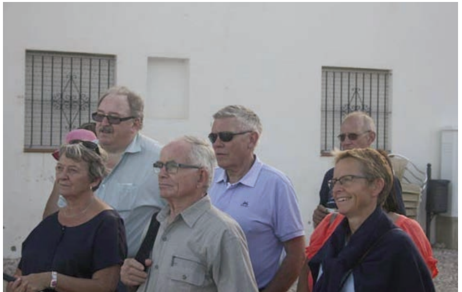
...treffer et lydhørt publikum

Om ettermiddagen var det lagt opp til byvandring i gamle Altea, rundt 4 km fra hotellet. Noen tok seg dit via apostlenes hester mens andre fikk bilskyss eller tok drosje. Veien gikk langs strandpromenaden, flatt og bedagelig i snakketempo og med blick for omgivelsene. Overgangen var stor til stigningen opp mot toppen av Altea, en vandring som var fantastisk både hva gjelder stigning og utseende. Det var bratt, med trange brolagte gater, hvitkalkede (malte?) hus og fargerike blomster! På Kirkeplassen skulle vi møte byvandringen personlig, kjentmann