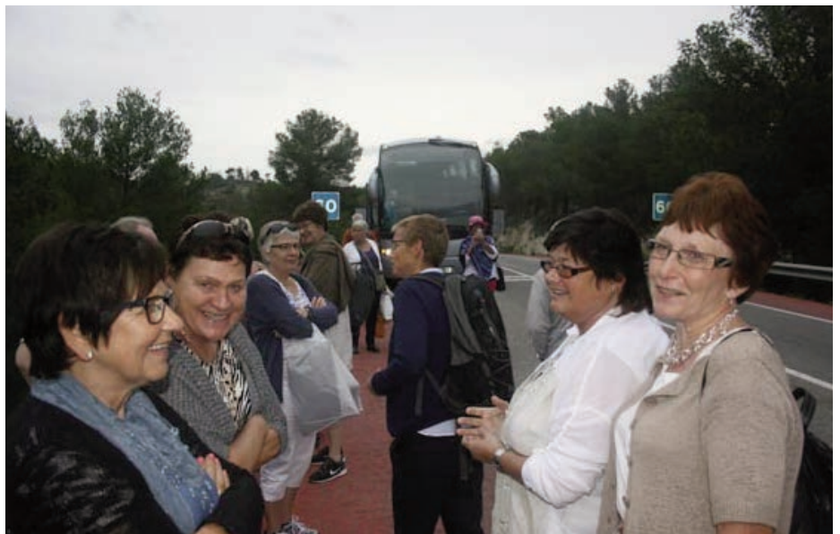
Det ryker kraftig fra bremsene bak og bussen må evakueres før nedkjøringa mot Algir og hotellet starter for alvor. Det skulle ta lang tid før alle kom seg til middagsbordet lørdagskvelden