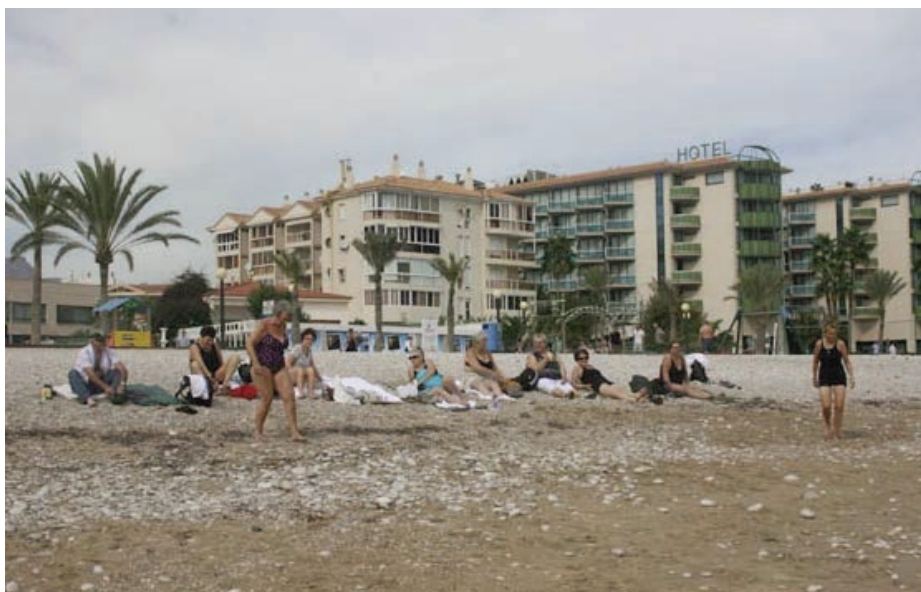
Pikene på stranden (i Albir)

De som har opplevd å miste bagasjen vet hvor kjedelig det er å stå ”i fremmed land” uten tannbørste, uten klesskift og med alt det ”balet” en ser for seg å måtte gjennomgå før tingenes tilstand igjen er i orden. Og, desto verre når slikt skjer på nattes tid! Men, en liten håndfull i reisefølget ”hev seg rundt” – og til sist dukket kofferten opp! Da hadde den spanske bussjåføren stått og trippet ei god stund, utålmodig etter å komme av gårde. Det virket ikke som han hadde mange minuttene å gå på, noe han også ga uttrykk for. En tydelig lettet bussjåfør kunne nå laste inn de siste passasjerene og ”sette klampen i bann” for å ta igjen det forsømte. - Om det var tilsiktet, enten for å