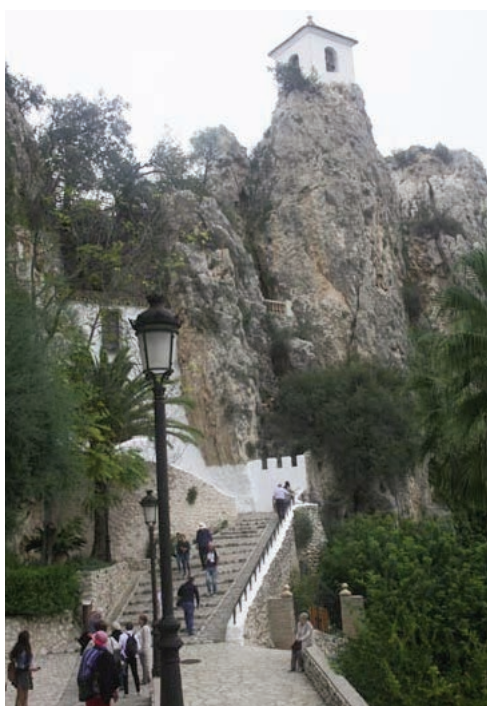
På vei opp til tunellen og inn i den «indre kjerne» av gamle Guadalest