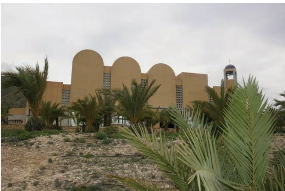
Minnekirken ved Solgården sett fra veien ned mot Solgården. Kirken feiret 40 års jubileum i høst

Det var godt da å bli møtt av Autos tryg-