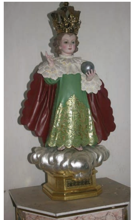
Under borgerkrigen i Altea 1936 – 1939 mellom nasjonalistene og republikanerne ble alle ornamentene og de religiøse figurene i de to kirkene i landsbyen (Altea) og i kapellene ødelagt eller brent. Det eneste som ble reddet ut av flammene var denne figuren av Jesus-barnet, El Niño Jesús de Praga. I tillegg ble deler av en korsfestet Kristus-figur, El Cristo del Segrario, opprinnelig fra Nord-Afrika, reddet, og begge deler gjemt unna til etter at borgerkrigen var over

Det smakte med "norsk" risengrynsgrøt! Til og med rosiner var det for de som ønsket det. Og, det gikk tydelig fram at dette er et tiltak som er populært bland