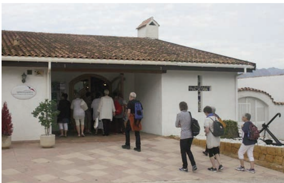
På vei inn i Sjømannskirken i Algir, Kirkesenteret