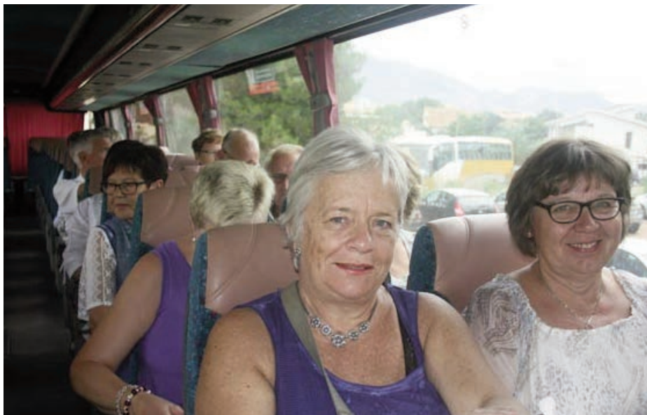
Bussen opp til Guadalest, den samme vi hadde fra flyplassen

Det er stigning et stykke opp fra Guadalest før nedstigningen i retning mot Middelhavet (og Albir) starter. Rett etter toppen begynner de første å merke røyklukt, og like etterpå står mørk røyk opp fra bakhjulene på begge sider. Det er gått varmgang i bremsene! Bussen