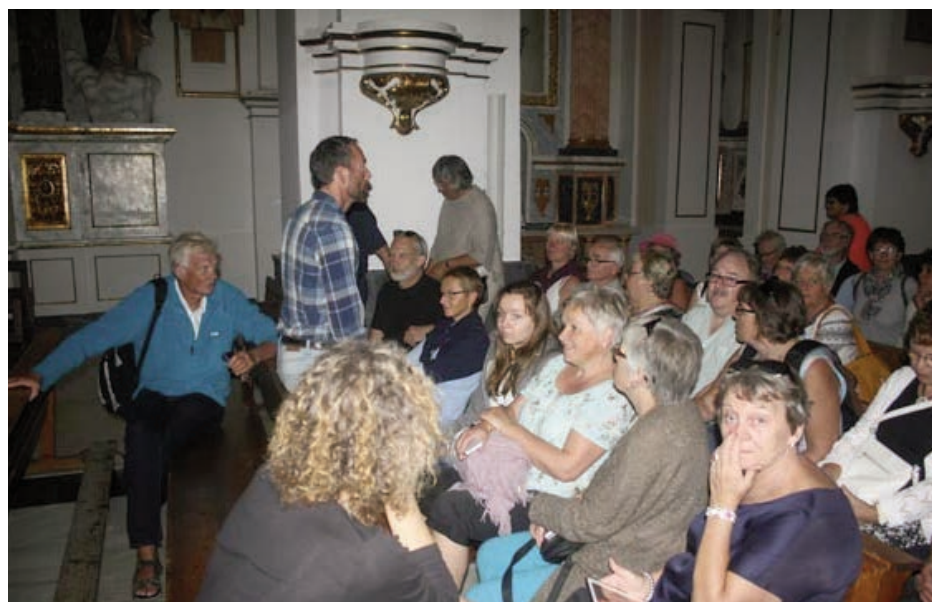
En lydhør forsamling lytter til det Folkestad har å fortelle inne i kirka. En orkan og et lite jordskjelv på 1980-tallet ga behov for ny restaurering. Innvendig ble det da malt et tynt lag med ekte bladgull på alt som glimrer av gull inne i kirken. Jobben tok 6 år og ble utført av en mann på 65 år!