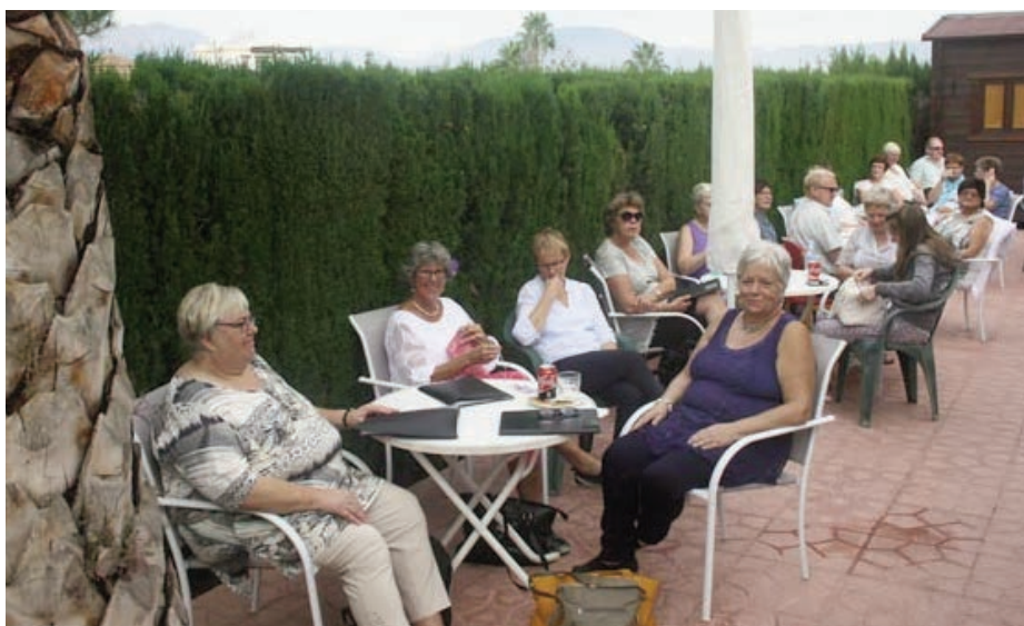
Mye folk på grøffest! Her sitter flere av kantoriets medlemmer langs hekken som omkranser terrassen i Kirkesenteret