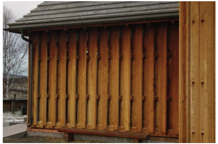
Skråstilt stående panel gir spesielle lyseffekter inne i kirka; lys slipper inn på dagtid, slipper ut når det er mørkt

Petter Dass drev med fiskesalg ved siden av sin prestegjering. Han var teolog og dikter – og sokneprest i Alstadhaug i Nordland. Han er bl a kjent for å ha lagd forklaring til katekismen på vers! Det sies videre om ham at han var i stand til å ”sette djevelen på plass”. Melodien er ved Wolfgang Dachstein, tysk organist og komponist som levde fra 1487 – 1553. Denne melodien er fra 1525. Dachstein studerte for øvrig sammen med Martin Luther!