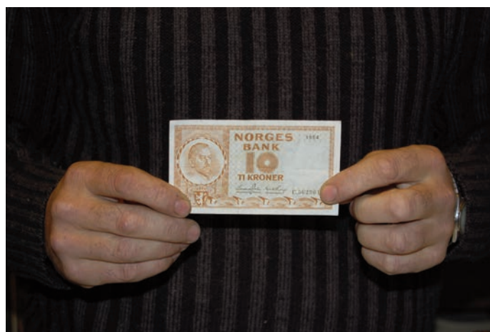
Her viser han fram en gammel 10 kr seddel fra 1954