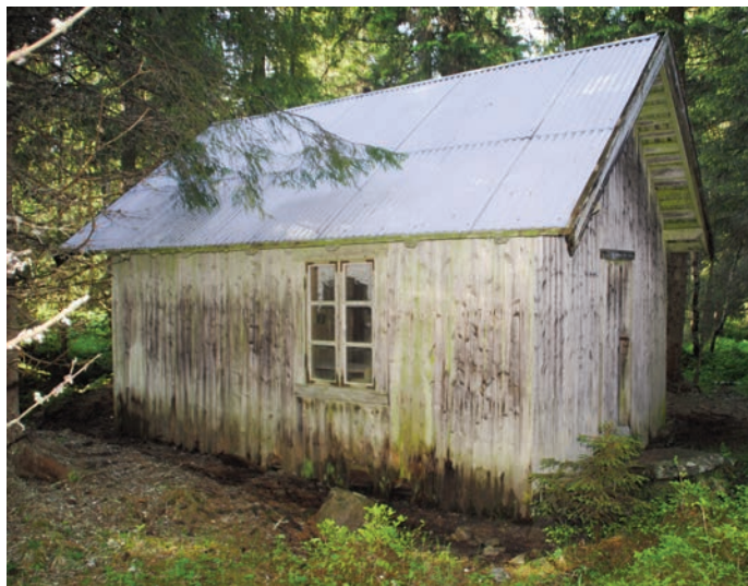
Slåttebua på Hovslette står fortsatt

Nå har de fleste slettene blitt solgt til gardar i Landåsbygda og Fluberg, og bare Ruud, Ringeli og Rønningsveen er Snertingdalsbruk som har sletter i fortsatt eie. På flere av slettene finner vi ennå enkle «slåttebuer», husvær som ble brukt under innhøstingen. Men de fleste slåttene er overgrodd av skog, og bare to-tre kan sies å bli brukt som beite. Resten bruker sau og elg som matfat. Og «mat» finnes det her. Villgraset som vokser over myrene her mangler sidestykke. Det ser ut