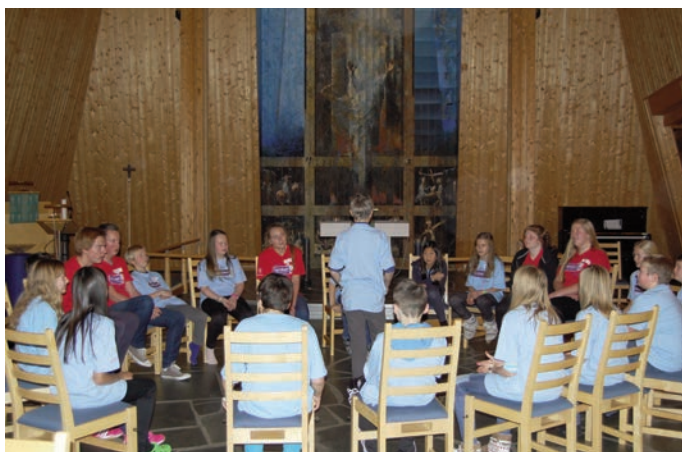
Samling i sentrum