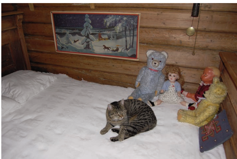
Pus kom inn og tok en hvil i den gamle fine senga