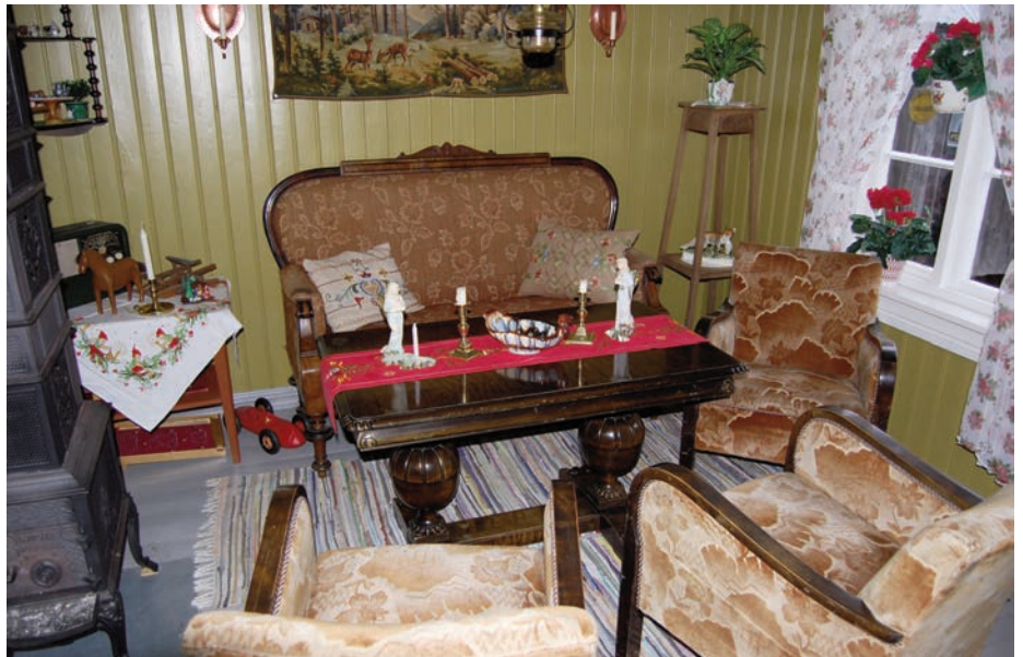
Det meste av stuggua er innredet i 1950 talls stil. Her fra finstuggua