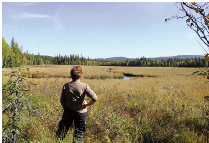
Råumsmyra er fast og fin å gå på

Det kan nevnes at deler av Jotunheimstien går over Evjemyra, og denne stien er et fint turmål i seg selv for dem som er glad i å ferdes i skog og mark. Det kan bare anbefales.