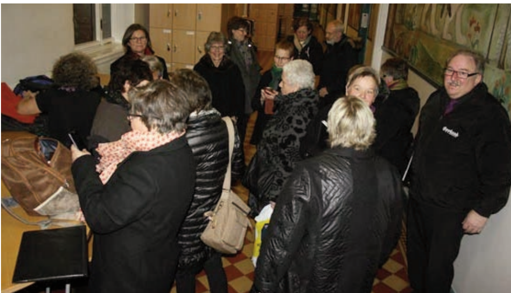
Avlsappet etter vel overstått salmesang

Etter litt snø og fukk over Dovre gikk været etter hvert