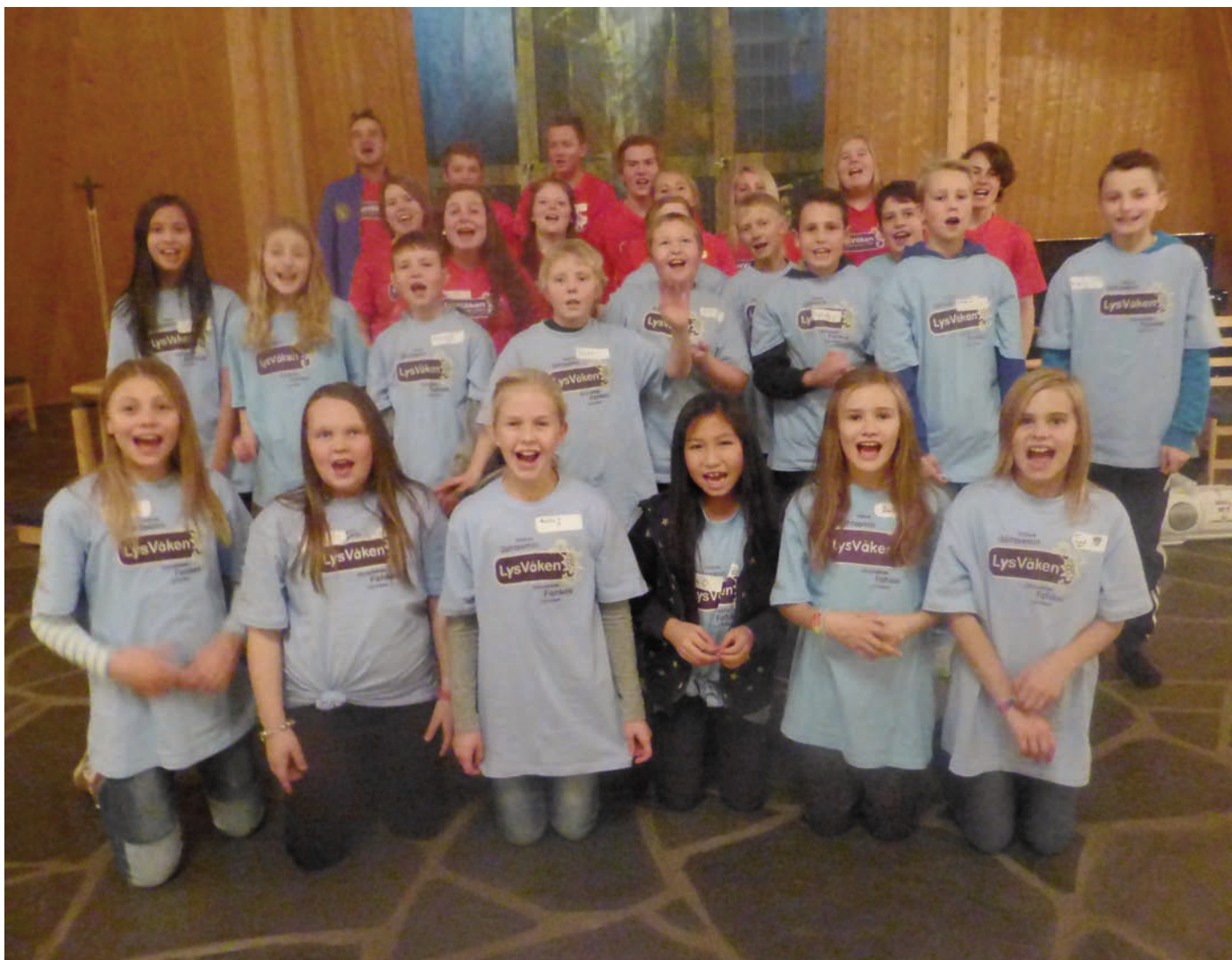
Årets Lys våken deltagere samlet foran alterringen