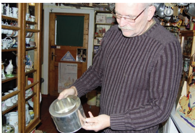
I butikken finnes også blekkdunker for hermetisering av kjøttmat. Et viktig hjelpemiddel før hjemmefryseren kom på markedet