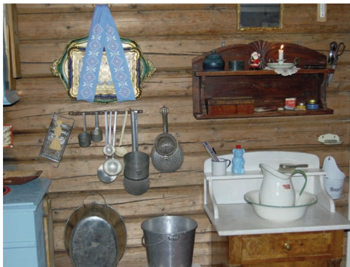
Uten innlagt vatn er det nødvendig med vassbytte, oppvaskbalje, auser, å mugge og vaskefat for personlig hygiene