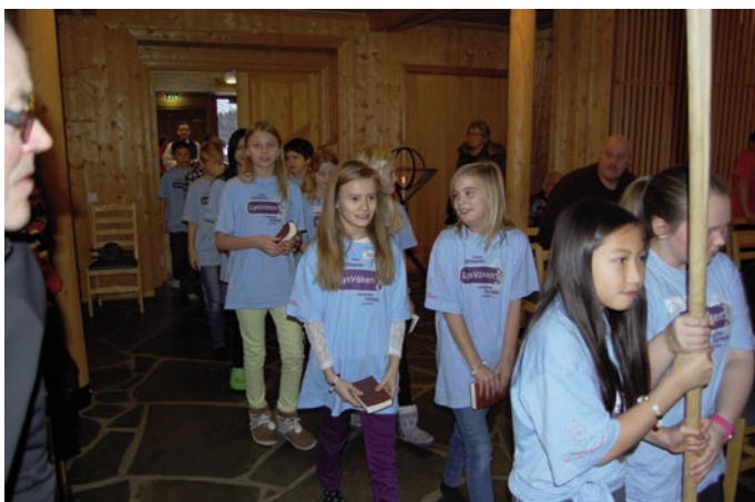
Gudstjenesten søndag begynte med inngangsprosesjon