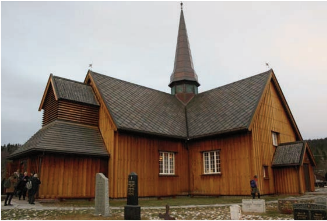
Innset kirke, vigslet i år 2000

Ved ankomst Trondheim ble det litt anledning til å besøke et kjøpesenter før middagen ble inntatt i felleskap på Solsiden. Menyen var pizza og pasta i ulike varianter, samt dessert. Veien til hotell Clarion ble unnagjort per apostlenes hester, og innsjekking kunne skje i åttetida om kvelden. Det var nok flere som så fram til å kunne slenge seg nedpå for litt søvn før nattens salmetokt skulle gjennomføres.