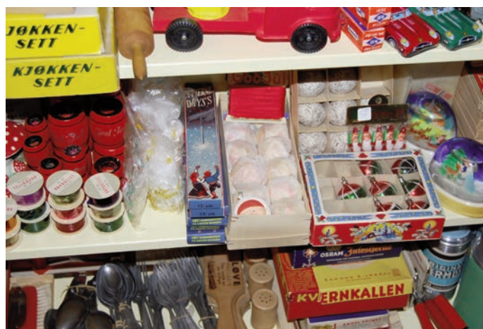
Butikken selger også julepynt anno 1950-60 åra