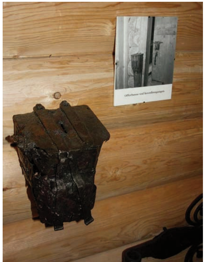
Bevart etter brannen i gamlekirken: kollektbøsse preget av den sterke varmen

To blad Håkon, Bleken og Gullvåg, fikk oppdraget med utsmykninger i den nye kirka. Bestillingen var klar; det skulle males bilder fra bibelhistorien på nærmere angitte steder i kirkerommet. Slik fikk prekestolen og dørene inn til benkene malerier, penselstrøk som lett lar seg gjen-