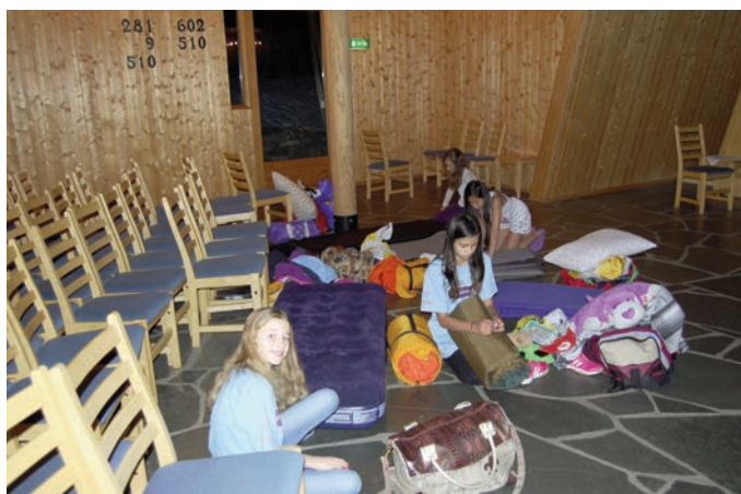
Må vi sove