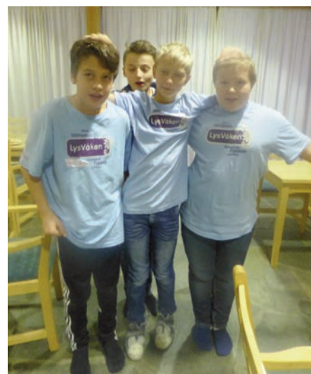
Fire fornøyde deltagere

For noen ble det en lang og spennende natt, med lek og film, men noen fikk også tid til å sove litt. Mat og drikke kom tilsendt fra