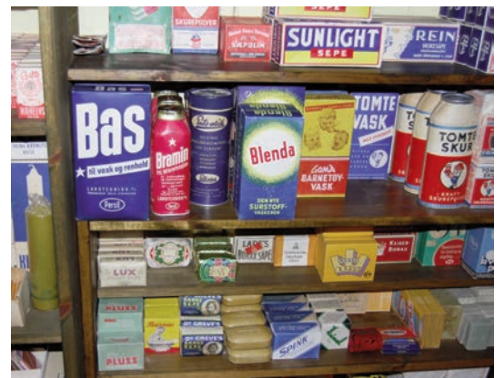
All slags såpe og vaskemidler er viktig. Jeg husker far brukte Bramin og Bas til rengjøring av melkemaskinen