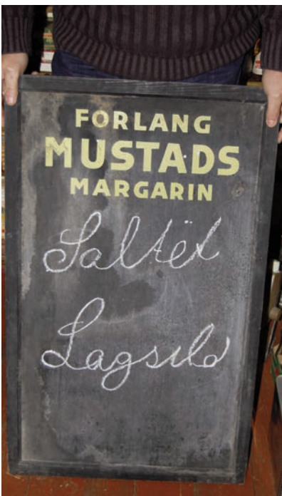
Når salt sild var ankommet var det viktig å opplyse om det