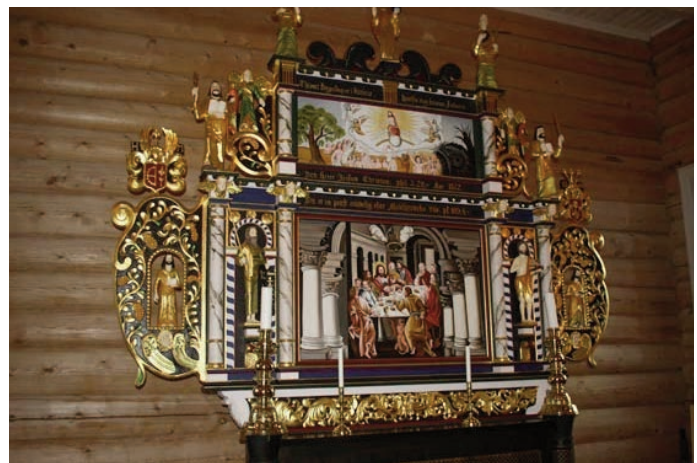
Altartavla er en kopi fra gamlekirken