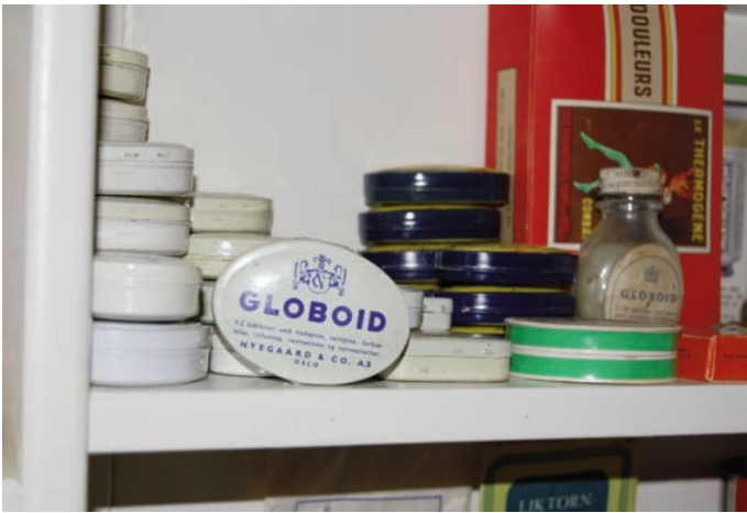
Tidligere var Globoid mye brukt som smertestillende middel