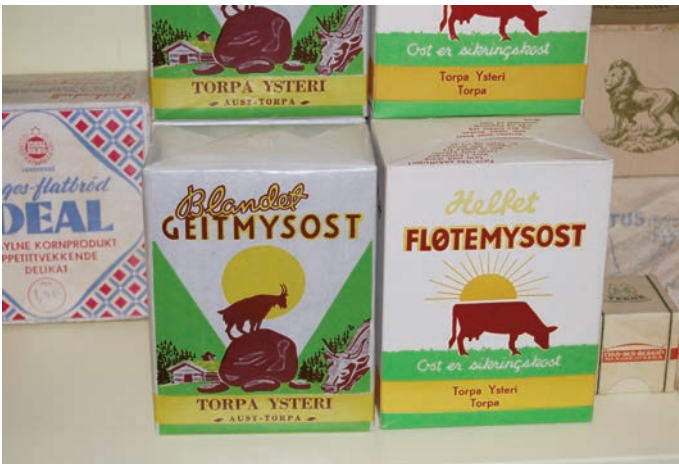
Landhandleriet selger også brunost fra Torpa Ysteri