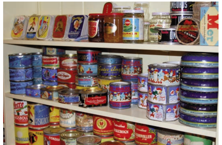
Her er også et rikholdig utvalg av hermetikk