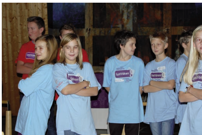
Her framførte de «Lys våken-sangen»