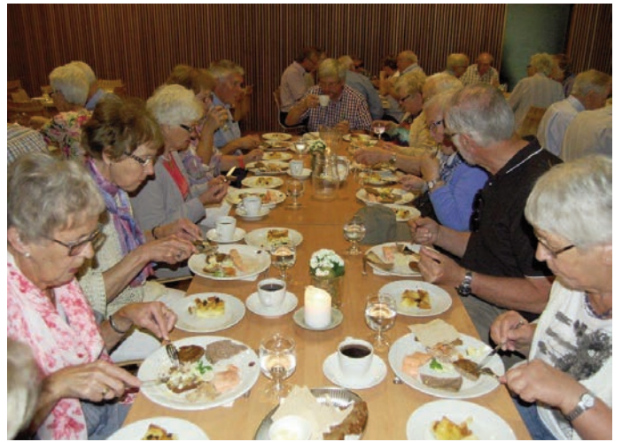
Lunsj med smak fra 1814 smakte godt