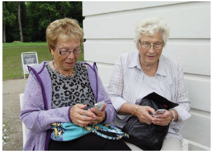
Her sjekker "småjentene" telefonen sin