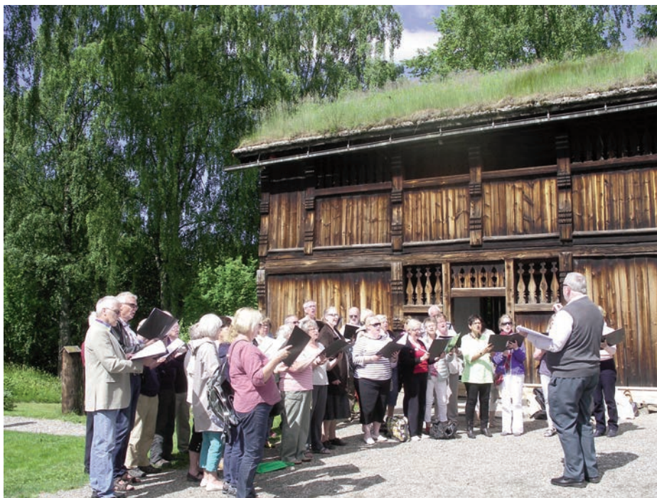
Korsang på Maihaugen

Korene innledet med et par sanger av gjestene og sang deretter to numre sammen. Medbrakt kaffe/ te og biteti ble inntatt i felles pause i det grønne. Deltakerne kunne velge hvilke områder av Maihaugen de ville se, og flere tok turen om husgruppen som viser den bygningshis-