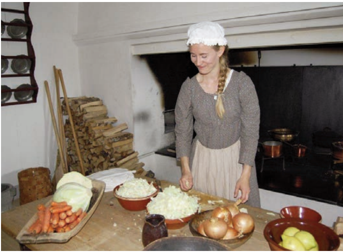
Eidsvollmennene levde stort sett på grønnsaker som ble til- bredt på kjøkkenet i kjelleren under Eidsvollbygningen