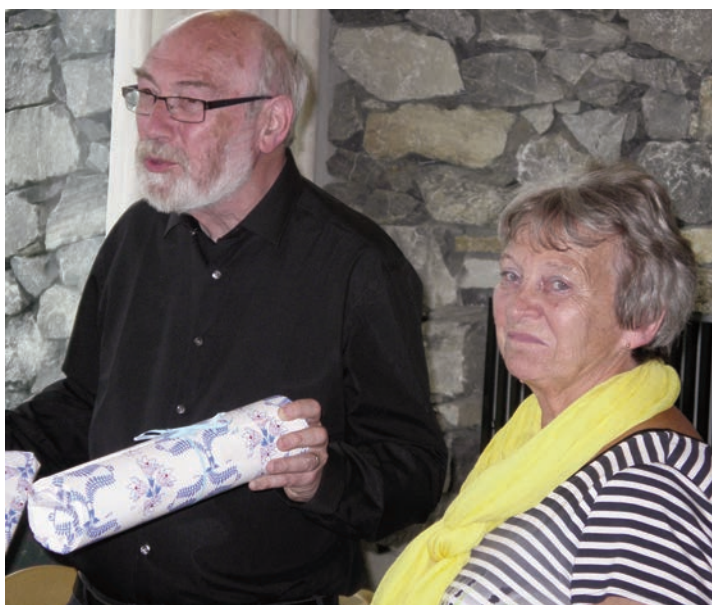
Avskjed med takkens ord

musikkformen kan sies at toccata oppsto i Italia på 1500-tallet. Det dreier seg om komposisjoner spesielt beregnet på klaviatur - instrumenter, hvor "frihet og improvisasjon" er en del av bildet. Ofte etterfølges denne av en fuge (latinsk for flukt), en flerstemmig komposisjonstype etter imitasjonsprinsippet.