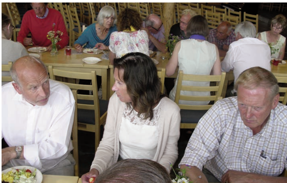
Fra kveldsmaten søndag