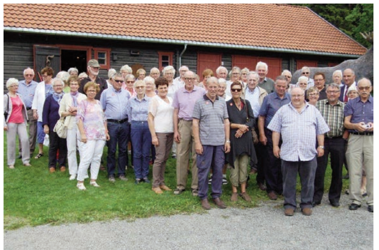
Her er turdeltagerne samlet før bussen vender nesa hjem mot Snertingdal