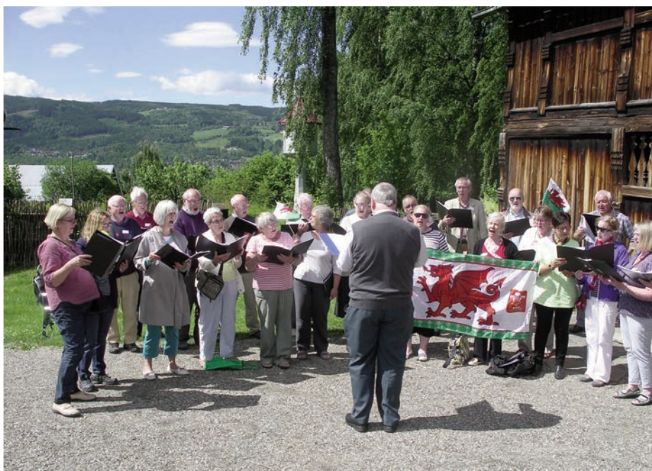
St Donats Atlantic Chorale, med det walisiske flagget

toriske utviklingen i Lillehammer. Under ruslingen gikk det på engelsk og norsk, noen innslag av «eh» - og noen fingerfakter. Det blir gjerne slik når det er lenge mellom hver gang man snakker engelsk. Men, som waliserne sa, de norske korsangerne