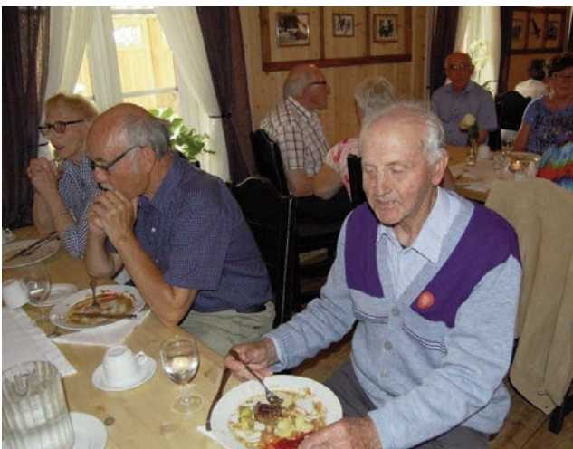
Dagen ble avsluttet med god middag på Torsetra