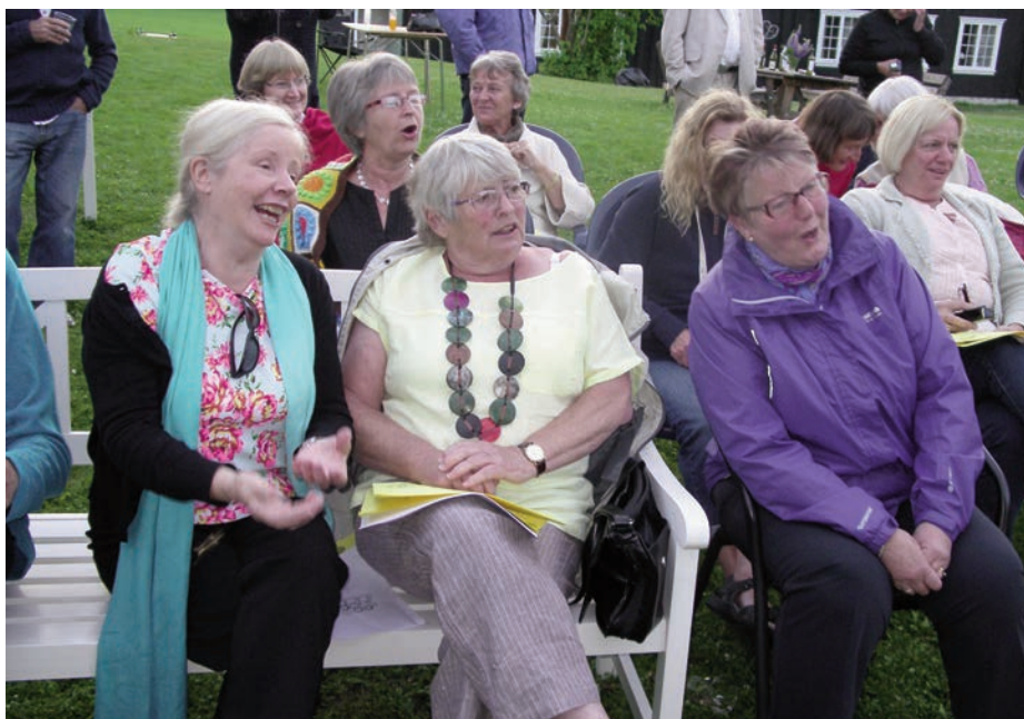
Glad allsang lørdagskvelden