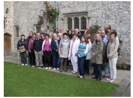
Vi venter på å få innta vår frokost i slottets spisesal lørdag morgen