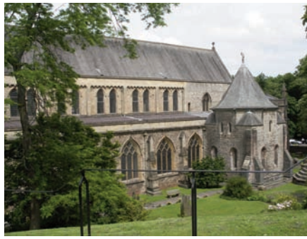
En del av Llandaff Cathedral i den walisiske hovedstaden Cardiff

Vi kom til katedralen rett før en spesiell seremoni som egentlig var "privat". Men, vi fikk da komme inn, og ble vitne til en høytidelig og verdig seremoni som æret velfortjent innsats over lengre tid i en spesiell orden: The Order of St. John of Jerusalem. Ordenen ble grunnlagt så langt tilbake som rundt 1080 for å pleie kristne korsfarere. Da etablerte munkene fra et nærliggende benediktinerkloster et hospits for dette formål i Jerusalem. Etter hvert vokste dette til et hospital, og religiøs tilknytning kom seinere til. Ordenen ble seinere fordrevet fra Jerusalem, etablerte hovedsete i Palestina, for så å flytte videre til bl.a Kypros. Ordenen vokste raskt og ble etter hvert tilbudt land i Vest-Europa,