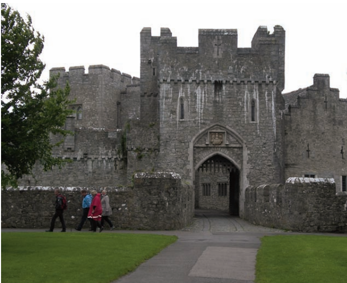
Inngangspartiet på St Donats Castle. Kordeltakere fra Biri på vei til hagene som pryder omgivelsene.

Lørdag ble det arrangert utflukt til Cardiff, Wales’ hovedstad. Samme selskap og sjåfør som hentet oss på Gatwick flyplass stilte opp. Vi avla den norske sjømannskirken der et besøk. Kirken ligger i havnen i Cardiff Bay, et område med estetiske bygg, både i ny og eldre utgave. Bl.a. nydelig bruk av skifer. En av disse bygningene er det walisiske årtusensenteret, Wales Millennium Centre, et bygg som huser både fotballstadion og ulike kulturelle arrangementer. Det var lite norsktalende å møte i