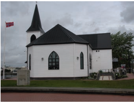
Den norske sjømannskirken ved Cardiff Bay i den walisiske hovedstaden Cardiff