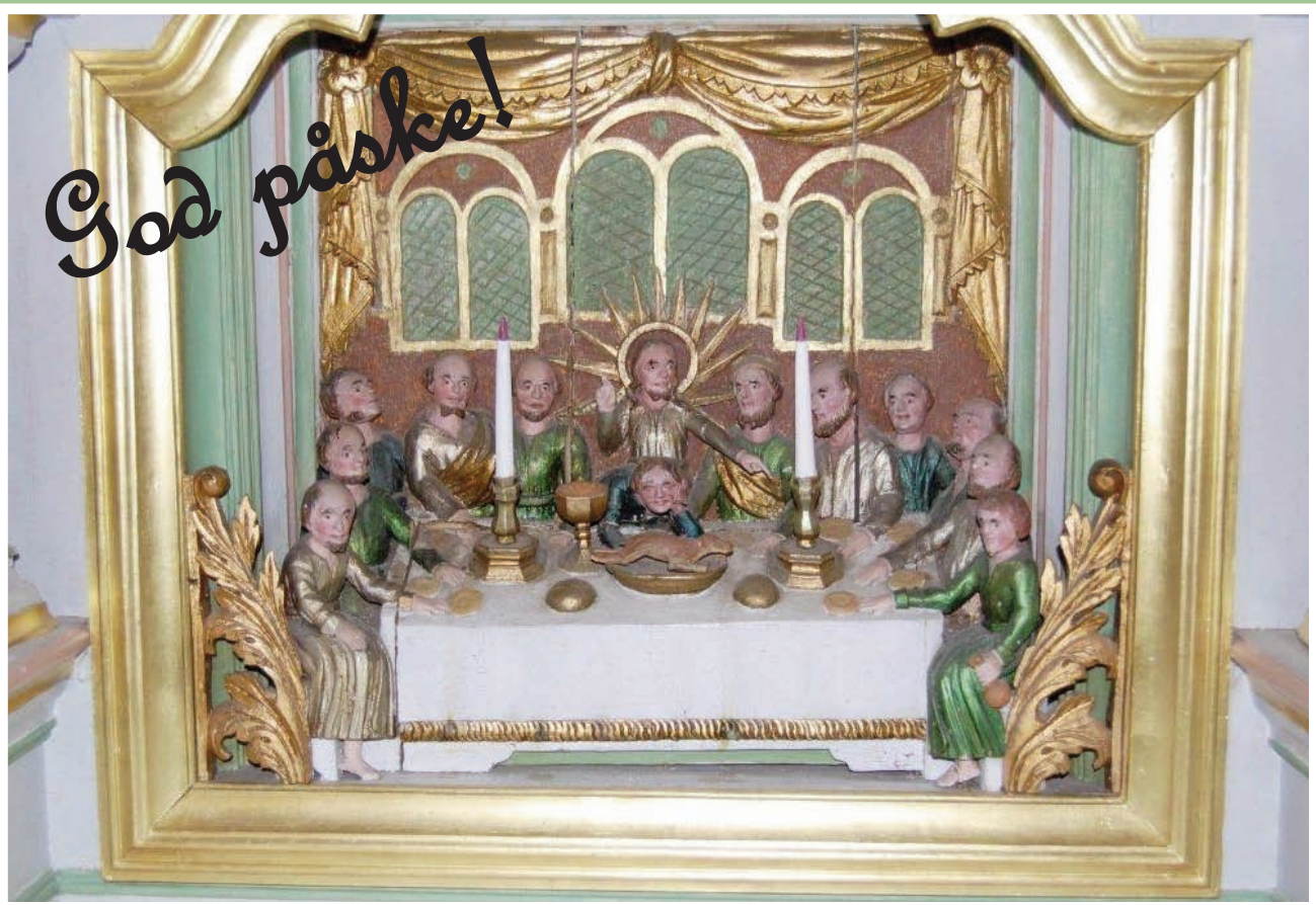
Fra altertavla i Nykirke. Jesus innstifter nattverden. Altertavla som er datert i år 1800 sto også i Gavekirken på Kirkerud før den ble flyttet til Nykirke i 1872.