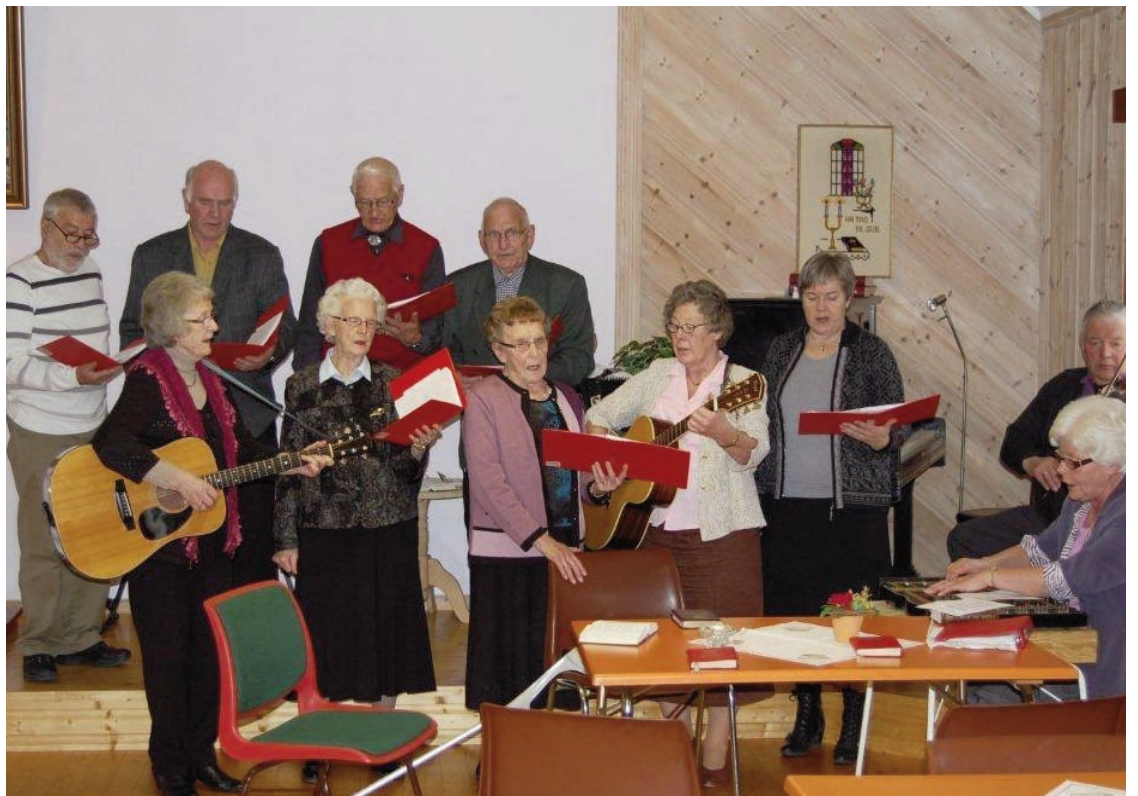
Sangvennene deltok med fin sang på denne første samlingen på Betel.