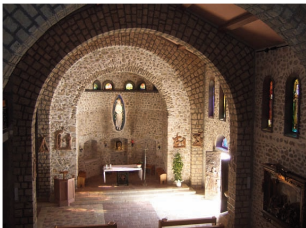
Interiør fra klosterkirken i Greccio