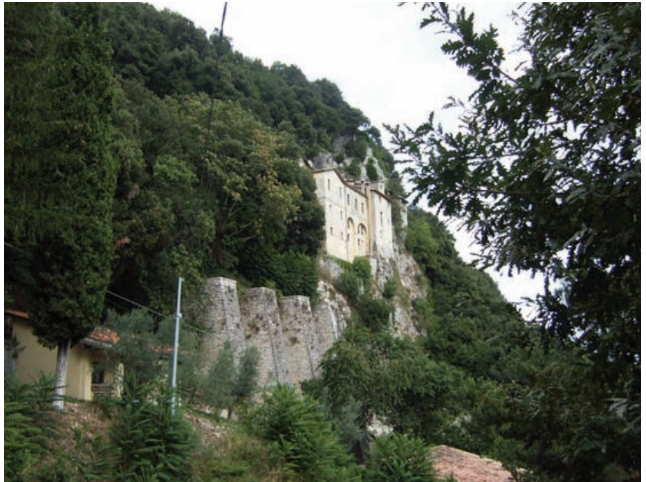
Klosteret i fjellsiden over Greccio

Nå hadde vinterkulden kommet til Greccio. Landsbyen klynget seg til fjellsiden, som om den krøp inn-