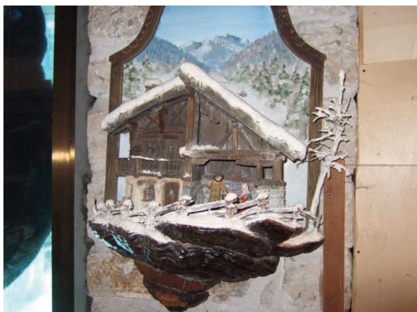
Nok et julekrybbe-kunstverk fra utstillingen