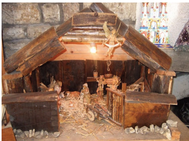
En av julekrybbene i klosterkirken