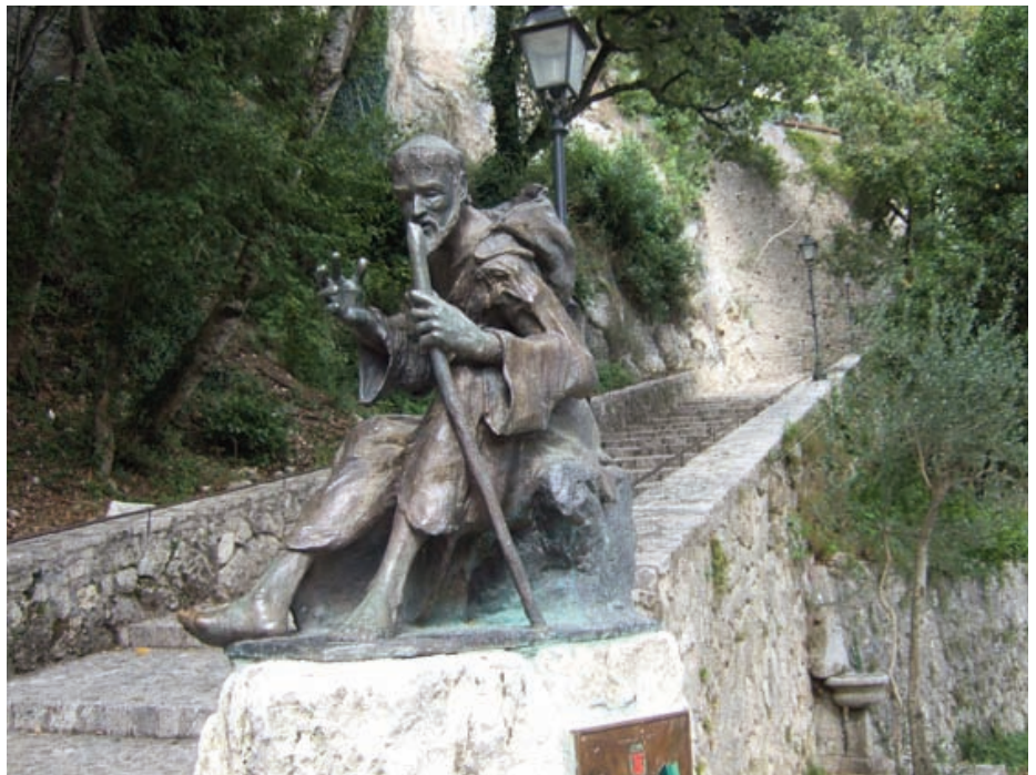
En skulptur av Frans av Assisi langs veien opp til klosteret

under en beskyttende skulder for å holde varmen. Da brødrene nærmet seg de første husene, så de en eldre mann i ferd med å rengjøre en stall med noen husdyr. De stanset og hilste. Mannen så opp, myste ut i mørket og smilte tilbake. – Fred være