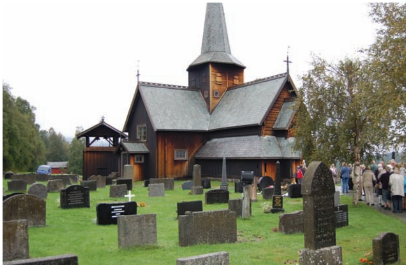
Hedalen Stavkirke var hovedattraksjonen ved menighetsturen