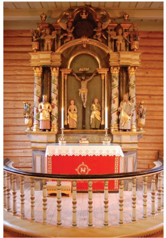
I Bruflat Kirke ble vi godt tatt i mot av sokneprest Marit Slettum