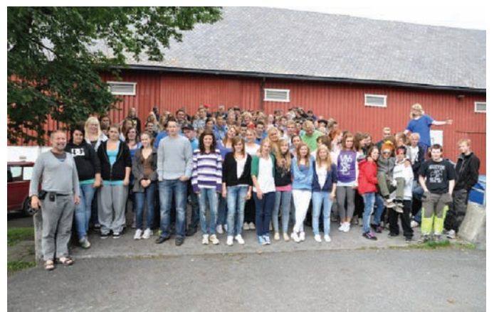
Alle elevene ved Valle videregående skole 27.08.10 (arkivfoto)