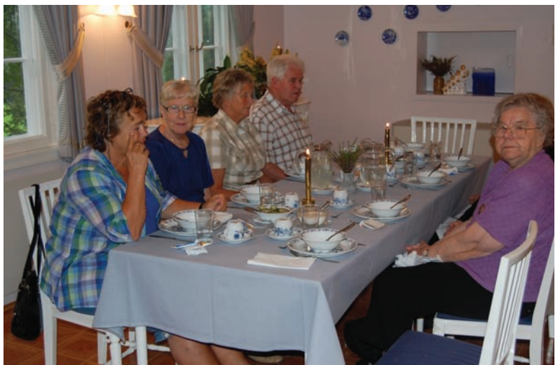
I lyse trivelige lokaler på Ildjarntunet smakte middagen godt