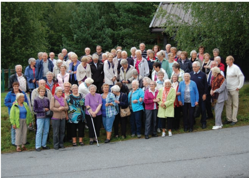
Alle turdeltakerne samlet før siste etappe av turen gjennom Bjonerøa og Fluberg