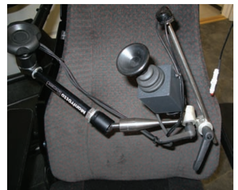
Det er mulig å få elektriske rullestoler med ulike styremekanismer: styring med hake, med nakke og ved hjelp av munnen (suge/ puste ut og inn) ble vist. Denne innretningen er laget for styring ved hjelp av haken.