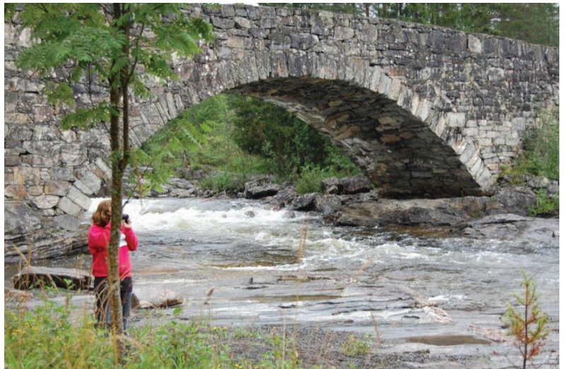
Første stopp var ved gamle Lunde bru i Etnedal