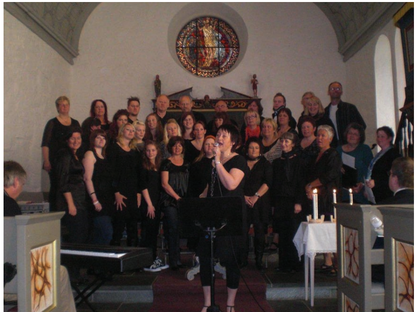
Snertingdal Gospelkor og noen fra Ørlandet Gospelkor synger