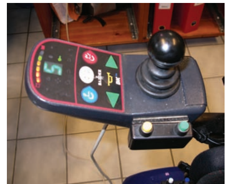
Dette er hjernen til en elektrisk rullestol! Til forskjell fra den menneskelige lar den seg programmere