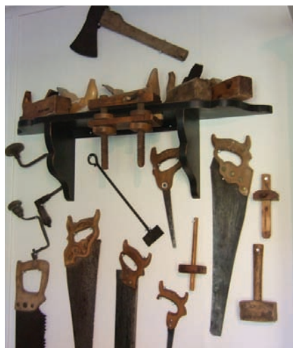
Gamle håndverksredskap viser tradisjon.

Det er gamle håndverkstradisjoner som føres videre. Det meste lages for hånd. Materialet som brukes er furu. Malingsteknikkene som brukes på møblene, blir gjort for hånd. Aldringsmaling er med på å gi møblene en egen