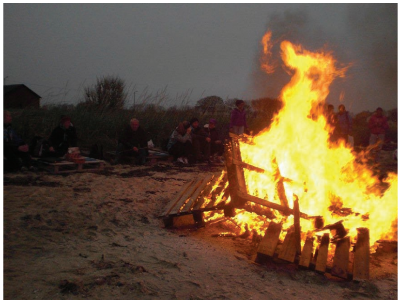
Pinsebål ved sjøen