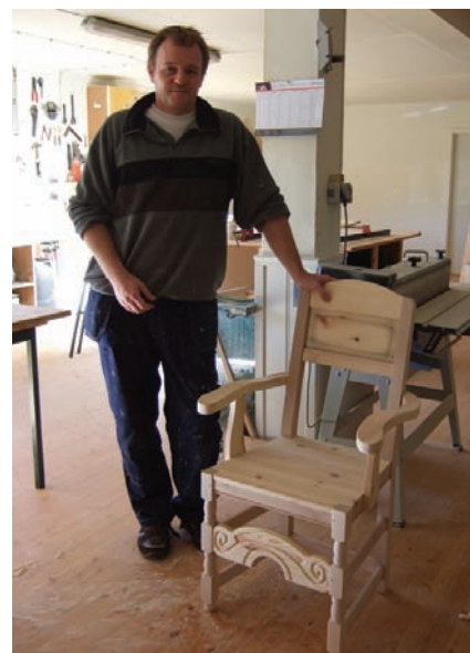
Totenstol - gevinst på årets menighetsbasar.