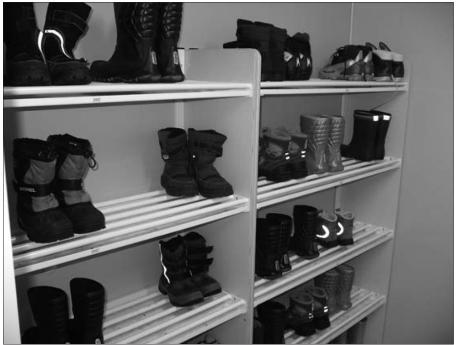
Hele 81 barn har plass i barnehagen! Da er det behov for et visst system for sko, klær og andre eiendeler...

Åpne og lyse løsninger med flyttbare hyller på hjul gjør det mulig å dele inn barnehagen etter forskjellige typer aktiviteter. Ett sted er det mulig å klippe, lime, male – et annet sted "huser" bevegelse, trim, dans – og på kjøkkenet er det bygd platting rundt en kjøkkenbenk slik at alle kan være små kokker og delta på baking og matlaging. Et eventyr - rom finner vi også, og barnehagen har boktralle. Inndelingen av lokalene gjør også sitt til at lyden oppleves bedre. Det er jo lett å glemme iblant at man er inne og ikke skal bruke utestemme... Denne uka står forberedelser til den offisielle åpningen torsdag 14. februar på programmet. Da kommer foreldre, søsken og spesielt inviterte. Det er skrevet egen sang som skal framføres – og rekvisita til opptreden skal lages.