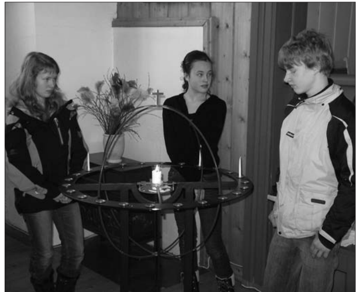
Tre av konfirmantene sto for lystenningen