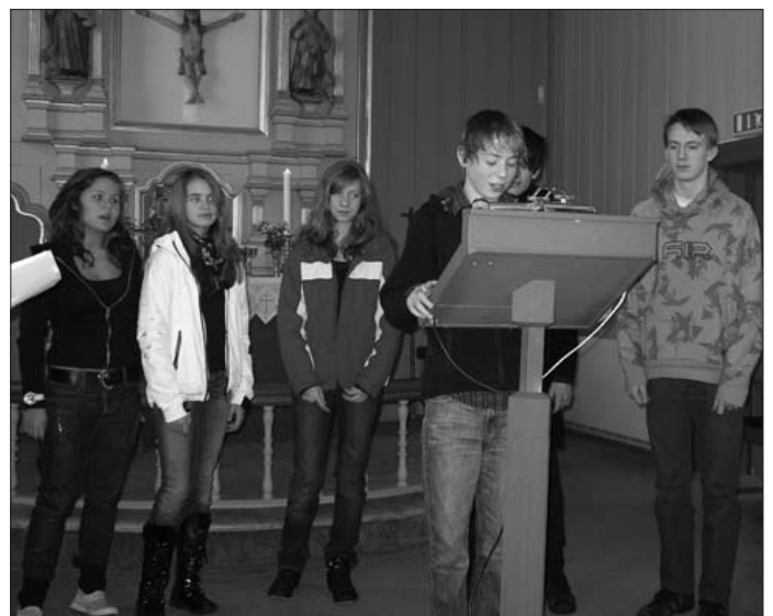
...og her er det ? som gir sitt bidrag