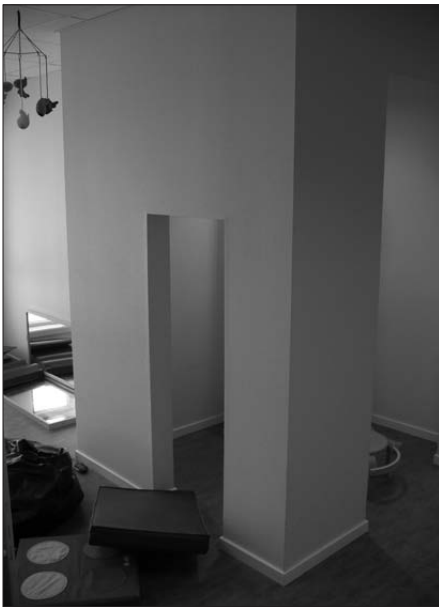
Barnehagen er bygget for barn – her et "rom – i - rommet"