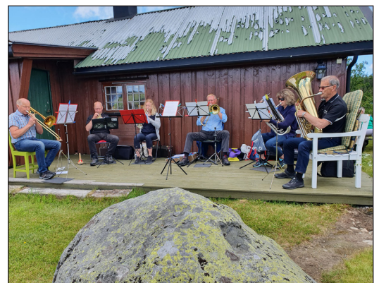
Tradisjon tro deltok musikere fra Snertingdal Musikkforening i gudstjenesten