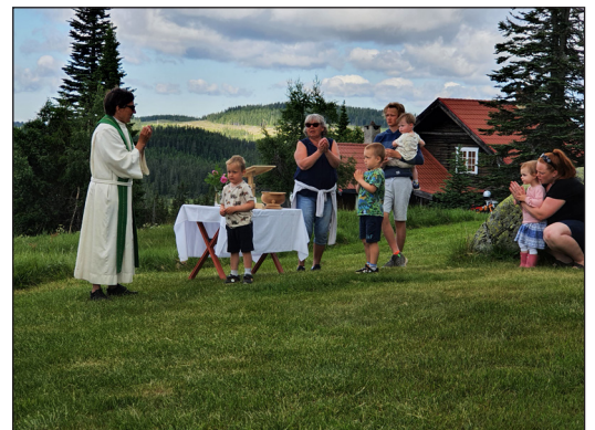
Barna deltok i sangen: Hvem har skalp alle.....?