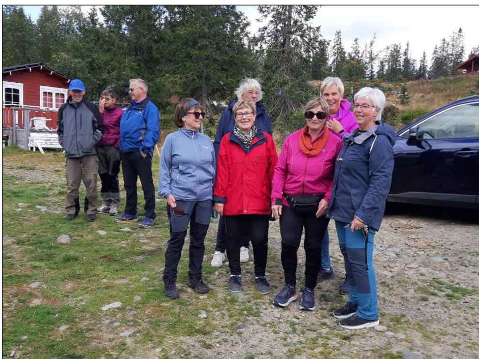
Gjengen klar for tur i flott høstvær.