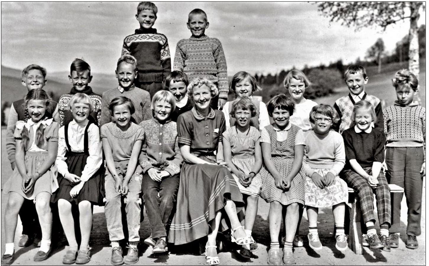
3. klasse Dalheim skole 1958 - 1959