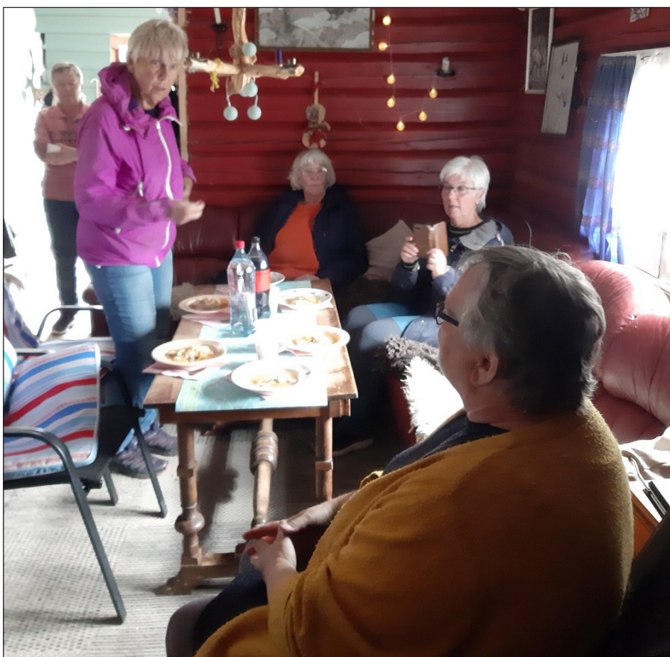
Tørke og sterk vind gjorde at bålpanna vår ble utelatt denne dagen, og serveringa ble innendørs på Kvatumhytta på Onsrudvatna.