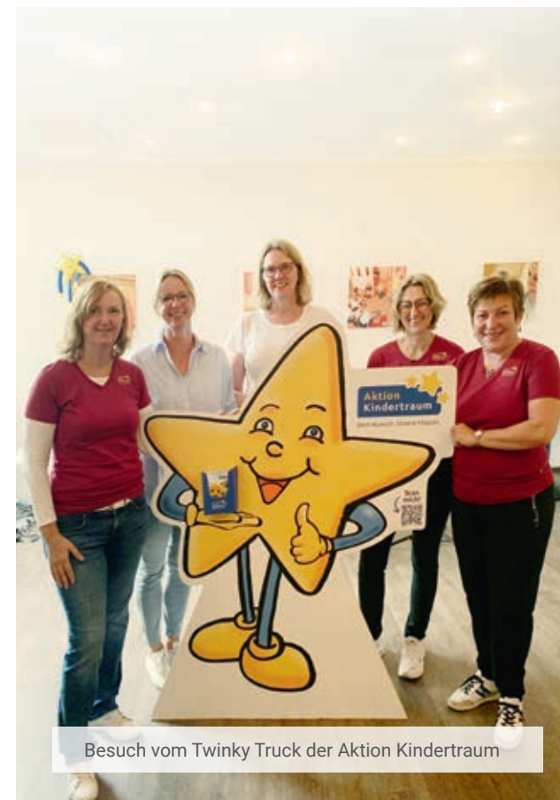
Besuch vom Twinky Truck der Aktion Kindertraum

Der Twinky Truck der Aktion Kindertraum besuchte uns im Rahmen ihrer 25-jährigen Jubiläumstour auf dem Klinikgelände. Die Organisation erfüllt die Wünsche kranker oder traumatisierter