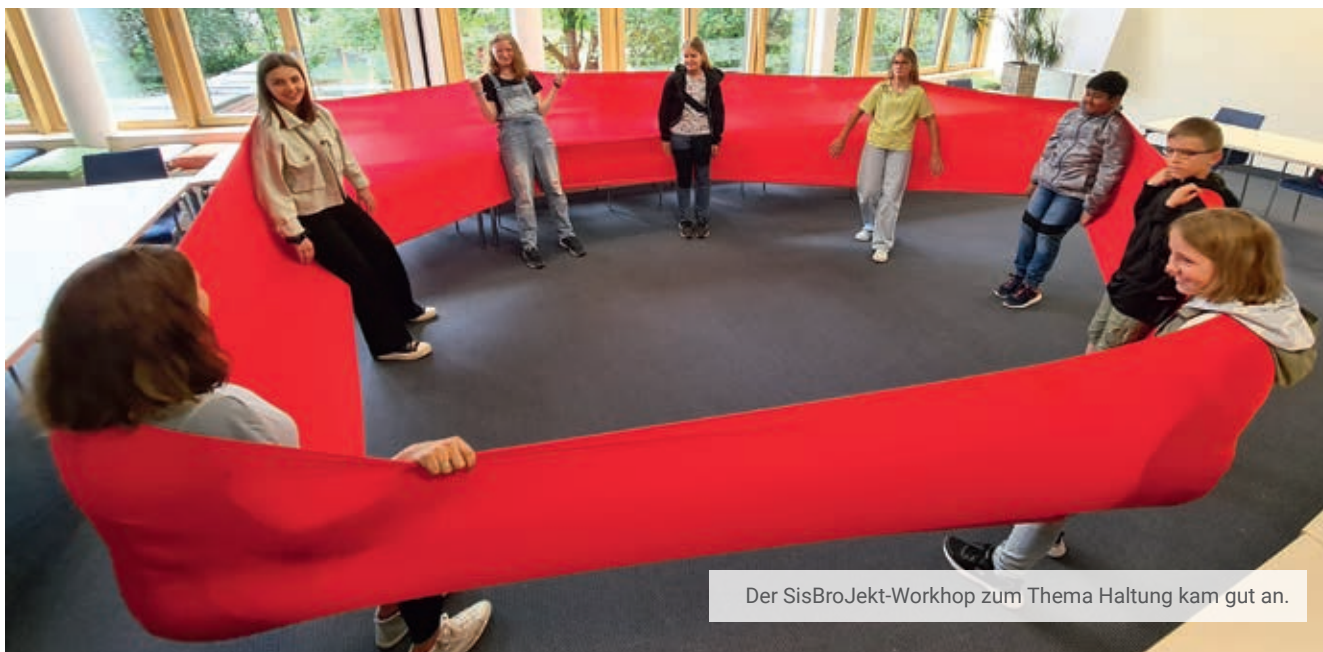
Der SisBrojekt-Workshop zum Thema Haltung kam gut an.

Nach dem Workshop erzählten vier Geschwisterkinder im Interview, welche Haltung ihre Mitmenschen ihnen und ihren schwerstkranken Geschwistern gegenüber haben sollten. Sie beziehen klar Stellung – und sie beweisen eine klare Haltung. Sehr beeindruckend! Dieses Video-Interview finden Sie ebenfalls unter www.kinderpalliativzentrum.de/halt-und-haltung .