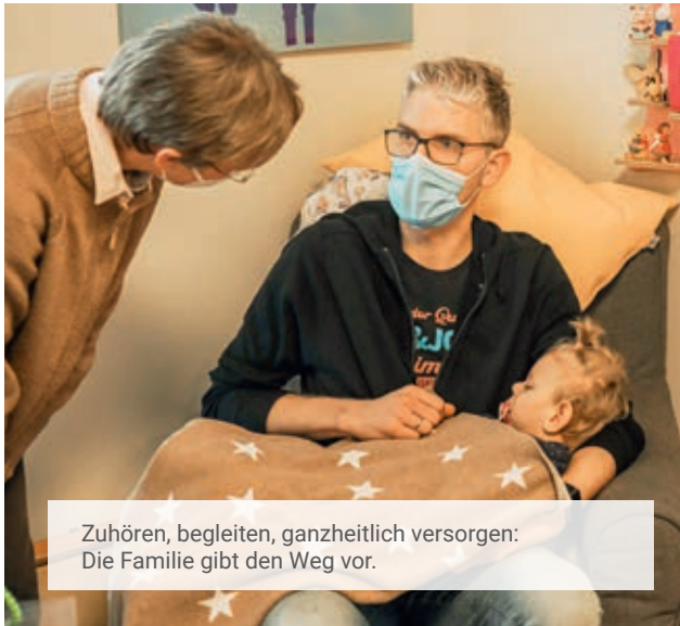
Zuhören, begleiten, ganzheitlich versorgen: Die Familie gibt den Weg vor.