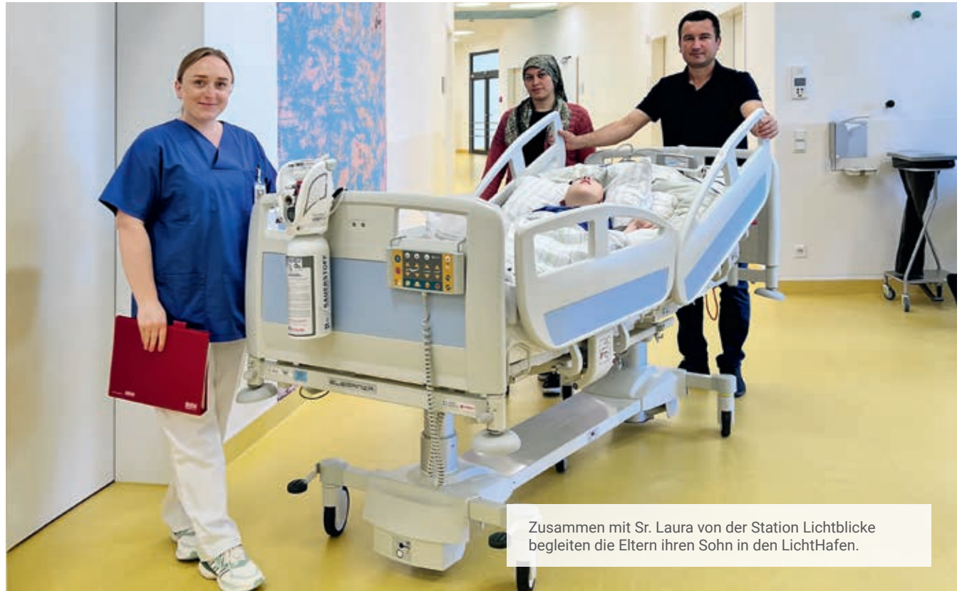
Zusammen mit Sr. Laura von der Station Lichtblicke begleiten die Eltern ihren Sohn in den LichtHafen.

8 Einzelzimmer, barrierefreier Zugang zum (Sinnes-)Garten, Snoezelraum (Sinnes- und Entspannungsraum), Aquarium, Lebensraum mit Küche und Zugang zur Terrasse, kleine Elternküche, 7 Elternzimmer, Gästehaus