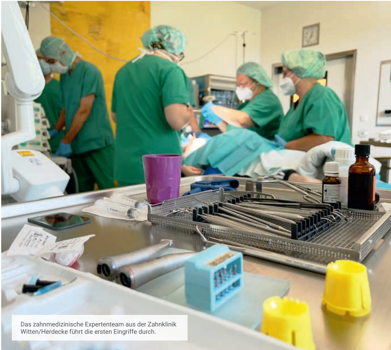
Das zahnmedizinische Expertenteam aus der Zahnklinik Witten/Herdecke führt die ersten Eingriffe durch.