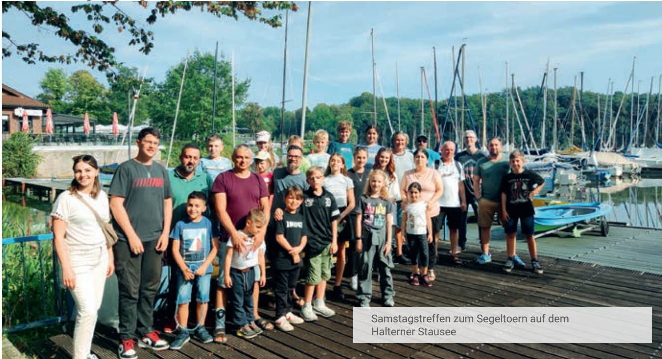
Samstagstreffen zum Segeltoern auf dem Halterner Stausee