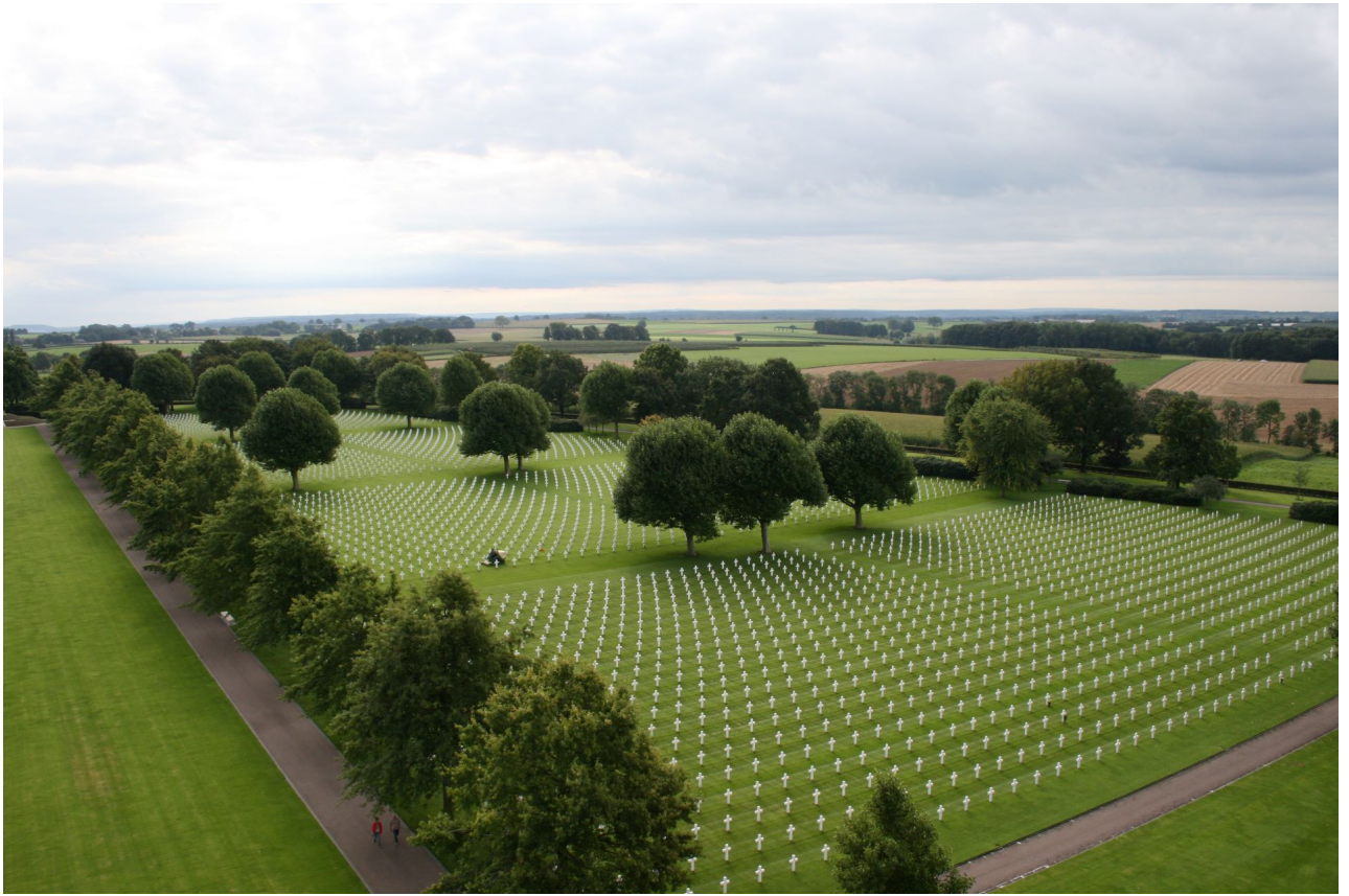
Amerikaans grondgebied in Margraten