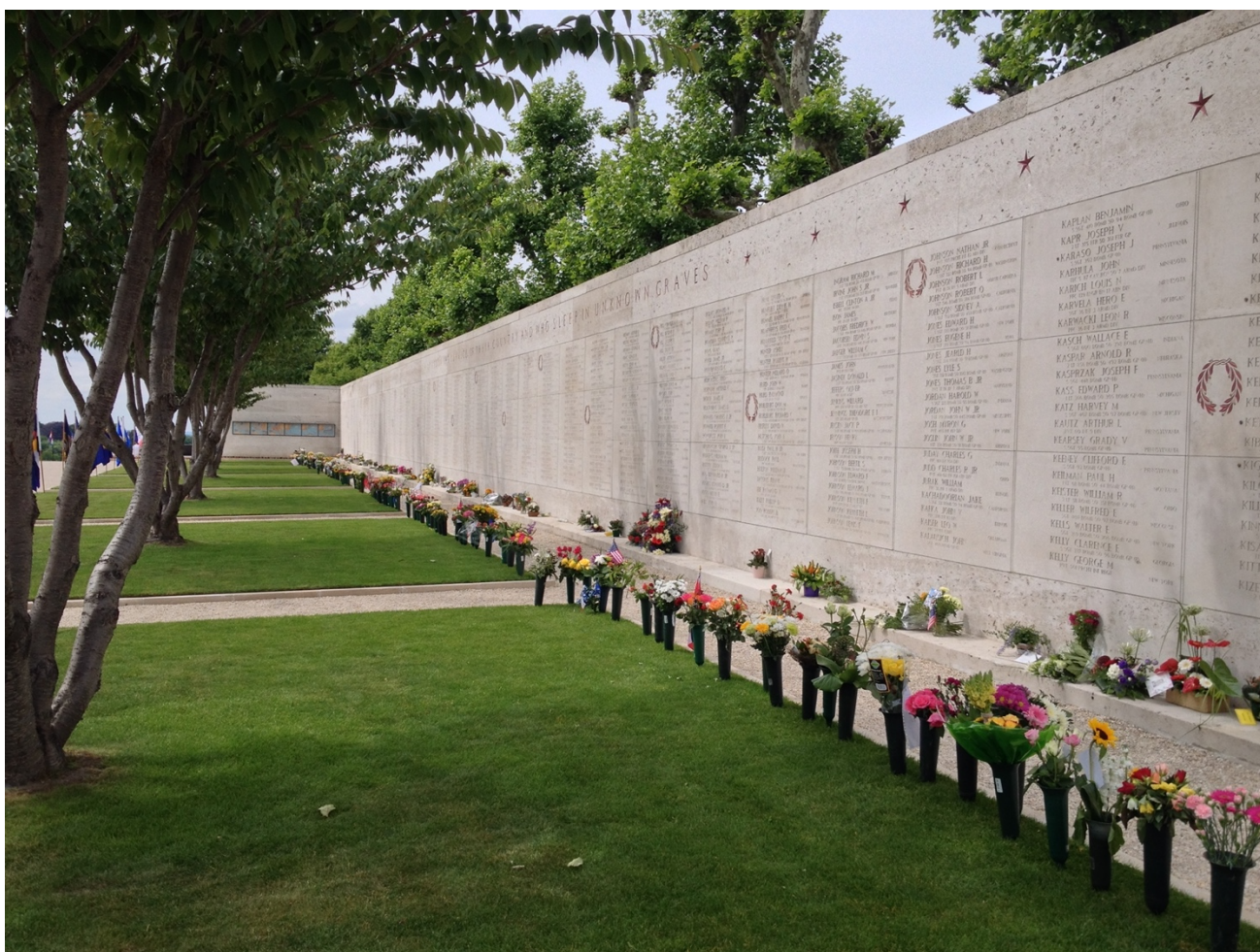
De muren der Vermisten met 1722 namen

https://www.honorstates.org/index.php?id=332126