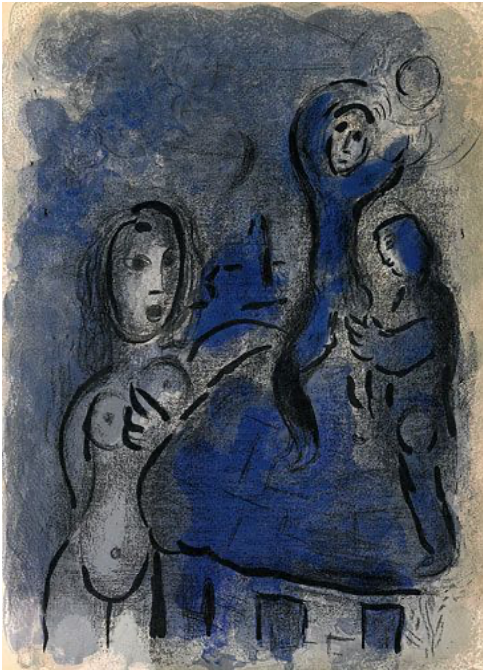
Chagall Rachab en de spionnen

De Dag van de Mensenrechten =10 december