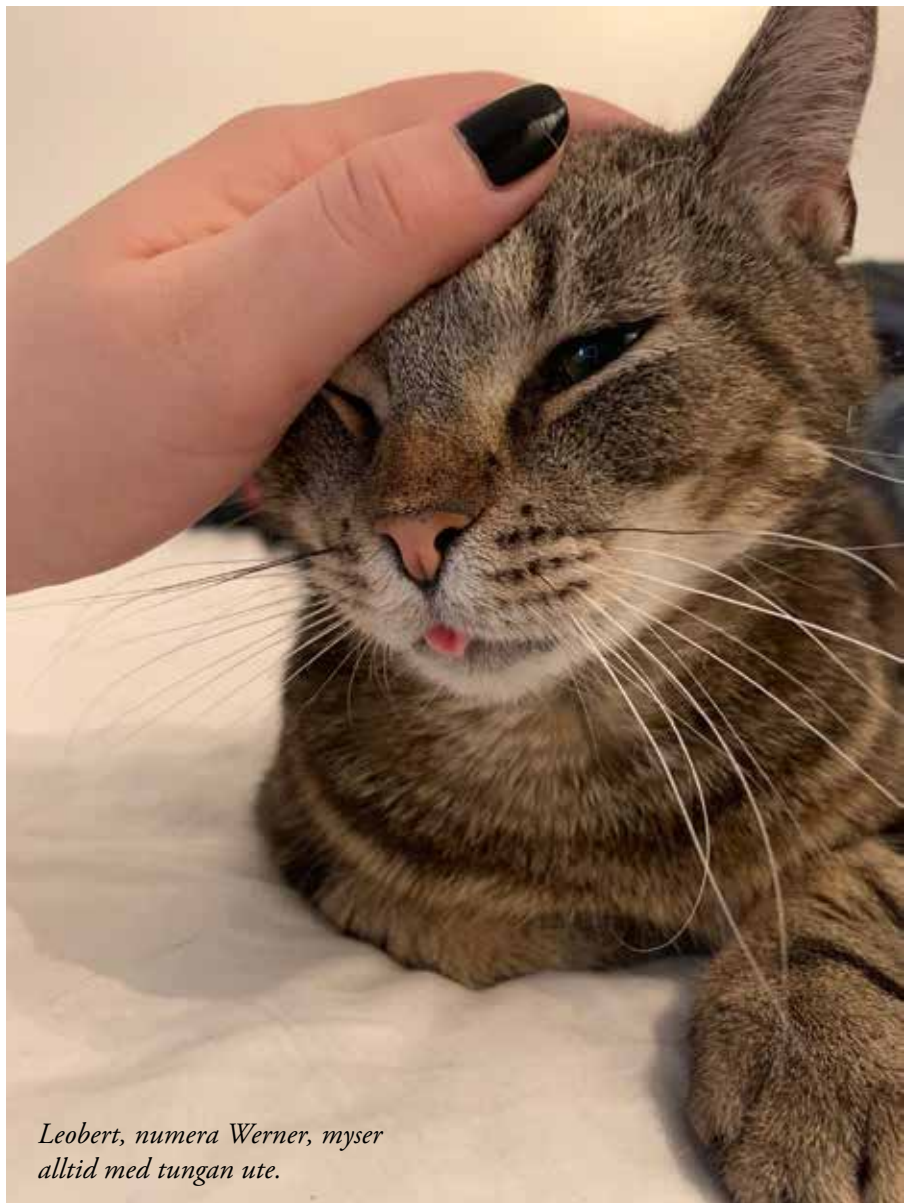
Leobert, numera Werner, myser alltid med tungan ute.