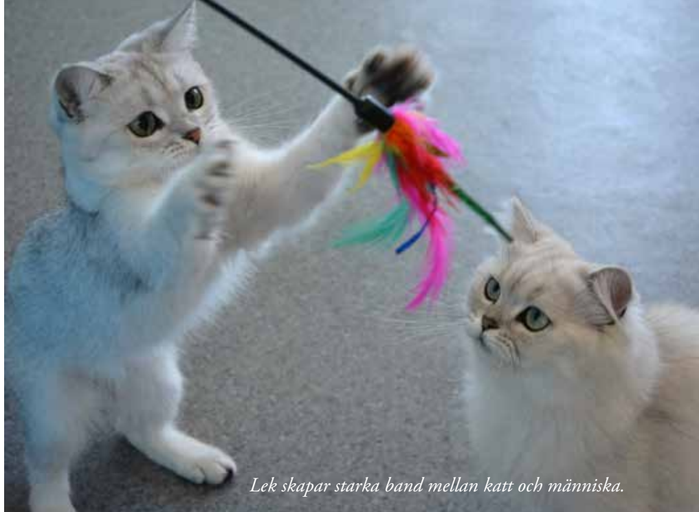
Lek skapar starka band mellan katt och människa.