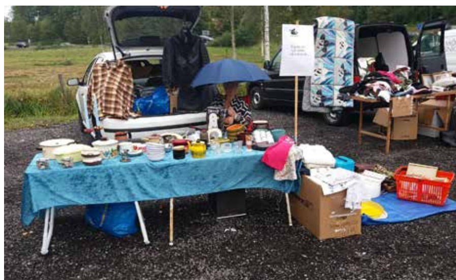
Ute eller inne, i regn eller solsken, på Kattstallet eller en bakluckeloppis. Loppisgruppen är alltid redo för kattarnas skull.

Många som handlar på loppisen bär också med sig gåvor att lämna in. Det är alltid lika uppskattat. Det har även hänt att människor testamenterat hela sin kvarlåtenskap till Kattstallet. Det kan röra sig om både pengar och ett helt hem fyllt med prylar. Då gäller det för loppisgruppens volontärer att kavla upp ärmarna och sortera ut godbitarna. Smycken, kristallkronor och andra dyrgripar ger rejält klirr i