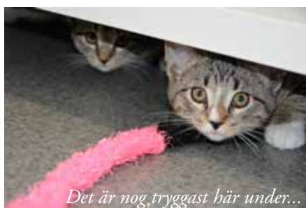
Det är nog tryggast här under...