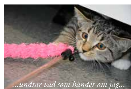
...undrar vad som händer om jag...