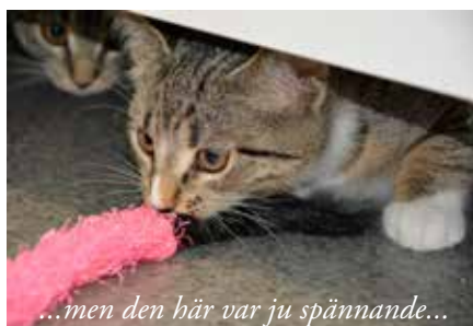
...men den här var ju spännande...