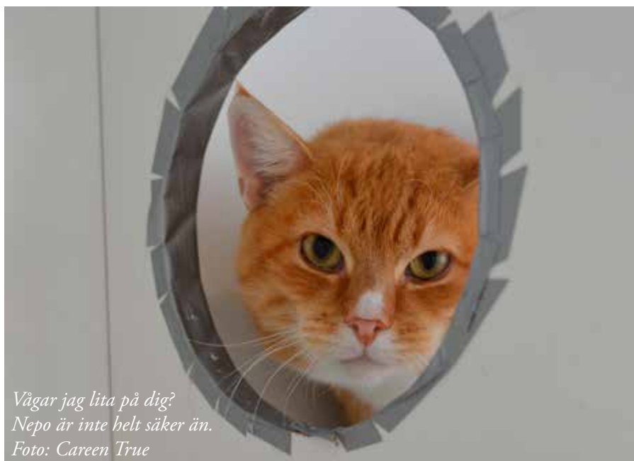
Vågar jag lita på dig? Nepo är inte helt säker än.

Att få en rädd katt med dåliga erfarenheter av människor att bli trygg och uppskatta vårt sällskap kräver kunskap, tid och tålamod. Det är ett jobb som alla på Kattstallet, volontärer så väl som personal, är lika engagerade i. För att vara volontär på Kattstallet innebär inte bara att tömma kattlådor och sköta hygien i katterummen. Minst lika viktigt är arbetet med att bygga upp katternas förtroende för oss människor. Varje gång vi kliver in på en avdelning