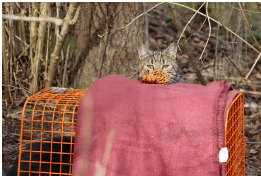
En av katterna undersöker infångarens utrustning. God mat ställs in i fångsburarna så att katterna blir vana vid dem.