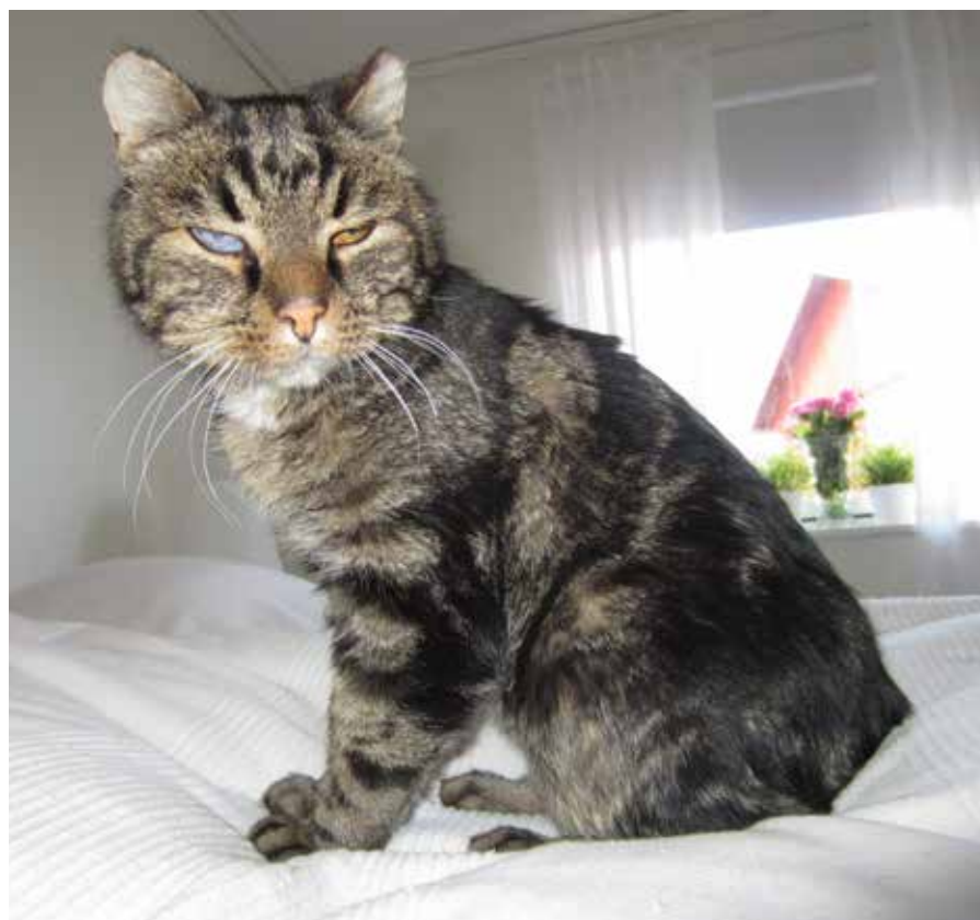
Cesar idag, mycket piggare med len päls, lekfull och gosig.