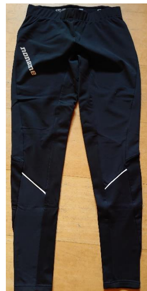
Vintertights 300 kr.