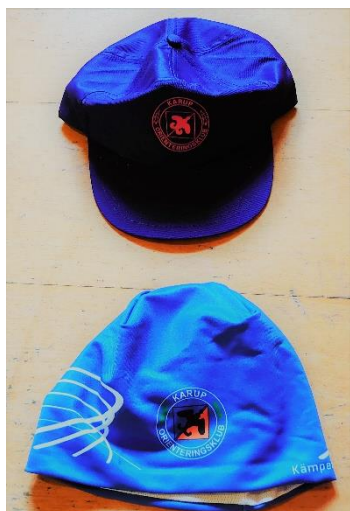
Kasket 25 kr.

Et lille udvalg af klubtøj, som vi har på lager i assorterede størrelser. Ved forespørgsel omkring klubtøj, skriv til naestformand@karupok.dk