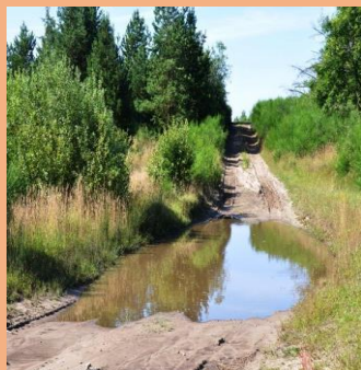
Udfordrende løbs ruter