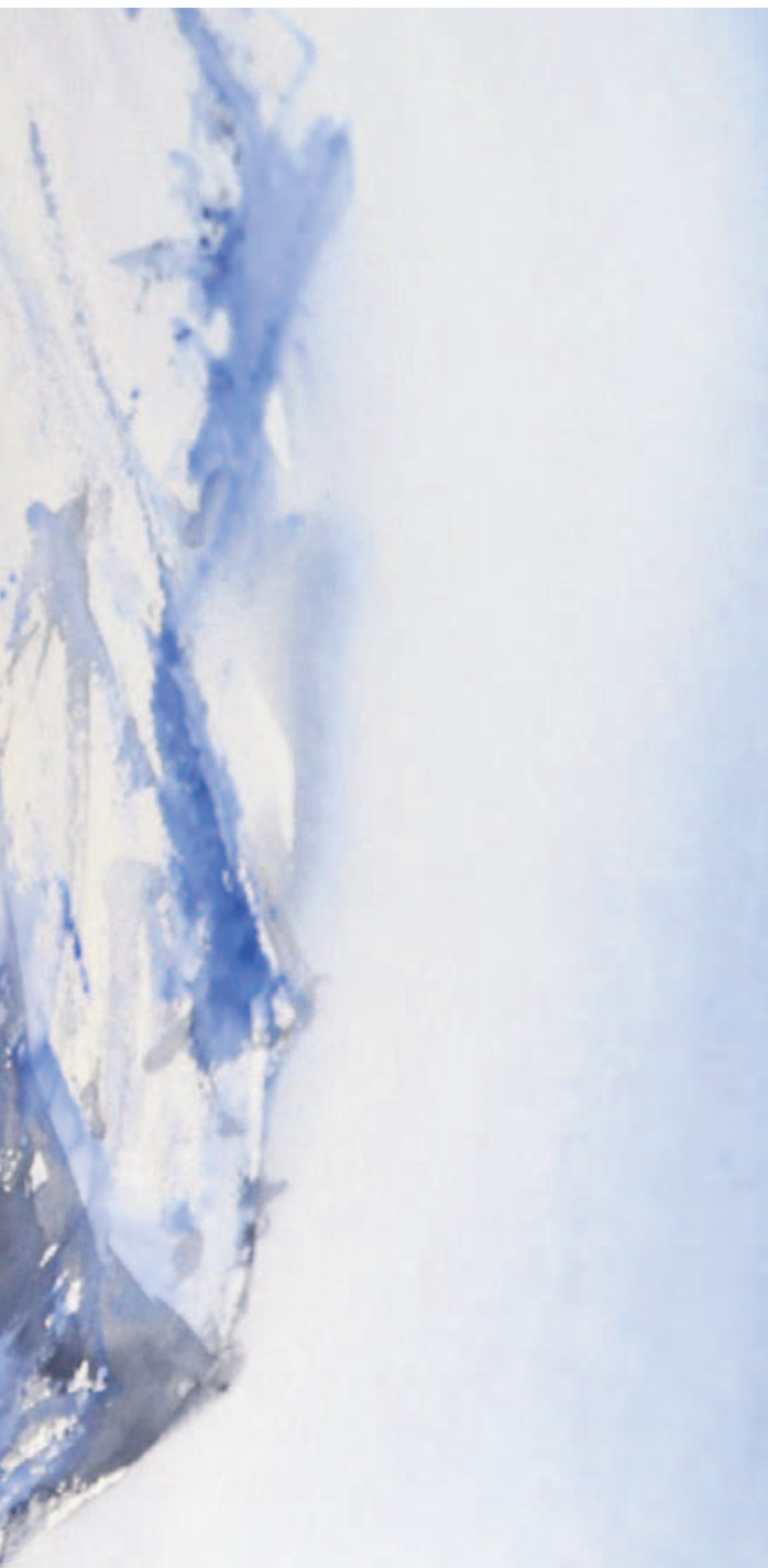
å heltid. Neste uke gir hun ut sin tredje bok med ord og bilder.

«Langs leia» er malt på Sommarøy. I forordet skriver Mr Sommarøy at det gjør godt for sjelen å se på Karis bilder.