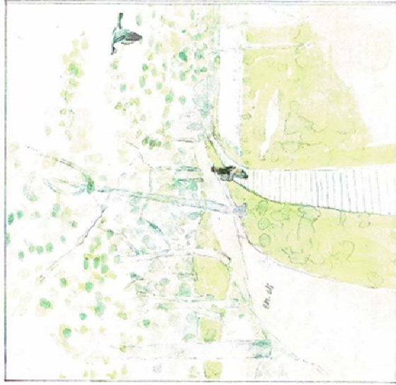
Forbi Lærkehuset mod porten til Amosens