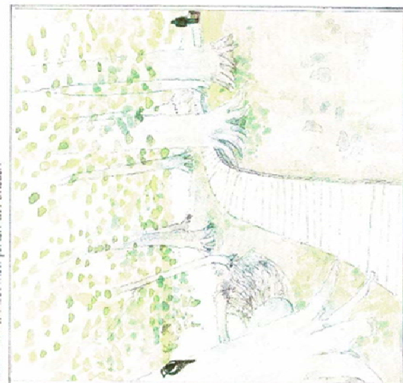
Tilbage med kig til Sølyst