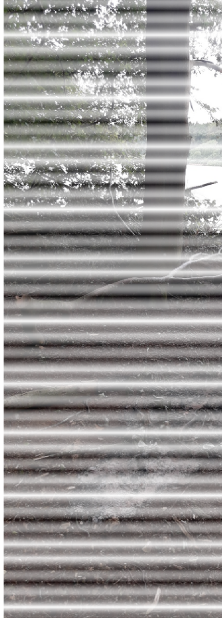
Billede 1: Ulovligt etableret fiskeplads maj 2020 i Dønnerups Skove ned til Skarresø. Bemærk de væltede træer og buske, afskårne grene på ældre træer og etablering af bålplads.

skovbunden. Nedenstående er blot to eksempler fra 2020 på den manglende respekt og viden om adgangsreglerne i privatejet skov