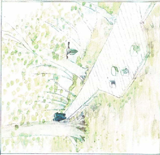
På vej langs søen

Naturområde ved Skarresø, Porten til Amosens