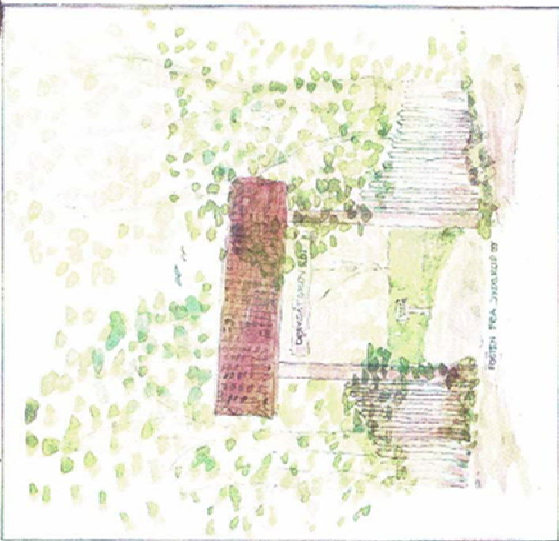
Porten til Drivstikstoven