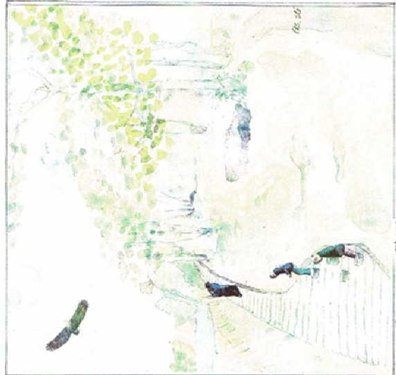
Færet på vej langs søen tilbage