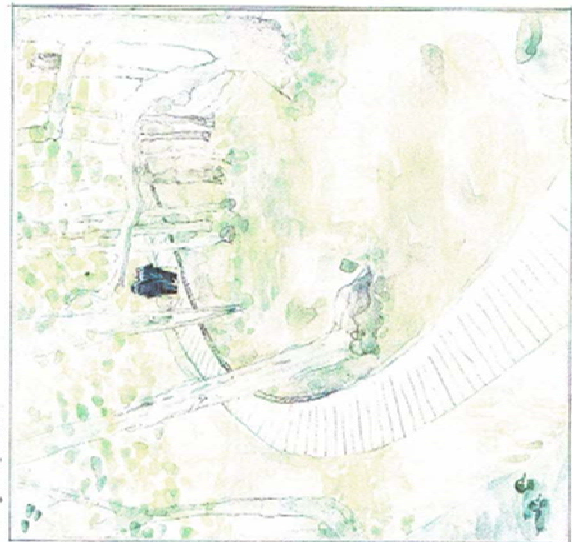
Fortsat tilbage langs søen