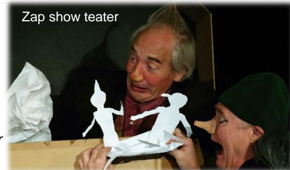
Zap show teater

Et originalt stykke moderne klovneteater