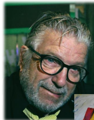
Maleri af Leif Sylvester

Musikken tager udgangspunkt i to af hans digtsamlinger "Mit og de andre" og "Danmark og mig".