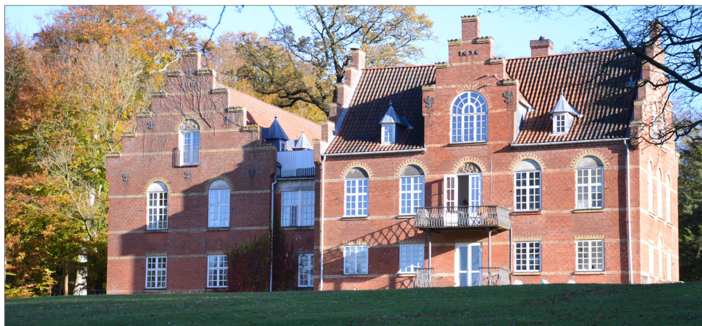
Sølyst set fra søen