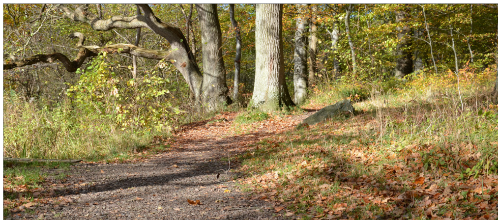
Jyderupstien vest for bymidten