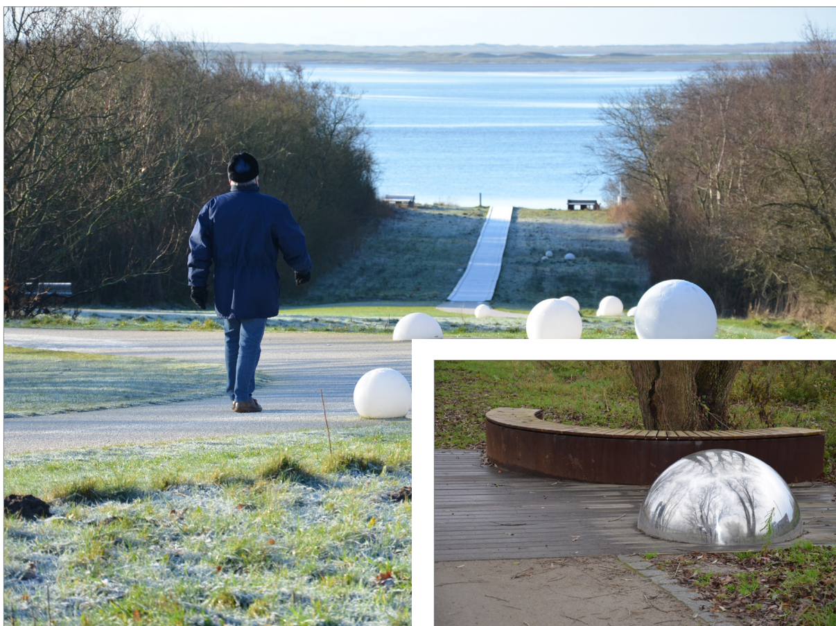
Inspiration fra Hjerting Strandpark og Kolding Å