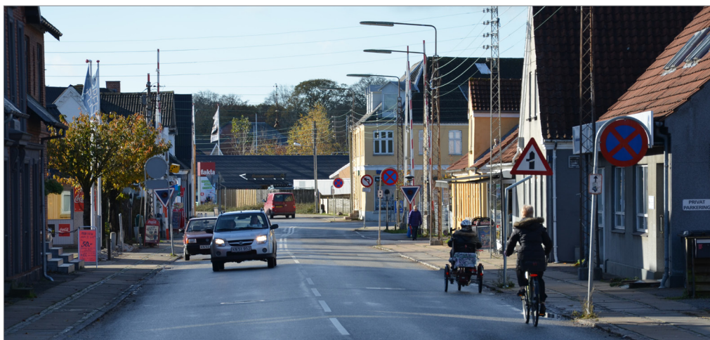
Holbækvej set fra nord mod jernbaneoverskæringen

Det vil være hensigtsmæssigt med etablering af en parkeringsplads for pendlere i nærheden af stationen. I bymidten kunne træbeplantning på parkeringspladser være med til at give bymidten en mere indbydende karakter.