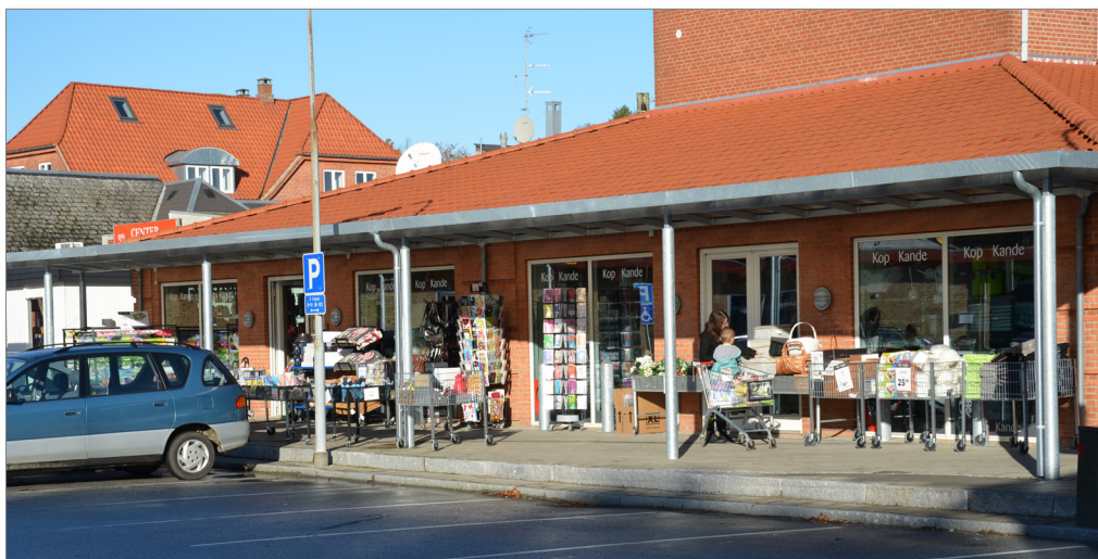
Udvalgs varebutik i bymidten

Her bør det overvejes at udvide afgrænsningen mod vest ud mod Sølystvej og kom-bineres med etablering af en trafikssikker adgang for gående til Sølystområdet. Vi-suelt kan der skabes en indbydende udsigt til Skarresø. Desuden bør bymidtens afgrænsning udvides mod syd. Dette vil muliggøre etablering af byrum og torvedan-nelser med bygninger på alle fire sider.