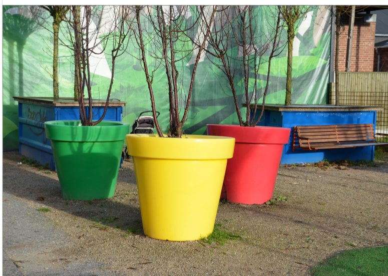
Eksempler på byinventar fra Vejle og Esbjerg