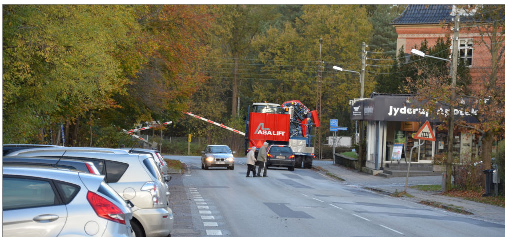
Besværlig krydsning af Sølystvej