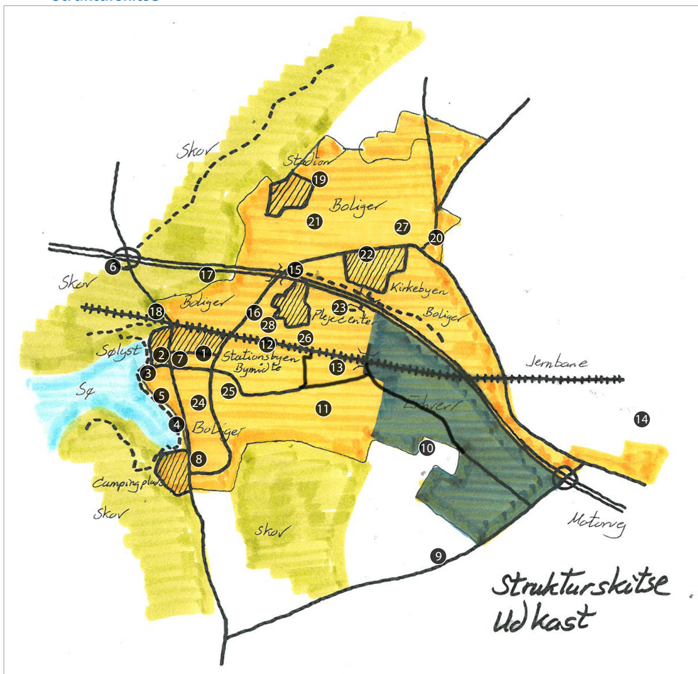
Idekatalog, arbejdskort med numre