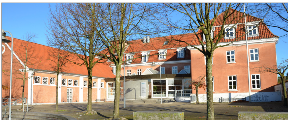
Bibliotek og aktivitetsplads i bymidten

Byen er overordnet set delt i byen nord for den kommende motorvej og byen syd for motorvejen. Forbindelsen mellem de to bydele foregår alene ad Holbækvej og den niveaufri gang- og cykel forbindelse mellem Industrivej og skolen. Besøgsmaalene forbindes med veje og stier. Nogle steder kan trafikikkerheden og fremkommeligheden højnes, hvilket eksempelvis bør ske på Holbækvej og industrivej.