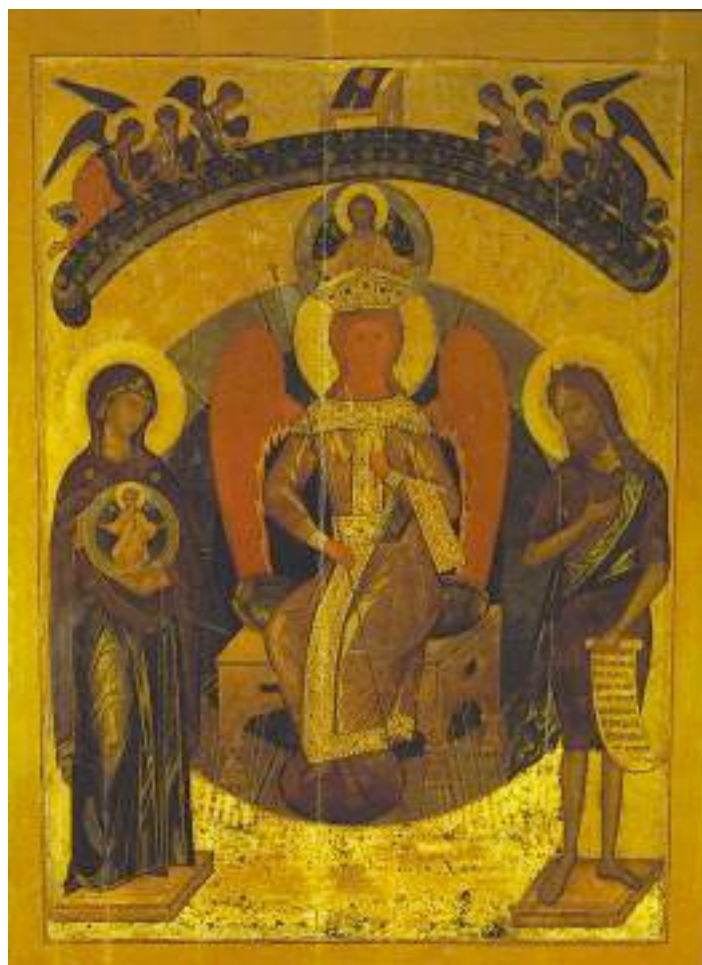
St Sofia, från Sophiakatedralen i Kiev

betraktas som Guds kvinnliga sida. I den examensuppsats jag skrev som avslutning på mina studier till Jungiansk analytiker vid Research and Training Centre according to CG Jung and Marie-Louise von Franz har jag mer utförligt beskrivit den vördnad med vilken Sofia omfattas i Östra Europas kristenhet.