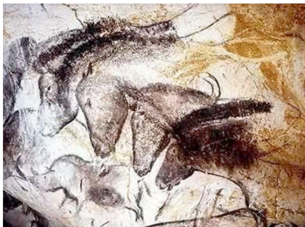
Väggmålningar från Lascauxgrottan

Själva grottorna är naturformationer, de är alltså inte formade av människohand, men målningarna i dem är imponerande, både på grund av graden av konstnärlighet och på grund av storleken. Trots att det skiljer väldigt många år mellan dem är motiven liknande – djur, som att döma av fosilfynd i närheten, har levt i dessa trakter. Återigen är antagandet att dessa bilder målades i någon sorts religiös ritual. I Chauvetgrottan har man också funnit en kultplats, en sorts altarliknande uppbyggnad kring vilken lämningar av björnar som slakats här har återfunnits och man antar att detta skett som ett offer.