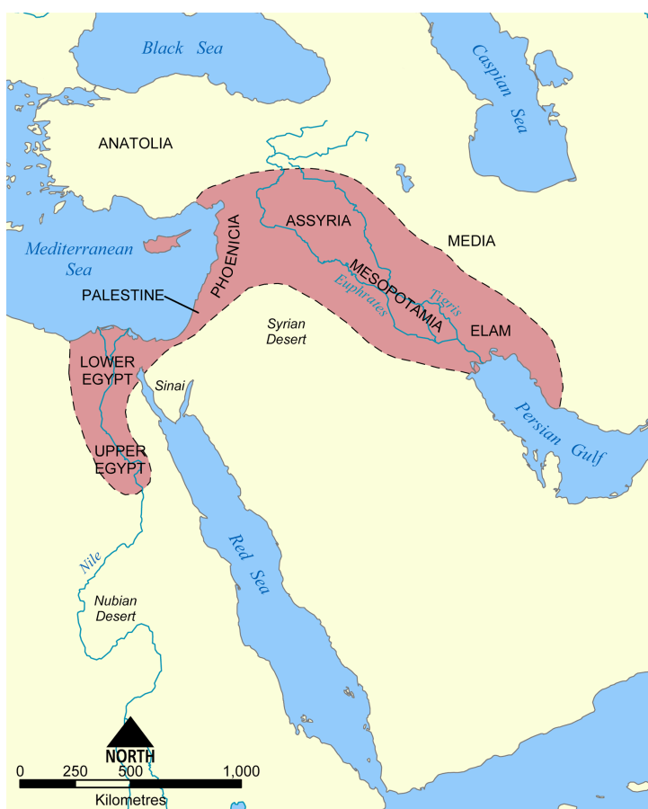
Den bördiga halvmånen

Göbekli Tepe är den största och mest imponerande kultplats i det område som kallas den bördiga halvmånen.