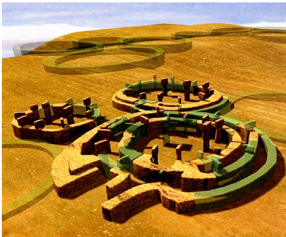
Modell av tempelområdet i Göbekli Tepe

I mitten på 90-talet kom en annan arkeolog, Klaus Schmidt, förbi samma område och tyckte att det påminde om ett annat ställe där han tidigare gjort utgrävningar, så han intresserade sig för stället. Här har man funnit ett stort område med rester av vad som tycks vara ett sorts tempel med de äldsta delarna från så långt tillbaka som 10 000 år före Kristus. Det är alltså från en tid då människorna som bodde i dessa trakter fortfarande var på jägar- och samlarstadiet, innan de börjat bli bofasta, börjat odla och producera mat. Byggnaderna här är ungefär 6 000 år äldre än de egyptiska pyramiderna. Området är känt under namnet Göbekli Tepe.