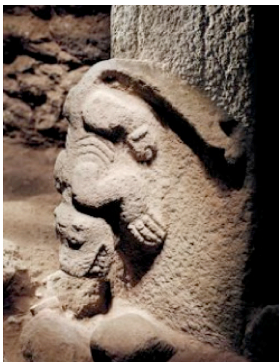
Skulptur från tempelområdet i Göbekli Tepe