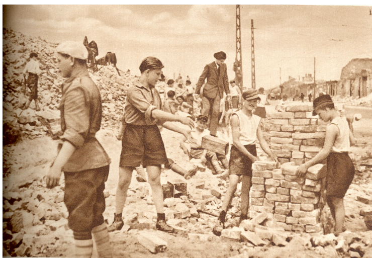
Warszawa 1945 – tegelstenar till återuppbyggnaden sorteras bland ruinerna

När jag föddes var Warszawa på väg att bli återuppbyggt och det var åter Polens huvudstad. Men Polen var inlemmat i Sovjets intressesfär och därmed förtryckt av den andra av de två grymma och totalitära ideologier som kostat över hundra miljoner människor livet under det blodbesudlade nittonhundratalet.