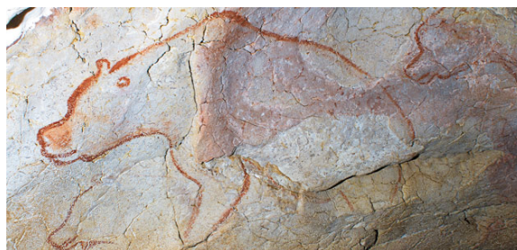
Väggmålningar från Chauvetgrottan