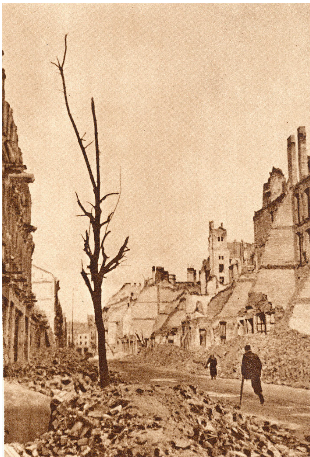
Warszawa efter upproret 1944

När jag föddes var Warszawa på väg att bli återuppbyggt och det var åter Polens huvudstad. Men Polen var inlemmat i Sovjets intressesfär och därmed förtryckt av den andra av de två grymma och totalitära ideologier som kostat över hundra miljoner människor livet under det blodbesudlade nittonhundratalet.