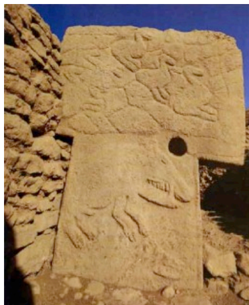
Reliefer från tempelområdet i Göbekli Tepe