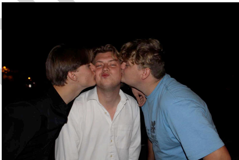
Figure 1 driebestematen

Bij vragen, bezorgdheden of een leuke babbel kan je altijd terecht bij ons: jongens@chirosas.be Xxx