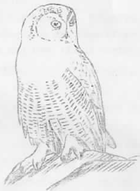
Fjalluggla ( Nyctea scandiaca )