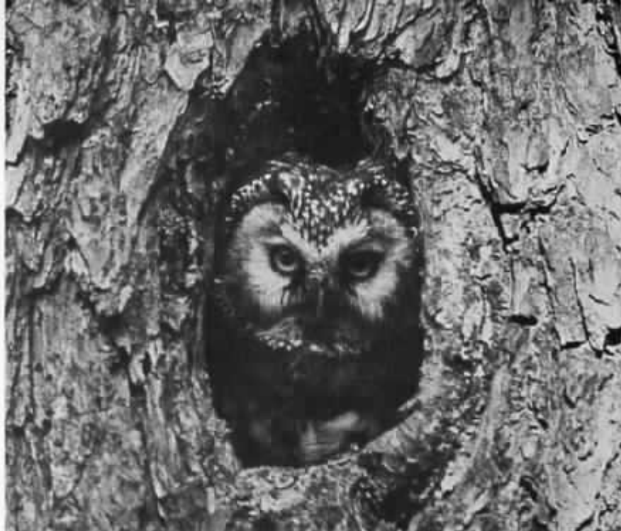
Första pärlugglan hördes redan 20 januari

Gråspett - den hona som under hösten 1973 hållit till vid Åby stannade t.o.m. påsken 1974 (KJ). På hösten sågs förmodligen samma fågel här igen. I övrigt noterades ett ex på Torrön 4/3 (SH AT), en ♂ i Sala Södra 23-24/3 (SH AT KJ),