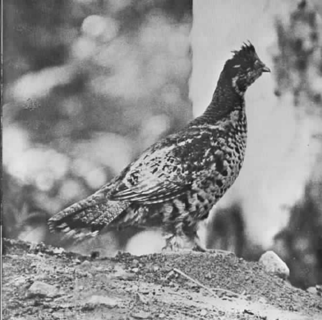
Järpen är tämligen allmän

Järpe - Under punkttaxeringarna i centrala Sala Södra 12/5-9/6 noterades järpe på sex lokaler. Utanför inventeringen sågs arten på ytterligare sex lokaler inom Sala Södra (SH n.fl.). Arten kan alltså betraktas som tämligen