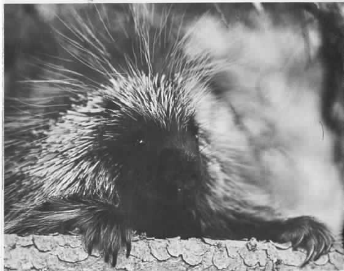
Trädpiggevin i Mc Kinley National Park