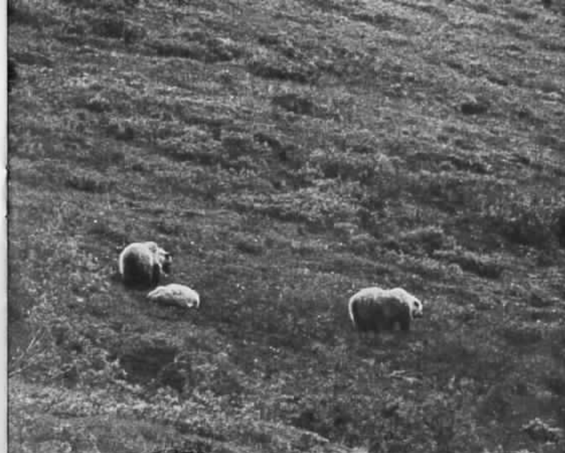
Grizzlybjörnar i Mc Kinley National Park

När man började känna sig utbränd och inte orkade ta emot fler intryck, dök Kodiak-öarna upp. De hade ett underbart pastoralt utseende. Direkt från hamnen i Kodiak City lyfte vi med flygplan mot Karluk Lake för att ta en match med laxfiskande björnar. Redan på kvällen folientektes lax över öppen eld på stranden. Vi sov gott och drödde om dagen som gått, om storfågel, grå lira, guffelstjärtad stormsvala, örnskarv, pelagisk skarv, vithövdad havsörn, labb, bredstjärtad labb, vitvingad trut, tretåig nås, allgrissala,