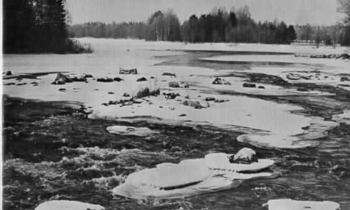
Forsarna vid Sevedskvarn

En bidragande orsak till utspelet om nationalpark var att kommunerna kring nedre Dalälven för ungefär ett år sedan bildade en samarbetskommitté med målet att få hela området förklarad som primärt rekreationsområde. Det fanns därmed en risk att kraven på olika rekreationsmålåtgångar helt skulle skjuta de vetenskapliga naturvårdsaspekterna åt sidan. Sjölvfallet måste social och vetenskaplig naturvård sammas i ett så stort och i förhållande till våra befolkningscentra lättillgängligt område. Det gäller dock att styra friluftslivet så att man inte förstår vad man vill skydda. Vid Färnebofjärden behöver det inte bli några värre kollisioner; de områden som är intressanta för det rörliga friluftslivet är i stort sett redan tagna i anspråk av detta och de områden som är väsentliga för vetenskaplig naturvård - större skogsområden, myrar, skogklädda strandkanter m.m. - är i allmänhet mindre intressanta för "vanligt friluftsliv". Vad som behövs är att man planerar verksamheten i de socialt använda områdena - Gysinge-Sevedskvarn; Östa, Nånset - så att de inte inkriktar på kringliggande markers naturvärden. Antalet båtplatser här bör exempelvis inte vara så stort, att det leder till oacceptabelt stor båttrafik på älven. Båttrafiken bör vidare regleras medelst bl.a. hastighetsbegränsningar och rent av motorbåtsförbud i vissa känsliga