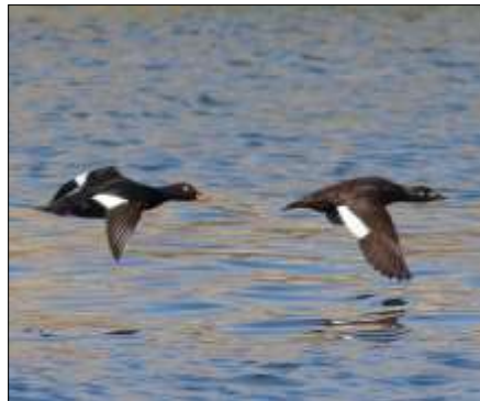
Svartor har noterats under året, dock inte så många som t.ex. sjöorrar och lommar.

och de allra flesta vråkar, sparvhökar m.m. går generellt längre västerut. Den period som har varit klart bäst bevakad genom åren är mars och första halvan av april. I år blev dock ett undantag pga. coronaviruset. Vi följde rekommendationerna och höll oss på hemmaplan hela våren och vad passade då inte bättre än att hårdbevaka Mälarklippan. Det var verkligen kul att, en gång för alla, täcka in andra