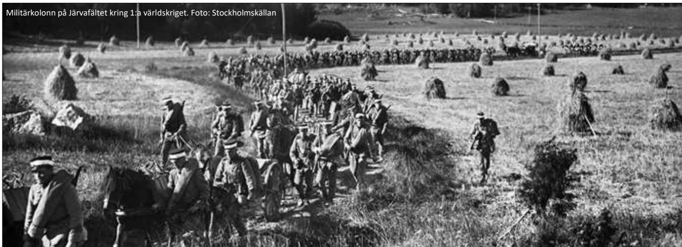
Militärkolonn på Järvafältet kring 1:a världskriget.