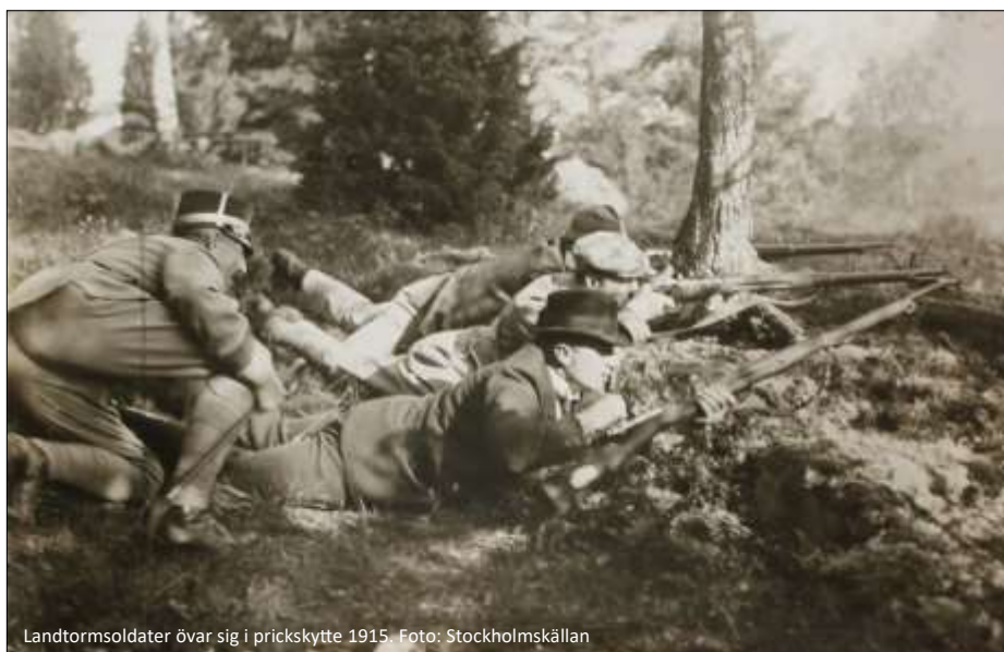
Landtormsoldater övar sig i prickskytte 1915.