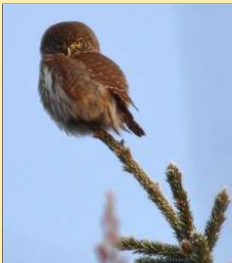
Inte ens en sketen liten sparvuggla såg vi...

set från första bilen. Inte mycket att skryta med. Efter samråd beslutades att åka över till Börje sjö och lyssna framför allt efter pärluggla, men även efter slaguggla. Båda arterna hade hörts där, även om det inte var dagen innan.