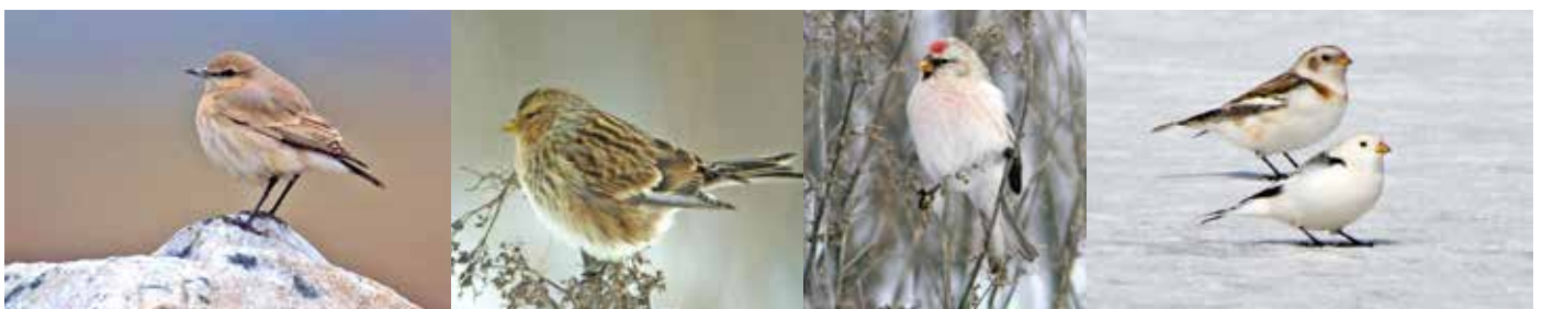
Isabellastenskvätta. Foto: Lars Friberg©. Vinterhämpling, Snösiska och Snösparv. Foto: Olle Bernard©