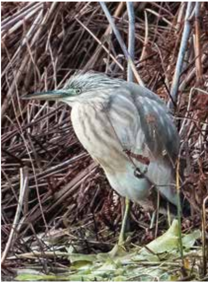
Rallhäger vid Översjön.

Inleder årets första JOK-blad med en återblick på några av fjolårets mest trevliga händelser för oss skådare på Järvafältet.