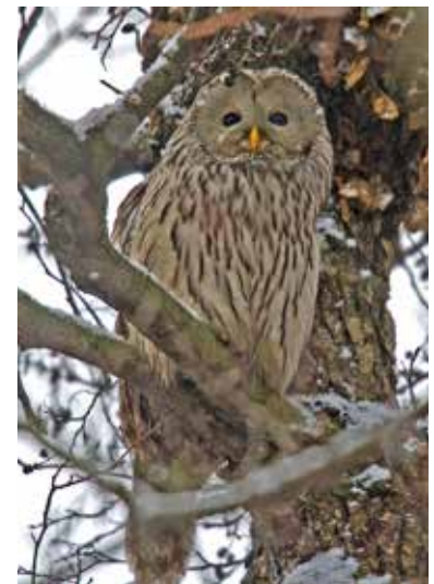
Slaguggla vid Råstasjön 2012.