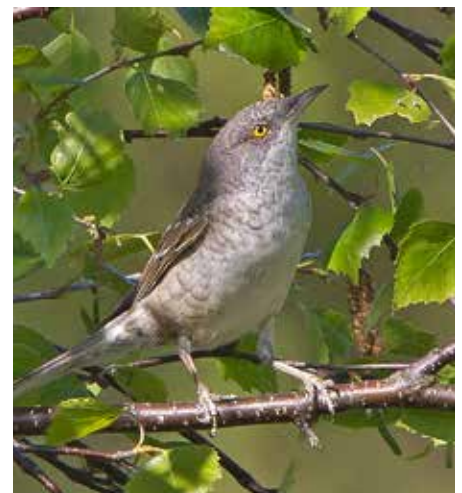
Höksångare i Ottenby.

Fynd nummer två gjordes i 30-meterskärrret den 30/8 2010, i dungen vid Igelbäckens dämme. Även detta var en ung höksångare, som upptäcktes av en alert "Matte" Weiland. Denna höksångare stannade kvar vid dämnet under några eftermiddagstimmar. ●