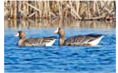
Bläsgäspar på Säby strandäng.

Den dittills enda kända pärlugglehäckningen på Järvafältet konstaterades norr om Nysved år 1982.