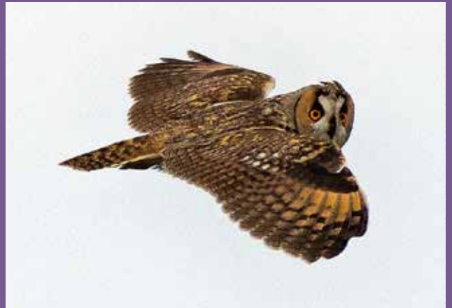
Hornuuggla vid Ottenby 2014.