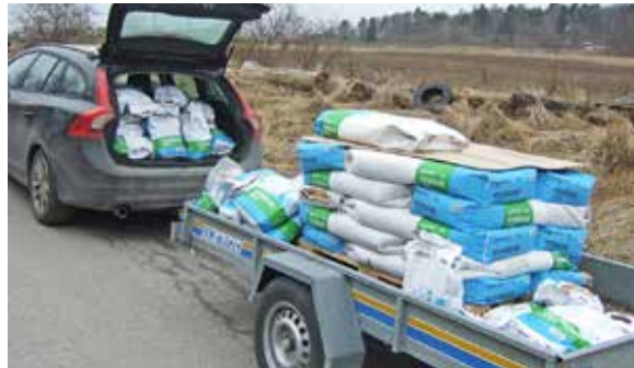
Transport av fågelfrön.

Även denna vinter har JOK anordnat fågelmatningar på norra delen av Järvafältet och i år på flera platser än någonsin tidigare. Matningar fanns som tidigare söder om Säbysjön, väster om Fäboda, nära Mulltorp samt norr om Ravalen, den senaste i samarbete med Sollentuna kommun. Dessutom öppnade vi under den gångna vintern en ny matning norr om Säby gård, vilken fick en placering som uppskattats av fåglar, skådare, fågelfotografer och s k allmänhet.