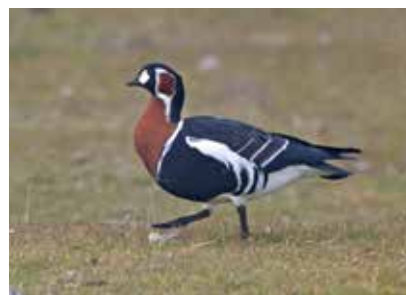
Rödhalsad gås vid Ottenby.

Anmälningsavgiften, 600 kr, ska vara inbetald på JOKs pg 58 01 32 - 9 senast en vecka efter anmälan.