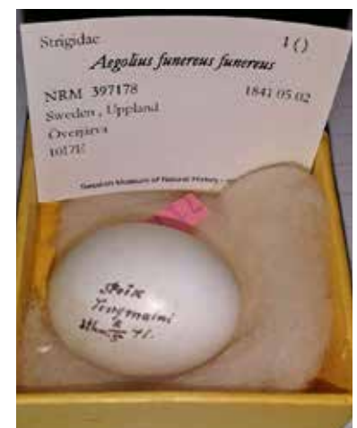
Pärluggleägg hos Naturhistoriska Riksmuseet.