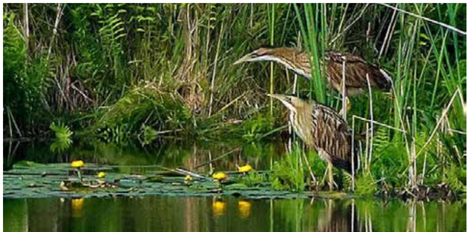
Rördromsungar vid Säbysjön.

En stillsam förhoppning är att JOK i framtiden ska kunna producera åtminstone tre tidningar i färg/år. Ett fjärde JOK-blad (= årsrapporten) kommer liksom tidigare att tryckas i svartvitt. En förutsättning för fler JOK-blad är att fågellivet och skådandet på Järvafältet fortsätter att vara lika omfattande som i dag. ●