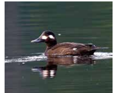
Svärta vid Ravalen.