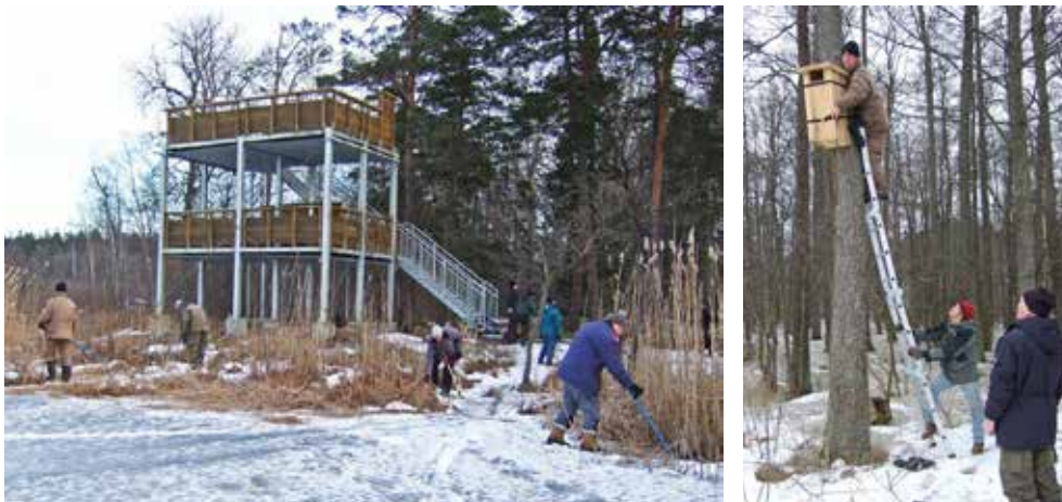
Vass- och slyröjning vid Säbysjöns fågeltorn samt uppsättning av knipholk vid Säby gårds kanal.

Att ringa på polis upplevs inte som någon lockande lösning. Undertecknad önskar att jag har fel, men jag tror tyvärr att den önskade insatsen därifrån uteblir, eftersom polisen förmodas lågprioritera ett brott som tjuvfiske. ●