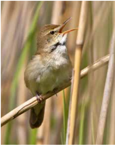
Busksångare på Järvafältet.

Antalet fynd av busksångare på Järvafältet har under de senaste fem åren uppvisat en trevligt positiv trend.