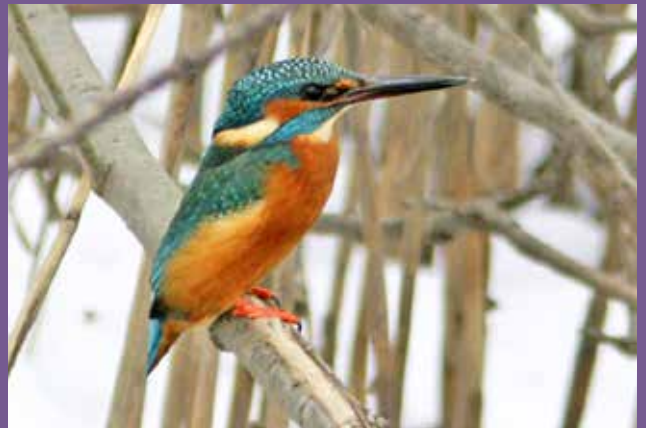
Kungsfiskare vid sjön Trehörningen 2009.