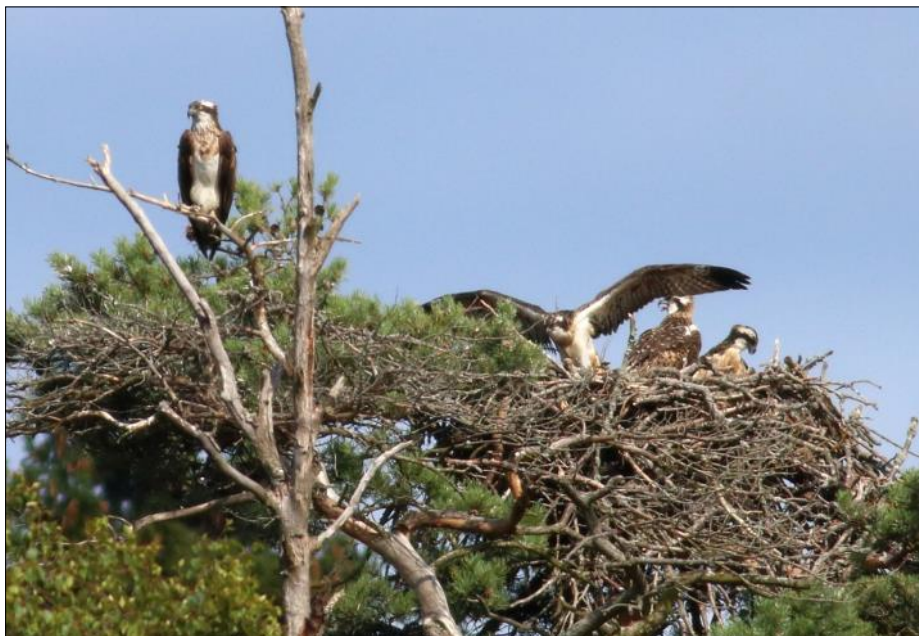
Den för alla JOK:are välkända fiskgjuseboet på Kärleksholmen i Säbysjön. En vuxen fågel sitter och spanar, medan de nästan flygga ungarna flygtränar på bobalen.