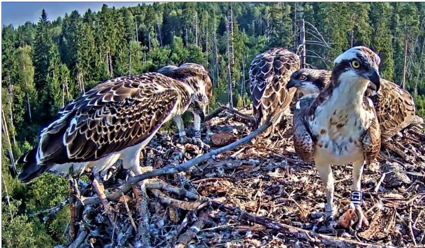
Trängsel i gjusboet. Här dokumenterat med en fast kamera kopplad till nätet, där allmänheten har möjlighet att följa häckningen från sin dator eller mobiltelefon dygnet runt. I det här fallet ett bo i Estland under sommaren 2018. Fotot är helt enkelt en skärmdump från den pågående utsändningen, som även tillhandahåller ett perfekt ljud från boet och dess omgivning.